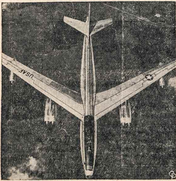
STRATOSFERINIS BOMBONISIS, pats greičiausias to tipo, pirmą kartą leistas parodyti viešumai. Jis skrenda daugiau kaip 600 mylių į valandą, gali pakilti iki 40,000 pėdų aukščio ir panešti bombų krovinį iki 10 tonų.