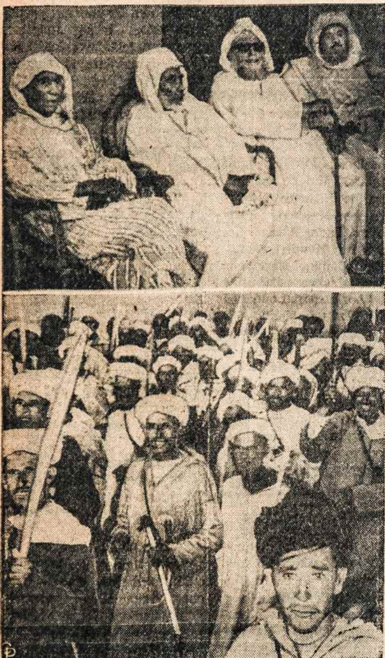
MAROKE prancūzai pašalino sultoną Mohammed Ben Youseff. Jo vietoje pastatytas Marrakešo pasha El Glaoui (aukštai kairėje). Apačioje matome Marroko sūkdėlius prieš sultoną.

Gražiai "Laisvė" kalba apie Sovietų rojų, bet kai teismas nori jos redaktorius gabenti į rojų, šaukia: gelbėkit. Kaip tas sovietų kareivis: aš nenoriu ir rojų, aš dar noriu pagyventi. Dar gražiau "Laisvė" išėina su pinigais: tik neseniai šaukė prieš pinigus, kad jie būtų skirti Kersteno rezoliucijai įvykdyti ir iširti, kaip ten Baltijos kraštuose buvo tas bolševikiškas rojus įvestas, o dabar šaukia: dėkit pinigus, kad mūsų buvusiam redaktoriui nereikėtų į tą rojų keliauti.