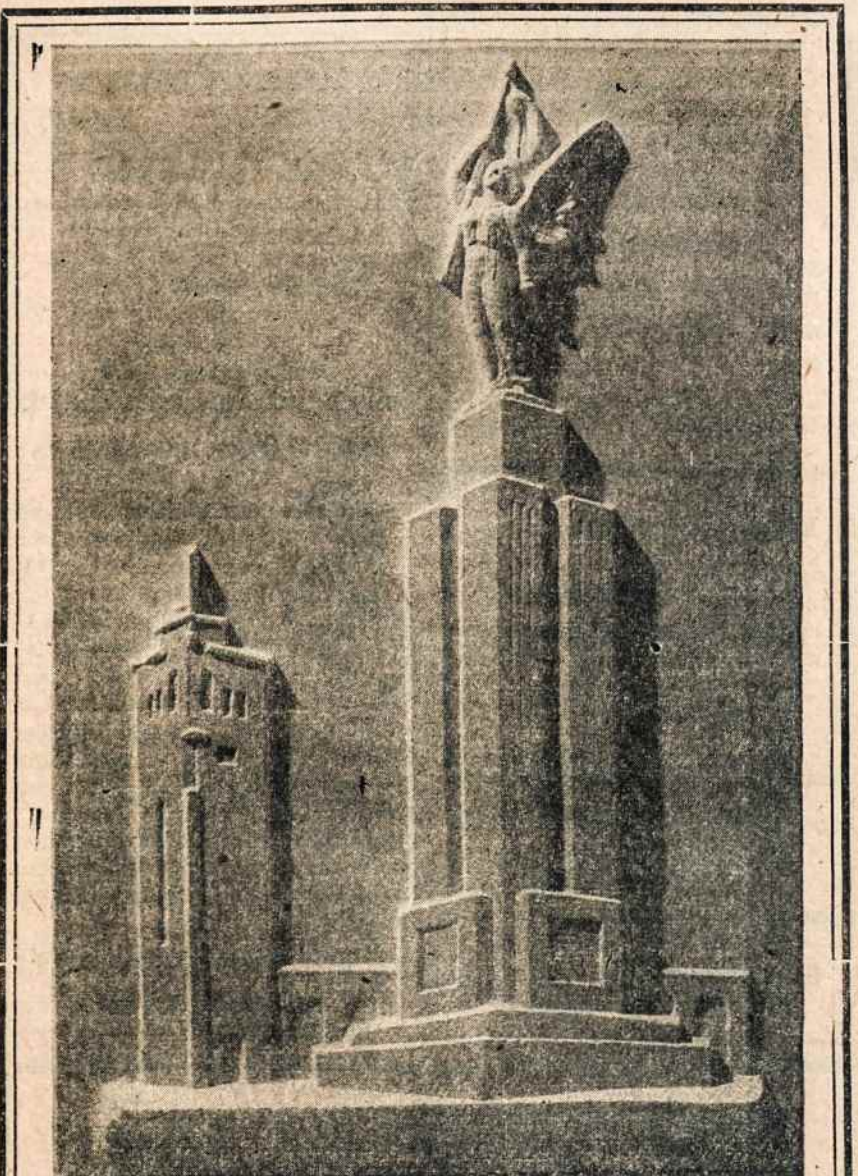
Papuoši savo kambarį ar įstaiga ir prisiminsi Lietuvą, įsigijęs