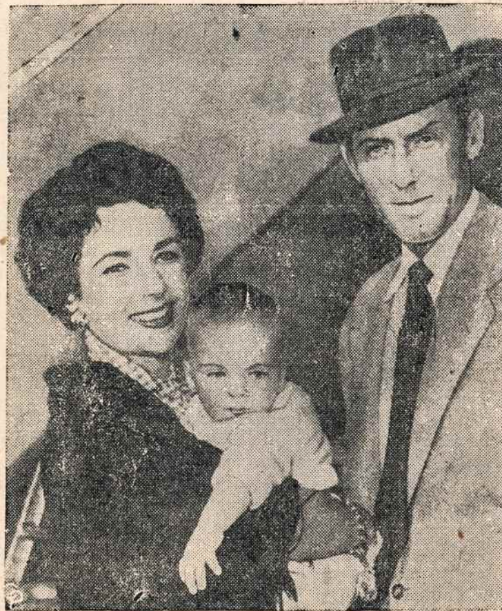
GIMTASIS KRASTAS TRAUKIA ir Hollywoodo žvaigždes. Filmu žvaigždė Elizabeth Taylor su savo vyru Michael Wilding iš New Yorko išskrido į Angliją parodyti savo tėvams sulaukto sūnelio. Jie ten laukys ir bažnyčia, kurioje susituokė.