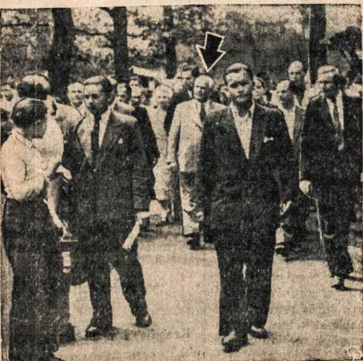
APSUPTAS SAUGŲ LANKU, rytų Vokietijos "prezidentas" Wil-helm Pek, lanko Berlyne komunistinę jaunimo stovyklą. Net ir sa-vųjų tarpe negali pasirodyti be stiprios apsaugos.