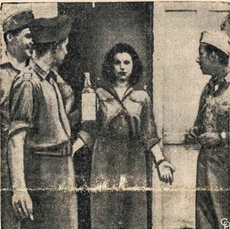
Lenkija visada buvo garsi savo moterim. Rusija savo vodka. Surusintos ir subolševikintos Lenkijos ženklą turim prieš akis — tai lenkė su buteliu vodkos rankoje. Ji sveikina Korejoje neutraliosios komisijos narius švedus ir šveicarus.

Ar naujoji vyriausybė bus palanki anglam, tuo tarpu dar sunku pasakyti. Pahlevi, šachas, visada buvo laikomas jiems palankus. Bet pats Zahedi ragavo anglių kalėjimo. O ir nacionalizacijos rato vargiai bepasuksi atgal. Tad lieka tik kelias naujom derybom naujais pagrindais.