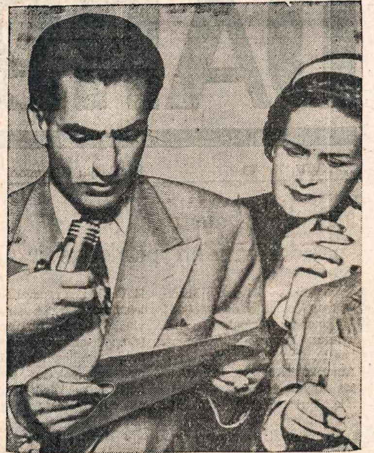
MOHAMMED RIZA PAHLEVI, Persijos šachas, apsuptas laikraščiu korespondentų Romoje, skaito laiška, kurį jis pasiuntė persų tautai per jo paskirtą ministrą pirmininką gen. Fazollah Zahedi, kuris nuvertė Mossadegh. Sachas jau grįžo į Teheraną.

• Iš Hamburgo, Vokietijos išplaukia laivas į Karibų jūras tyrinėti jūrų gyvūnų ir augalų. Laivas turi specialius švyturius, kuriais ausviečia aplinkui per 630 metrų ir į jūros gilumą per 100 metrų. Turi taip pat elektrinius įtaisus, kuriais galima apsiginti nuo jūrų gyvūnų arba ir juos gaudyti. Ekspedicija sutruksianti apie 8 mėnesius. Bus suuktas ir jūros povandeninio gyvenimo filmas.