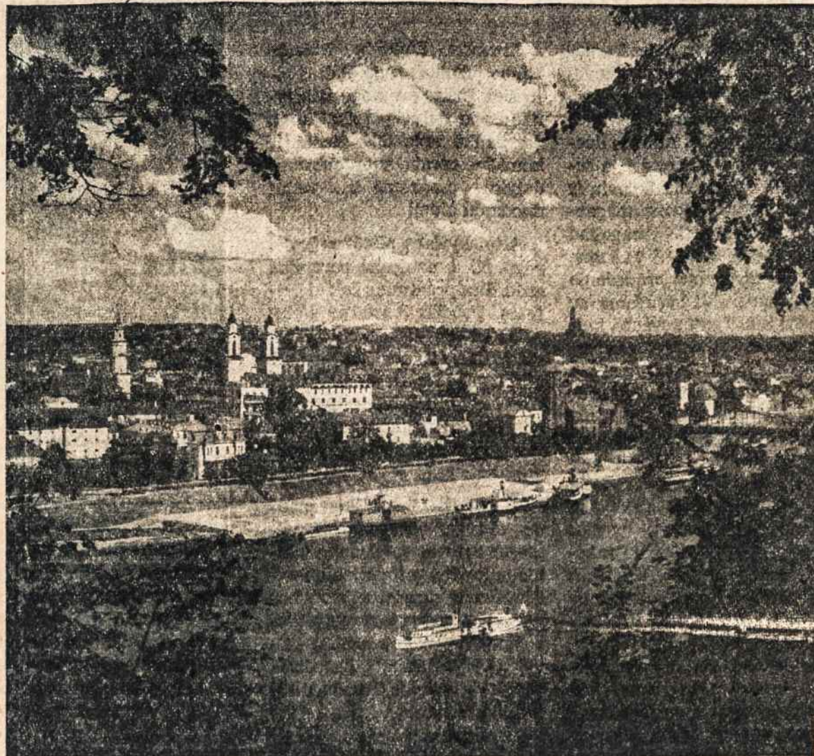
Kauno miestas su laivų prielauka.

Liepos mėn. pradžioje pavyksta surasti susisiekimo priemonę kelionei į Žemaitiją. Motina visai nė negalvoja apie Vokietiją, šventai įsitikinusi, kad bolševikai Aukštaitijoje ilgai neužsisibus, nekaltant jau apie Žemaitiją, kurios tikrai nepasiekės. Toks įsitikinimas bujoja apylinkės žmonėse, tam tikri ir motina. Turbūt, pasėkoje nesugriauanamo pamaldumo ir pasitikėjimo Dievo gerumu, neįsivaizduojant kaip ir už ką Dievas vėl gali Lietuvą bausti... (B. d.)