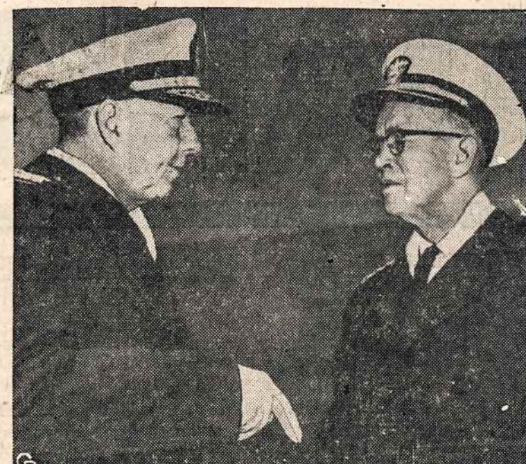
ADM. A. R. CARNEY (deš.), jūrinių operacijų viršininkas, grįžęs iš Tolimųjų Rytų inspekcinės kelionės, kalbasi su savo pagelbininku adm. D. B. Dunkan.

Laimė dar sykį šyptelėjo „Bismarkui“. Britų karo laivo