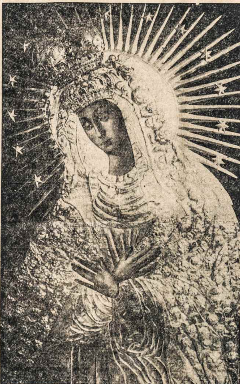
Gailestingoji Dievo Motina Aušros Vartuose Vilniuje.

Marija to norinti ir dabar, nes visa bloga, kas mus supa šiais laikais, "savo šaknis turi atsisakyme Kristui paklusti." Tu būdu žmonės yra atsisky-rė nuo "gyvojo vandens vers-mės ir išsikasę sau duobes, ku-rios vandens nelaiko" (Jer. 2,13).