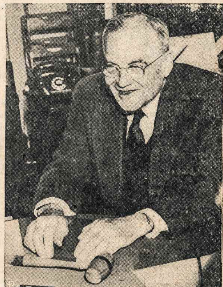
F. DULLES, valstybės sekretorius, liudijo Kongrese apie Baltijos valstybių okupaciją.