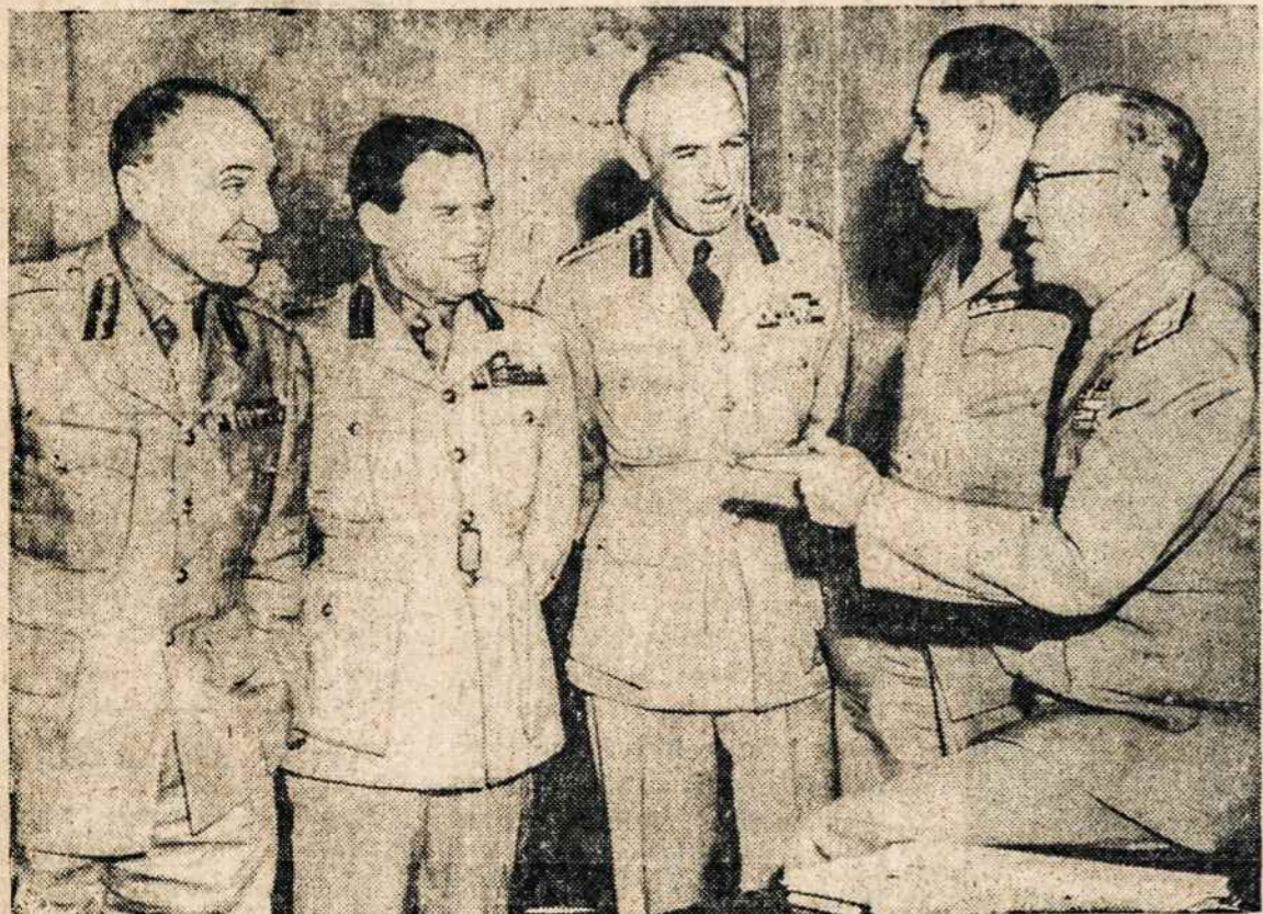
PENTAGONE susitiko pasitarti karo vadai (iš k. į d.) N. Zelandijos, Britanijos, Australijos, Prancūzijos ir JAV.

The U. S. Government does not pay for this advertising. The Treasury Department thanks, for their patriotic donation, the Advertising Council and