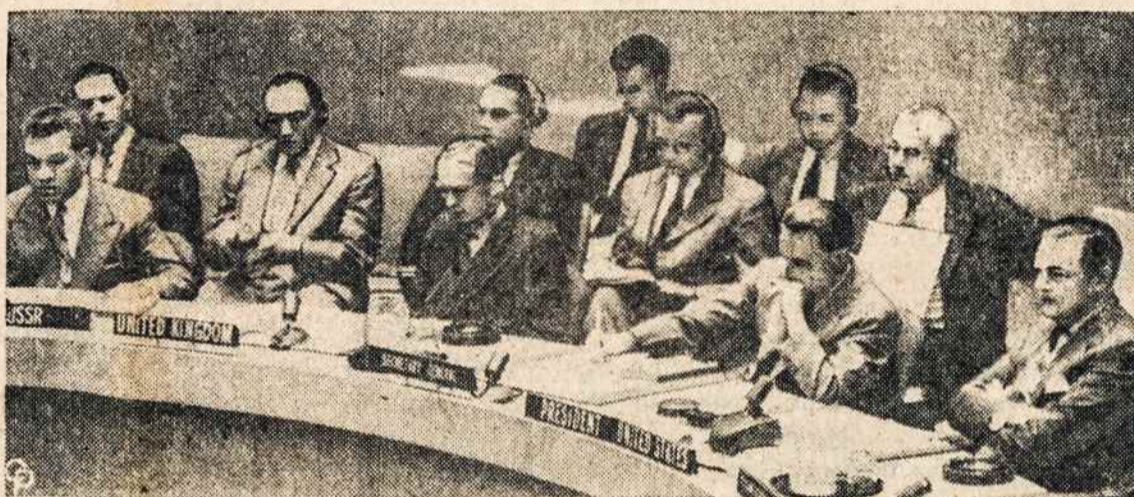
JUNGTINIŲ TAUTŲ Saugumo Taryba sprendžia Thailando siūlymą siūsti stebėtojus į Indokiniją

Sen. Knowland, resp. lyderis, birželio 5 pareiškė, kad Amerika ir jos sąjungininkai turi apsispręsti per 30 dienų. Esą laisvasis pasaulis yra tuo tarpu komunistai tvirtai žygiuoja Hanoi paimti. Tai gali įvykti per 30 dienų... Senato-