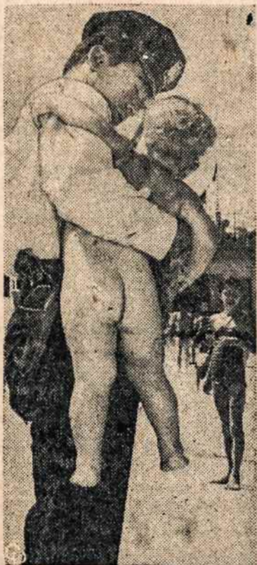
KARŠTĄ DIENĄ policininkas rado vaiką... be tėvų ir be rūbų.