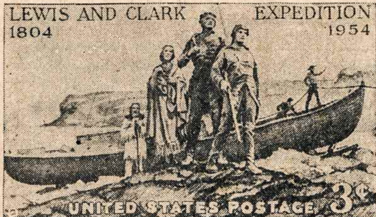
PASTO ŽENKLAS, išleistas JAV prisiminti 150 metų sukakčiai nuo Lewis ir Clark ekspedicijos.