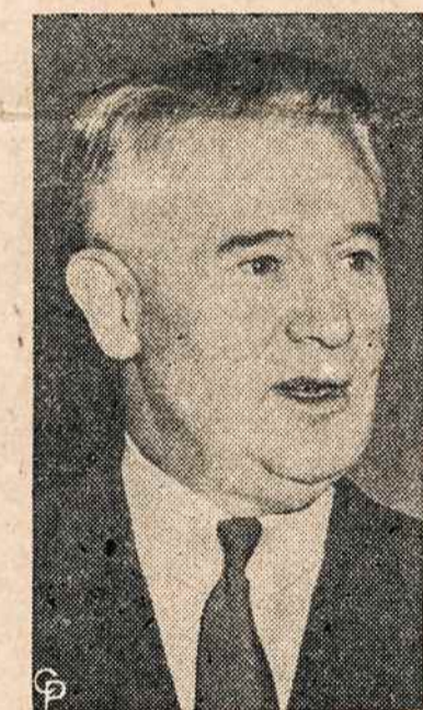
SEN. LESTER HUNT, demokratas iš Wyoming, nusizudė Washington, senatorių namuose. Jis savo laikė "pažangiu liberalu."

Kanađą, Danijos Grenlandiją, Islandiją, britų Bermudą, ispanų Kanarijas, portugalų Azorus, Madeirą ir Cabo Verde, visų valstybių salas Vakarų Indijoje, Meksiką ir visą centrinę Ameriką, taip pat milžinišką skaičių mažų salelių Ramiajame vandenyne. Amerika savo plotą padidintų apie pus-triečio karto, o gyventojų skaičius jos kolonijose ir Amerikoje siektų 240 mil. Tačiau teritorijos jai taip parinktos, kad