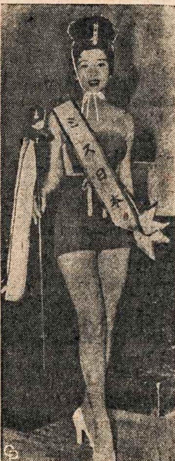
Japonijos 1954 m. gražulė