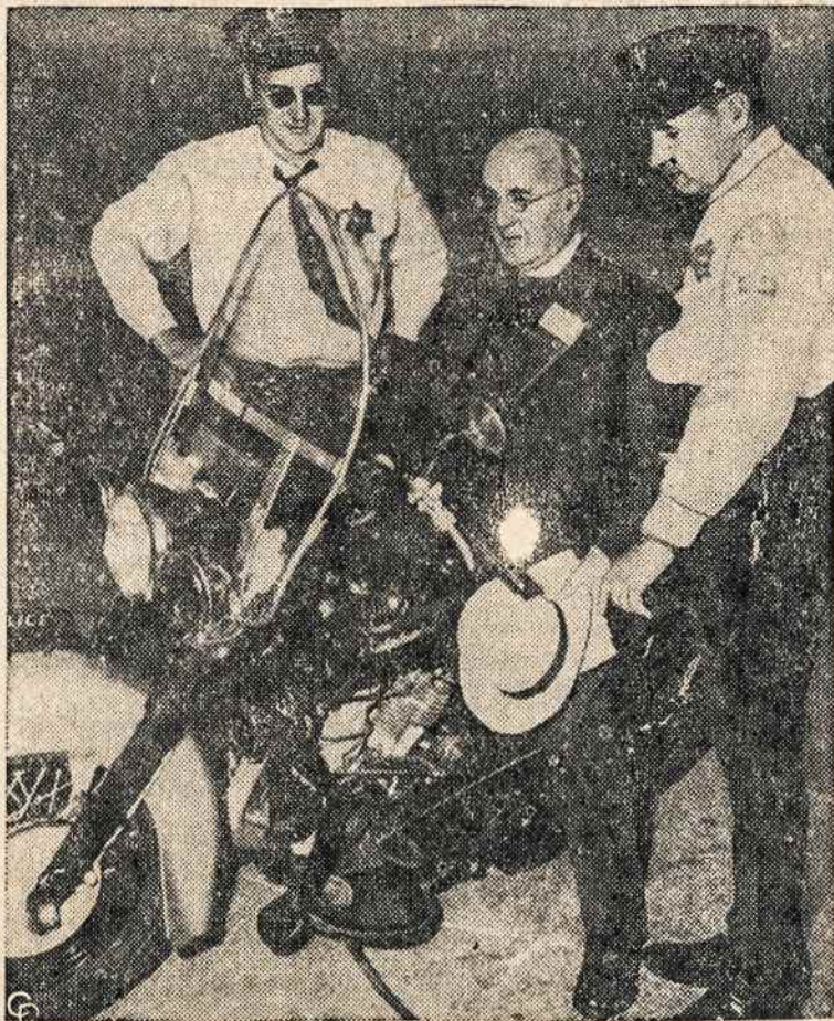
DR. G. FISHER, Kenterburio arkivyskupas, Anglijoje, atvykęs į World Council of Churches, Chicagoje, policininkų mokomas susiekimo tvarkos. Anglijoje ji kitokia.