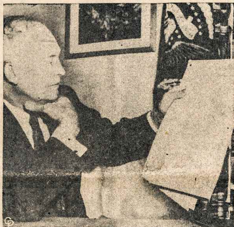
PREZ. D. EISENHOWERIS, išvykęs atostogų į Denver, Col., pasirašo komunistų partijos kontrolės įstatymą.

Amerikos laivynas Pacific gins nuo komunistų ne tik Formozą, bet ir kitas salas, kurios priklauso nac. Kinijai.