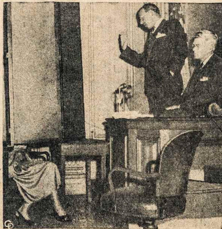
BOLŠEVIKŲ išprievartauta vengrė moteris, už uždangos, liudija Kongreso komisijai, kuri apklausinėja, kaip Vengrijoje bolševikai siautėjo. Priesaiką priima atstovas A. Bentley.

Izraelis pagrobė Libanono laivą, įplaukusį į Izraelio vandenį.