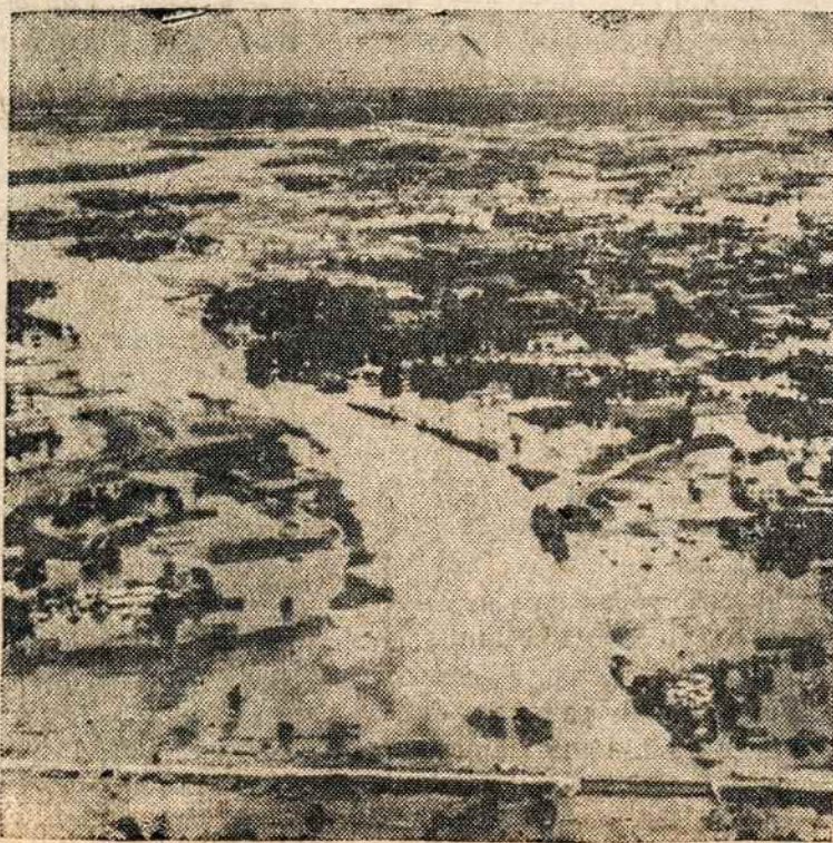
PAKISTANA ištiko baisus potvynis, kuris paliko be namų 7 mil. gyventojų. Amerikiečiai pasiuntė lėktuvus žmoniems gelbėti.