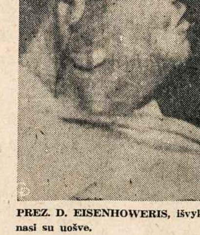
PREZ. D. EISENHOWERIS, išvykęs į Denver, Col., atostogu, sveikinais su uošve.

ir dėl to alkanų darbininkų rankos nebeapsiekia duonos. Savo pastangų bergždumą sutvarkyti gyvenimą pagal Markso mokslą yra jau pamatę patys bolševikai. Jie stengiasi tikrai įtikinėti, kad bus geriau, kai visas pasaulis bus sukommunistintas. Tai yra jau tikėjimas, savotiška religija, ateities mistika, kuria dar dumia akis nematantiems tikrovės ir atsilikusiems nuo gyvenimo