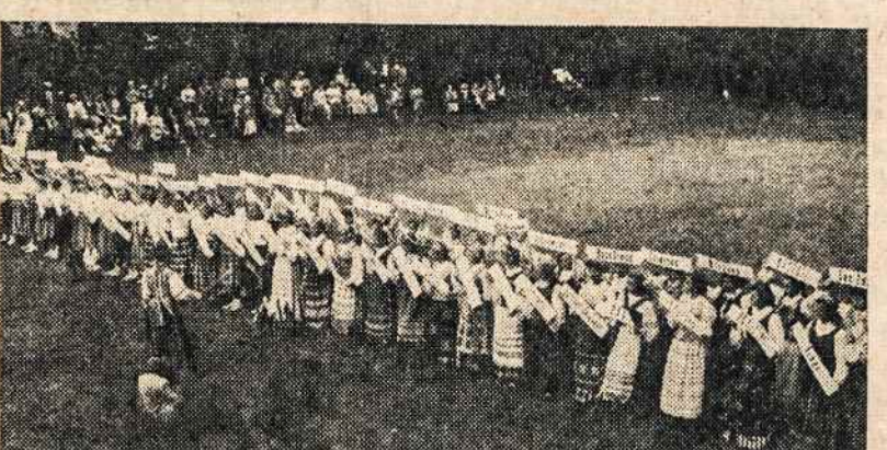
SPAUDOS MARSAS, kurį atliko mergaičių stovykla lietuvių susiartinimo šventėje Putnam, Conn.

DARBININKAS 680 Bushwick Ave. Brooklyn 21, N.Y.