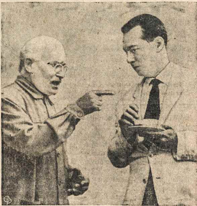
A. TOSCANINI, žymus italų dirigentas (l.), padėjo lazdele ir užsitarė nuo pasaulio prie Maggiore ežero.

Nors "Vytyties" leidėjai ir redakcija daro visa, kad žurna-