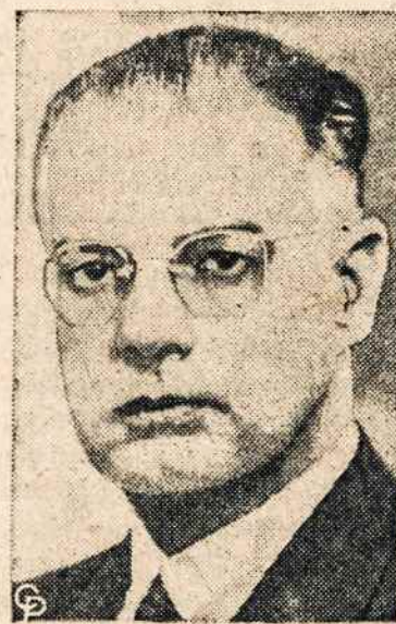
GEN. ED. GOMES, nacionalistų demokratų partijos lyderis, priešvertis nusišovė Brazilijos prez. Getulio Vargas.

Politikoje Vargas siekė krašto ūkinio savarankiškumo ir stengėsi išlaisvinti nuo svetimo kapitalo išnaudojimo, mėgindamas pakelti krašto pramonę. Rėmėsi (kaip ir dera jo pavardės žmogui) daugiau neturtingaisiais. Dėl to jų tarpe buvo populiarus. Juos prisiminė ir paliktame pomirtiniame laiške, apgailėstaudamas: "ne visa galėjau duoti vargšams, ką norėjau jiems duoti." "Times" pastebi, kad būdamas antikomunistas, paskutiniu laiku jis