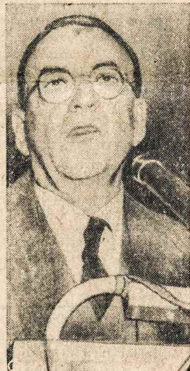
JOHN F. DULLES, valstybės sekretorius, spaudos atstovam pareiškė, jog jis dar tikis, kad Prancūzija prisidėsianti prie Europos Saugumo pakto.