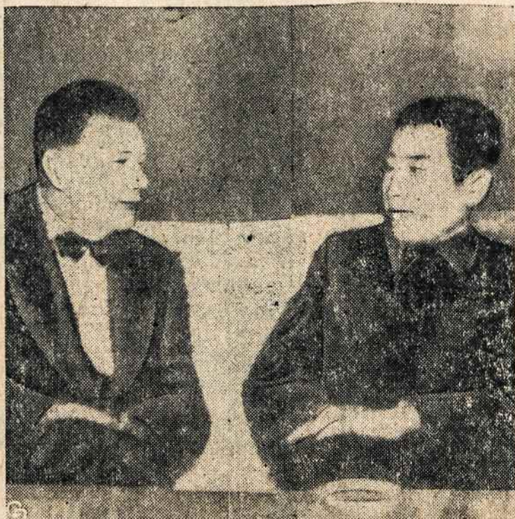
DAG HAMMARSKJÖLD, JT gen. sekretorius, derasi su raudonosios Kinijos min. pirm. Chou En-lai dėl Amerikos lakūnų.

— New Yorke protestantai pradėjo kovą prieš bingo lošimo legalizavimą.