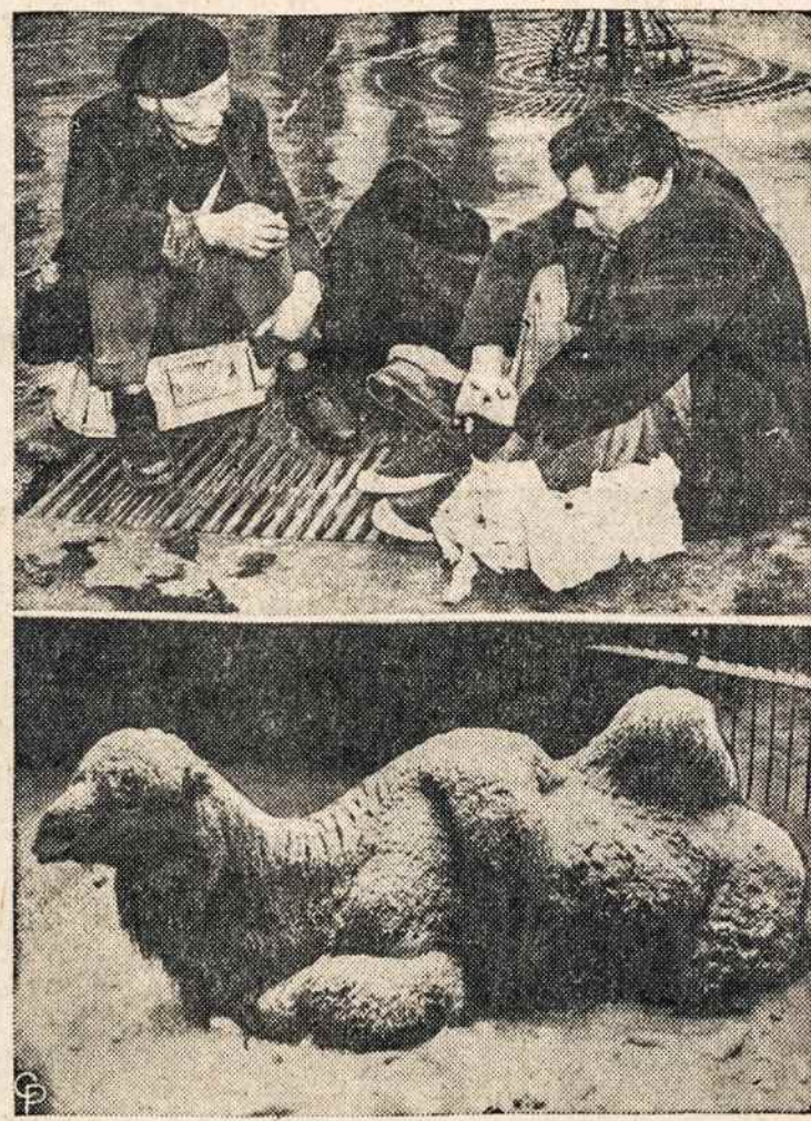
EUROPOJE spirgina šalčiai. Paryžiaus benamiiai šildosi gatvėje, o Londono zoologijos sodo kupriui nesalta ir ant sniego prigulti.