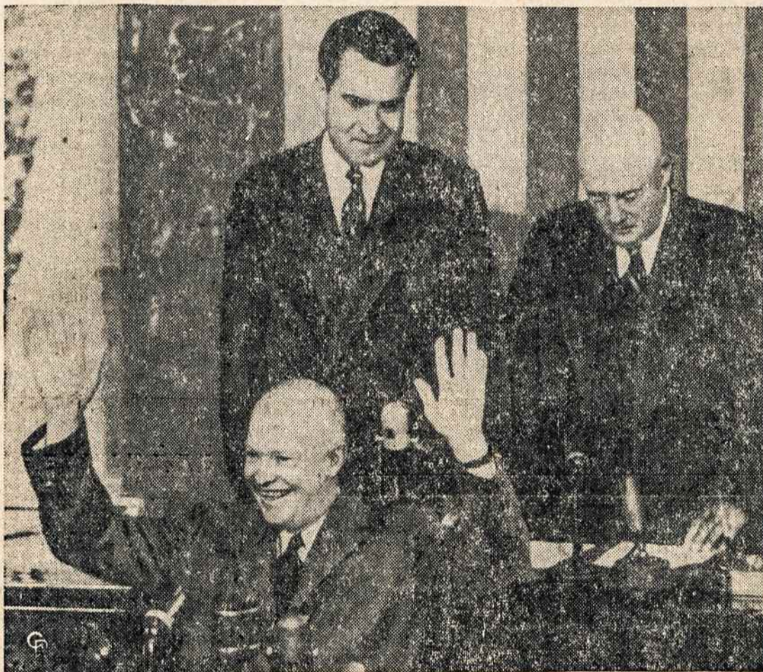
PREZ. D. EISENHOWERIS, atvykęs sakyti kalbos 84 Kongresui, sutinkamas su ovacijomis; už jo viceprez. R. Nixon (k.) ir S. Rayburn, Atstovų Rūmų pirmininkas.

Nelegaliai į Ameriką dar daugiau plūsta iš Meksikos. Imigrantijos įstaiga pranešė, kad 1954 buvo sulaukyti iš Meksikos 266,788 nelegalūs imigrantai.