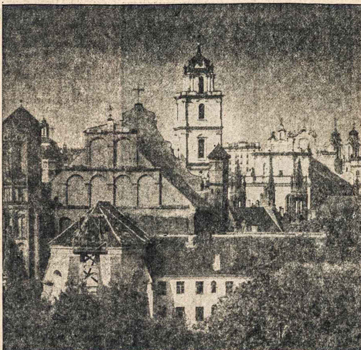
VILNIAUS BAZNYČIŲ BOKŠTAI

Lenkams atėjo sunkūs laikai. Bolševikai atsidūrė prie Varšuvos sienų. Visa buvo pastatyta ginti krašto gyvybei, į