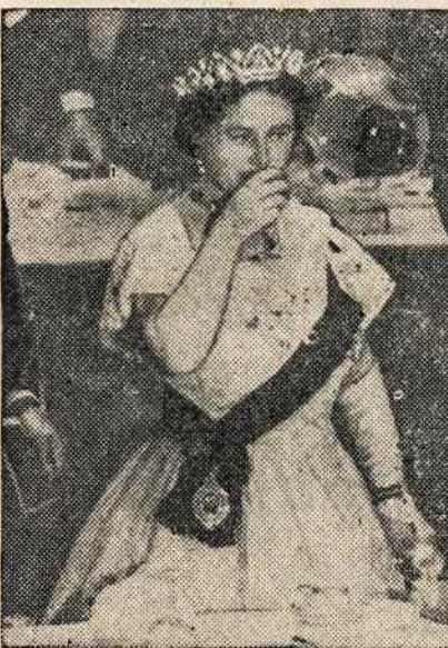
Karalienė Elzbieta kelia taurei prez. D. Eisenhowerio sveikata.

Eina namo martelės Namopailšę, Eikit, jaunos martelės, Šulnin vandenėlio.