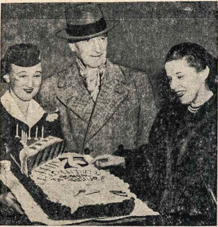
GEN. MacARTHUR atšventė 75 metų amžiaus sukaktį.