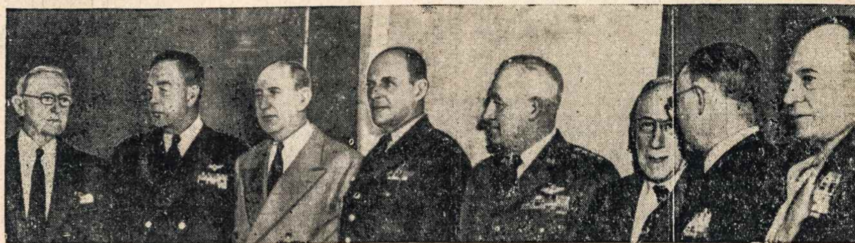
TOLIMUJŲ RYTŲ klausimu tarėsi Kongreso karo reikalavimų komisija su karo vadais. Iš k. į d.: Sen. W. George, adm. A. Radford, sen. R. Russell, gen. M. B. Ridgway, gen. N. Twining, sen. Th. Green, adm. R. B. Carney.

Londono sluoksniai, kurie tarpininkauja, gavę pranešimą iš Kinijos atstovo Londone, kad Kinija sutinka priimti paliaubas, jei jiem bus atiduotos Quemoy, Matsu ir Tachen salų grupė. Tą komunistam yra žadėję britai.