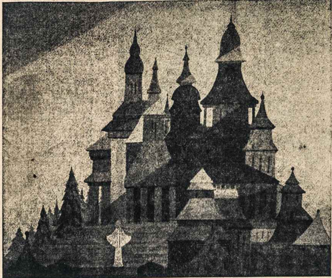
SENOVĖS Lietuvos pilis.