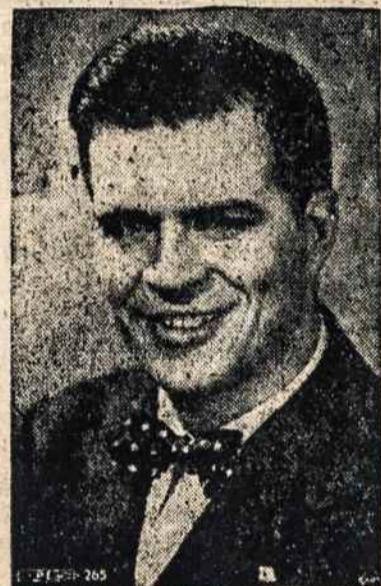
G. MENNEN WILLIAMS Michigan gubernatorius

Ta proga džiugu priminti lietuviams, kad gub. Williams yra nuoširdus lietuvių bičiulis, mokąs ir taisyklingai pasakyti: "Kas bus, kas nebus, bet lietuvis nepražus." Tai jis dažnai pasako lietuviams. Kartą pasigyrė, kad savo įstaigoje užtikęs lietuvi, primiršęs savo tėvų kalbą. Už tokį darbą gubernatorius jo nepagyres.