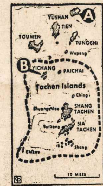
EVAKUOJAMOS Tachen salos. A ir B rodo komunistų jau užimtas.

Maskvos spauda kovoje prieš Vokietijos apginklavimą grasina trečiuoju karu, jei bus patvirtinta Paryžiaus sutartis. Esą atominiai pabūklai labiausiai sunaikins tirščiausiai gyvenamą Europą. Tai grasinimas Vokietijai, kad tik ji atmestų sutartį.