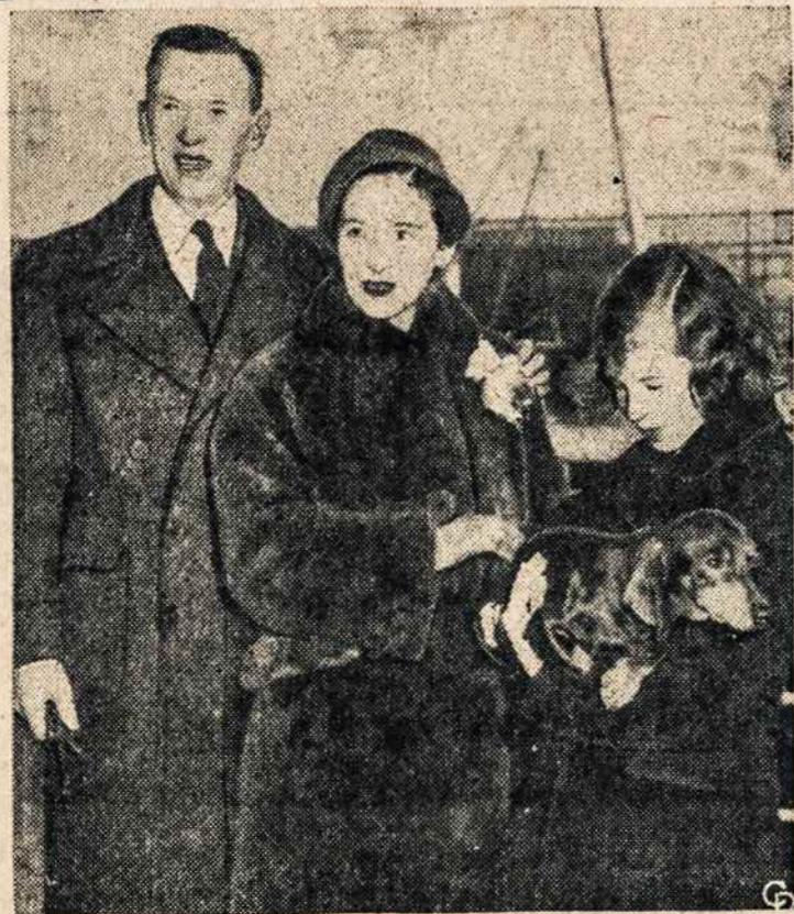
MAURICE COUVE de MURVILLE, naujas Prancūzijos ambasadorius JAV, su žmona ir dukterimi.

Pranašauja ir spauda — Amerikos džiaugsmui — kariuoti dėl Formozos nereikės; Kinijos komunistų džiaugsmui — gaus Amerikos garantijas, kad jos nepuls Chiang Kaishekas ir ji galės savo jėgas ramiausiai nukreipti vėl į Indokiniją; Korejos džiaugsmui — blogiau nebus, ji ir toliau liks padalyta.