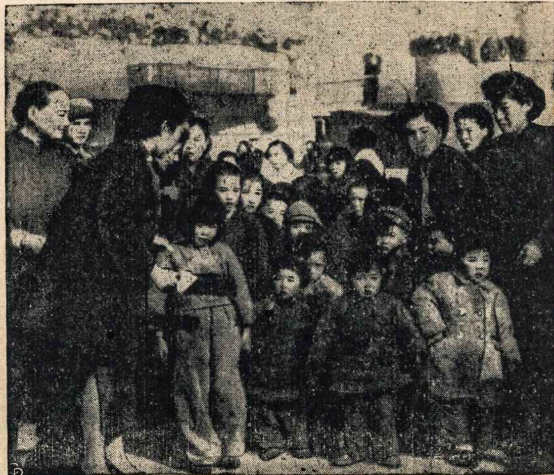
KINIECIŲ vaikų būrys, evakuotas iš Tachen salos.

"Tai nesvarbu, grįžusių ūkininkų taip pat neturime. Bet įsakymas turi būti įvykdytas."