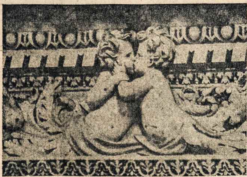
ANGELIUKAI šv. Petro ir šv. Povilo bažnyčioje Vilniuje, Antakalnyje.