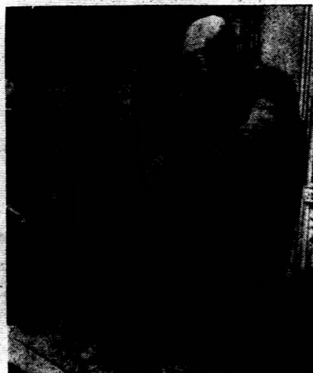
LONDONE, Gildos salėje, pastatytas W. Churchillui paminklas