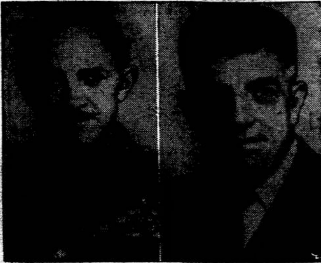
BRITANIJOSJE paskirti nauji kariuomenės vadai: gen. G. Temple generalinio štabo viršininku ir viceadmirolas J. Eccles laivyno vadu; jis taip pat bus viršininku Nato laivyno rytiniame Atlante.