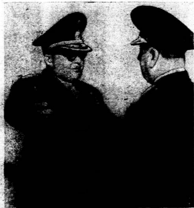
VENEZUELOS prezidentas Marcos Jimenez (k.) pirmą kartą buvo išvykęs i užsienį pas Peru prezidentą Manuel Odrį.

I politiką atėjo ne dėl to, kad jį būtų pamėgęs. Ne. Amerikiečiui korespondentui, paklausiusiam, kodėl iš advo- katų pasinėšė i politiką, atsa- kė: dėl to, kad anom 1945 me- ty dienom jį, amerikiečiai, tematėte padorius vokiečius tik socialdemokratų; norėjau pa-