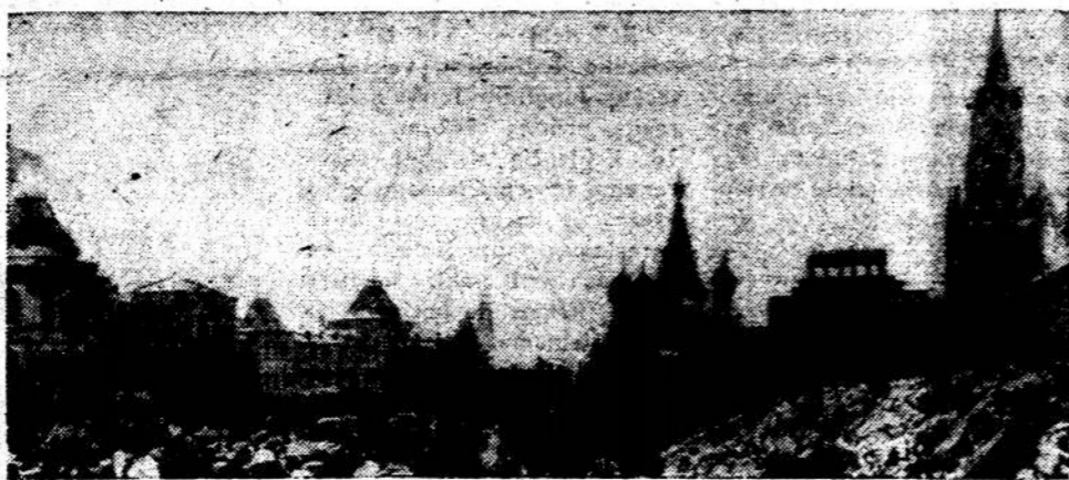
KREMLIUS — raudonojo voratinklės mazgas

— Prašau nesijuokti, gaspodi- n Raab! Aš esu įsitikinęs ko- munizmo gerumu, bet jei Jū- sų negaliu įtikinti, tai, Dievas su jumis, palikite, kuo esate.