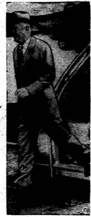
PREZ. D. EISENHOWERIS, pasakęs San Francisco mieste Jungtinių Tautom kalbą, grįžta į Washingtoną.

Pirmininkaujantis van Kleffens, olandas, iš savo sosto nutraukė kalbėtoją. Girdi, kritikuoti atskirų valstybių čia nevalia... Tylos momentas. Stal-