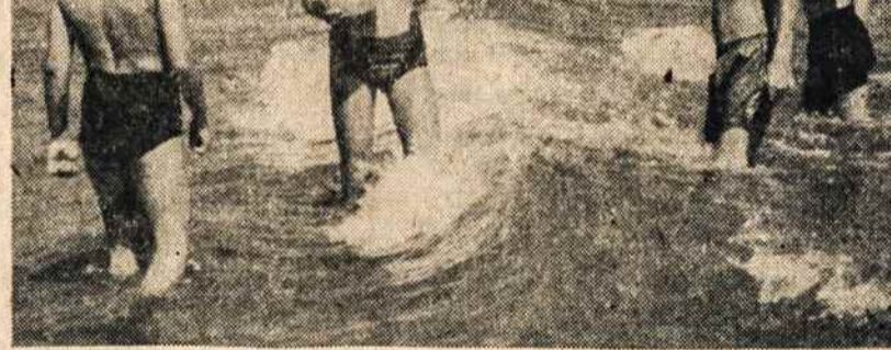
VAIKAI MAUDOSI Kennebunkporto pamaryje.