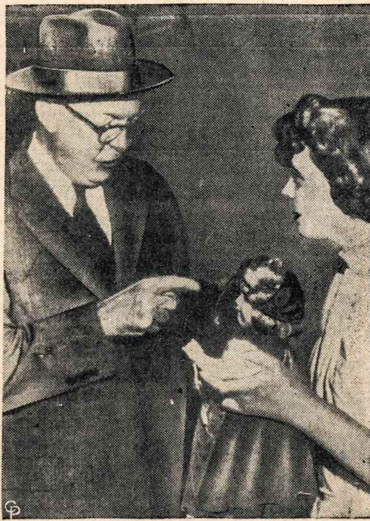
D. EISENHOWERIS ženevoje perka teltį savo vaikams.