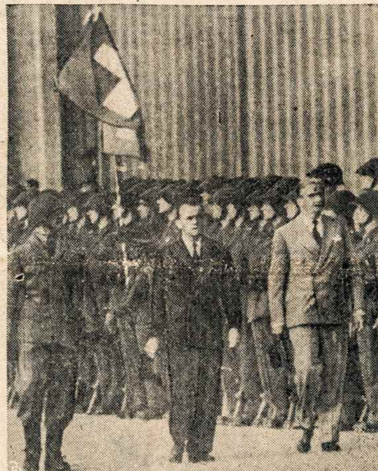
ANTHONY EDEN, Britanijos ministras pirmininkas, sutinkamas Ženevoje šveicarų garbės sargybos.

Bulganinas reikalavo paleisti Nato, svetimas kariuomenes iškraustyti iš Vokietijos, sudaryti naują saugumo organizaciją, kuri ginčijamus klausimus spręstų be karo. Toje organizacijoje turinčios dalyvauti 26 valstybės, tarp jų ir Amerika.