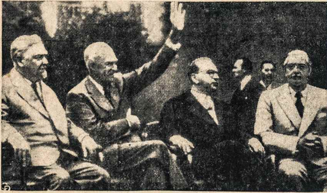
KETURI DIDIEJI pertraukos metu: Bulganinas, Eisenhoweris, Faure ir Edenas.

Darbas pradėjo sėkmingai: ryškėjo veidai, jų uždaviniai. Jis neturėjo jokio popieriaus. Kaip užrašyti, kad nepamirštum. Kažkur sašlavose rado trumputėlę grafito nuolauką, nuplėšė nuo sienos popieriaus gabaliuką ir susirašė. Paskui paslėpė sienos plyšyje. (Bus daugiau)