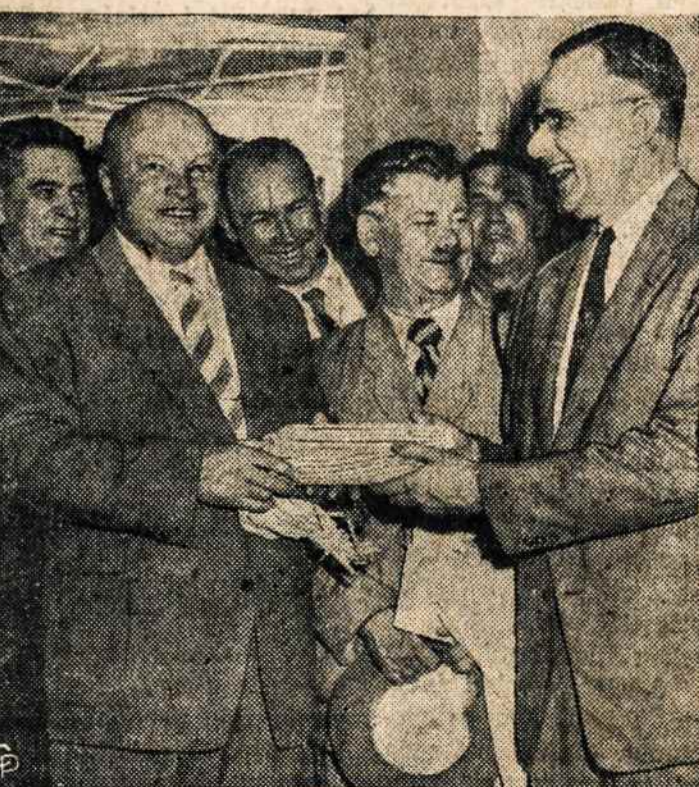
SOVIETŲ DELEGACIJA (12 žmonių) atvyko i JAV susipažinti, kaip amerikiečiai ūkininkai. Kažin, ar jie didžiai Amerikai papasakos, kaip savo kolchozais sugrivo Lietuvos, pačių bolševikų vadinamas "Mažosios Amerikos" ūki.

BANGA 340 RIDGEWOOD AVE. BROOKLYN, N. Y. Garantuotai taisoma televizija, kambariniai bei auto radio, stiprintuvai (amplifiers), plokštelių automatai (record changers). Aptarnaujami rajonai: Brooklyn, Maspeth, Woodhaven, Richmond Hill, Ozone Park, Forest Hill, Jamaica. Darbas atliekamas prityrusio techniko, pripažinto RCA Instituto, New Yorke. Darbo valandos: kasdien nuo 9 val. ryto iki 8 val. vak. pirmadieniais nuo 9 val. ryto iki 6 val. vak.