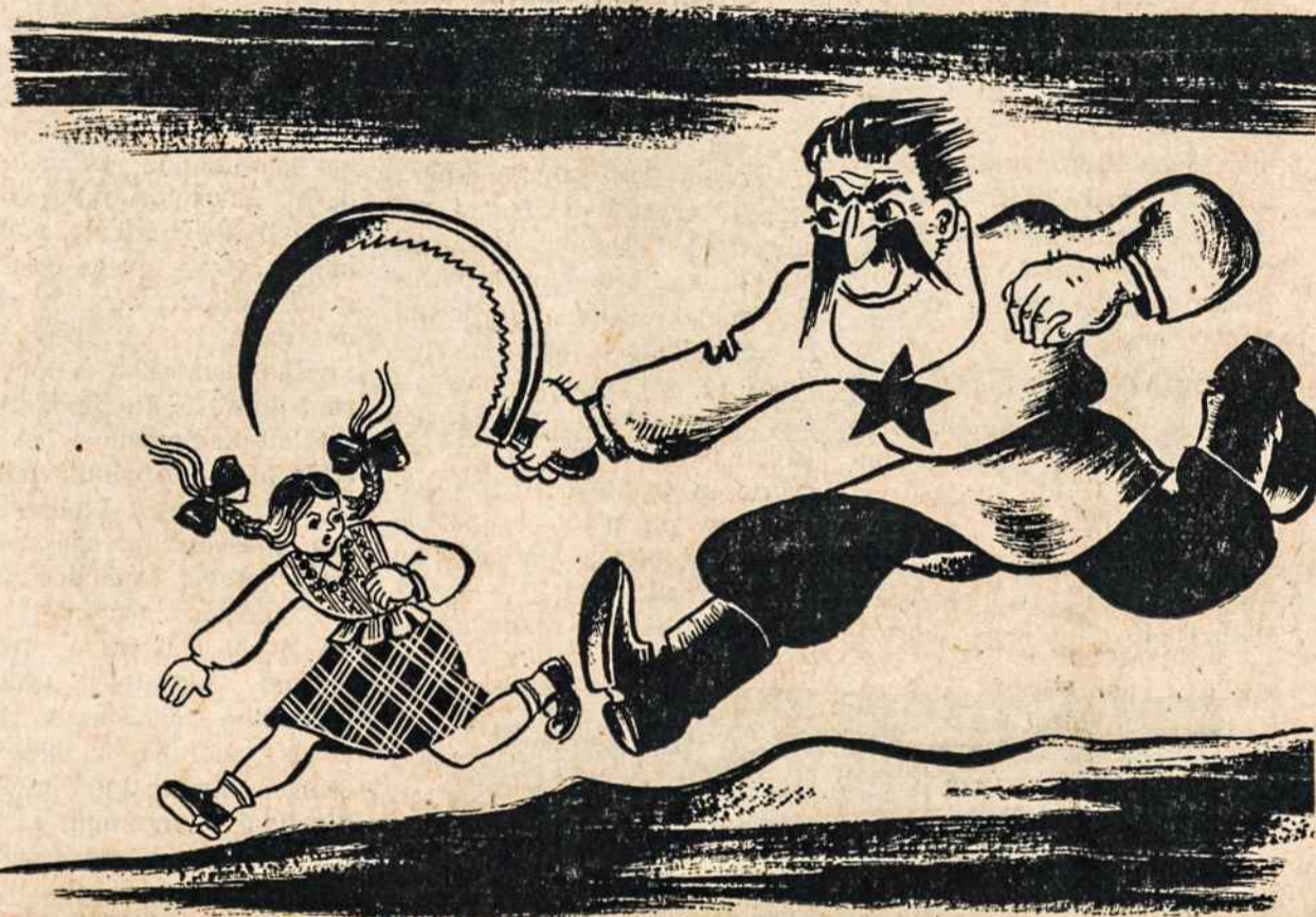
"LIETUVOS KELIAS IS VERGLIOS I SOCIALIZMĄ" — tokia antraštė buvo uždėta J. Paleckio kalbai liaudies seime (Darbo Lietuva, nr. 11, 1940 5. 22).

Liepos 21 buvo sekmadienis. Su lietu. Susirinkusieji i teatrą farso režisieriai nervinosi, kad neturi dar savo rankose deklaracijų teksto. Jis nebūvo gautas iš Maskvos. Atsiduso tik tada, kai pasivėlinęs dėl blogo oro lėktuvas raštus nors ir pavėlintai pristatė i teatrą... Tada ėjo viskas greitai. Po 1 val. ir 3 minučių jau buvo