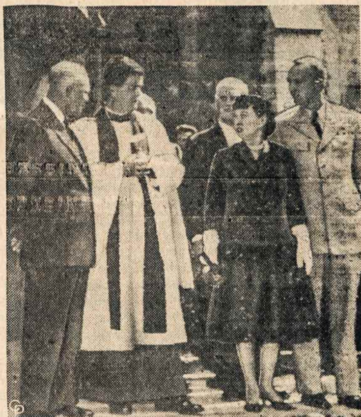
D. EISENHOWERIS po pamaldų Ženevos bažnyčioje.