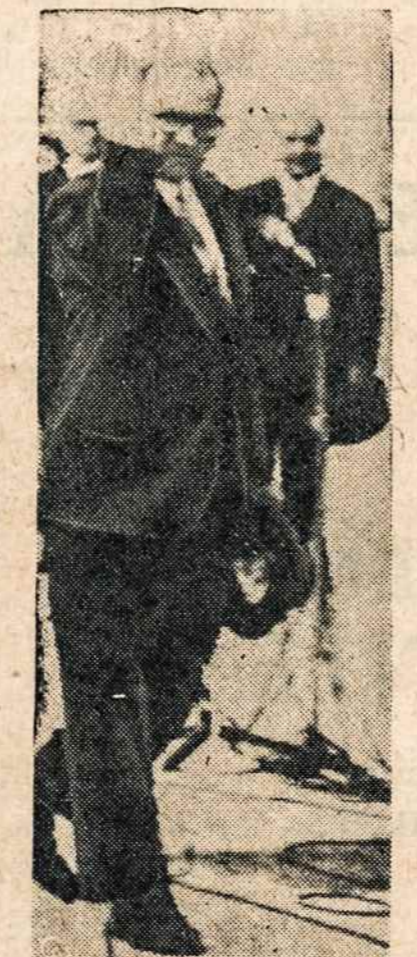
EDGAR FAURE, Prancūzijos prezidentas Ženevoje.

Tarp Eisenhowerio ir Bulganino „didžiųjų programų“ veik nėra bendrų punktų, kurie priverstų prie susitarimo. Antrą dieną iš jų sutarta tik prie keturių.