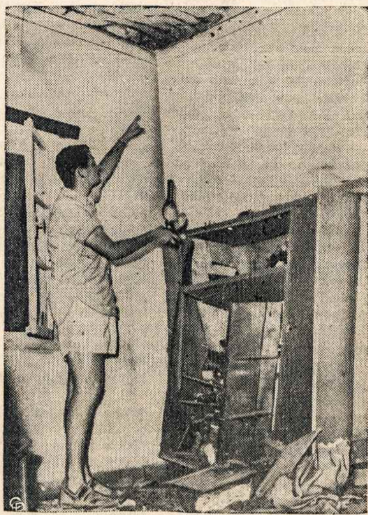
IZRAELIO PILIETIS rodo, kur jo namas nukentėjo nuo egiptiečių sūvių.

Susilaikant nuo perdėtų vilčių paskaičius informaciją apie užfrontės kovotojus, tenka betgi pasidžiaugti, kad toji informacija yra vienas iš ženklų, jog Amerikoje stiprėja ištikinimas, kad su Maskva galima tiek susikalbėti, kiek visi siūlymai bus pagrįsti realia ginklo jėga.