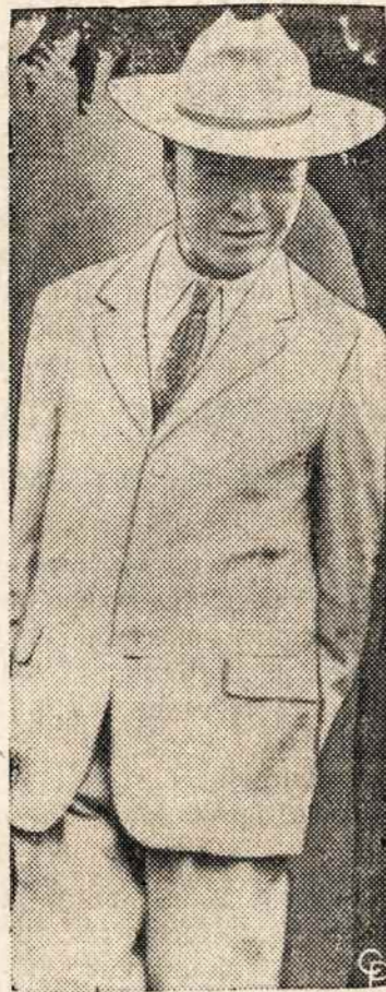
SYNGMAN RHEE, pietų Korėjos prezidentas, irgi gavo iš Texas kovbojaus kepture.

In sought-after location, 5 rms., tiled bath, center hall, flagstone terrace; exp. 2nd. Full basement. Lovely landscaped plot. Delightful home. Perfect for small family. In catholic community. Asking $26,500. Must be seen to be appreciated. Owner moving. Call weekend eves, WH 8-0822.