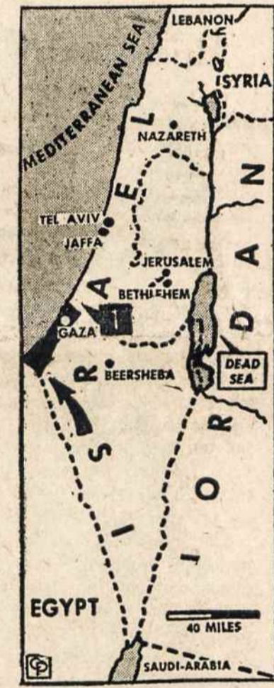
GAZA, prie kurios nuolat eina egiptiečių ir Izraelio kautynės.

● Potvynių nuostoliai galutiniais duomenimis skaičiuojami iki 1,600,000,000 dol.