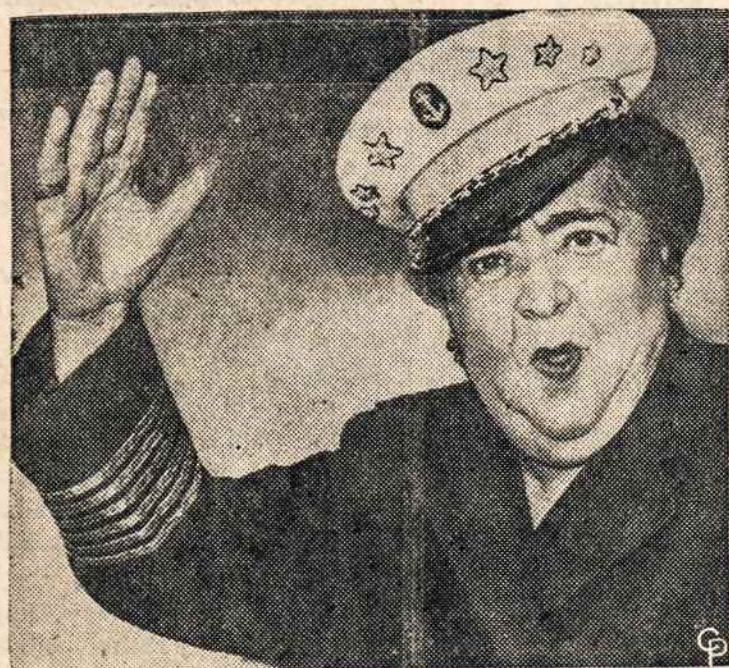
SIANDIEN JI JORININKAS, rytoj rengs įžymių žmonių "party" ir graikų vaikams dalyvaujančius ir vaistus. Tai Elsa Maxwell, kuri dabar keliauja iš Venecijos į Graikiją.