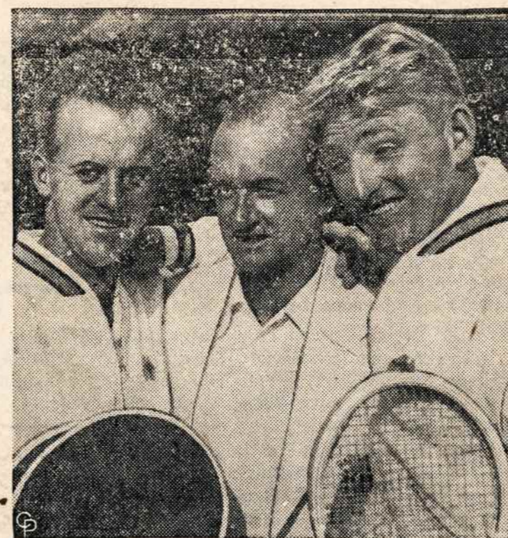
AUSTRALIJA LAIMEJO Davis taurę už tenisą. Čia nugalėtojai Rex Hartwig (kairėje) ir Lewis Hoar (dešinėje) su komandos kapitonu Harrys Hopman, kuris nežaidė.

mys kas metai per atostogas nuperska nemazą lietuviškų ir angliškų knygų, kuriose rašoma apie Lietuvą, už 50 dol. Knygas sugrįžęs įteiks universiteto bibliotekai. Ir šiemet jis iš "Laimos" knygyno