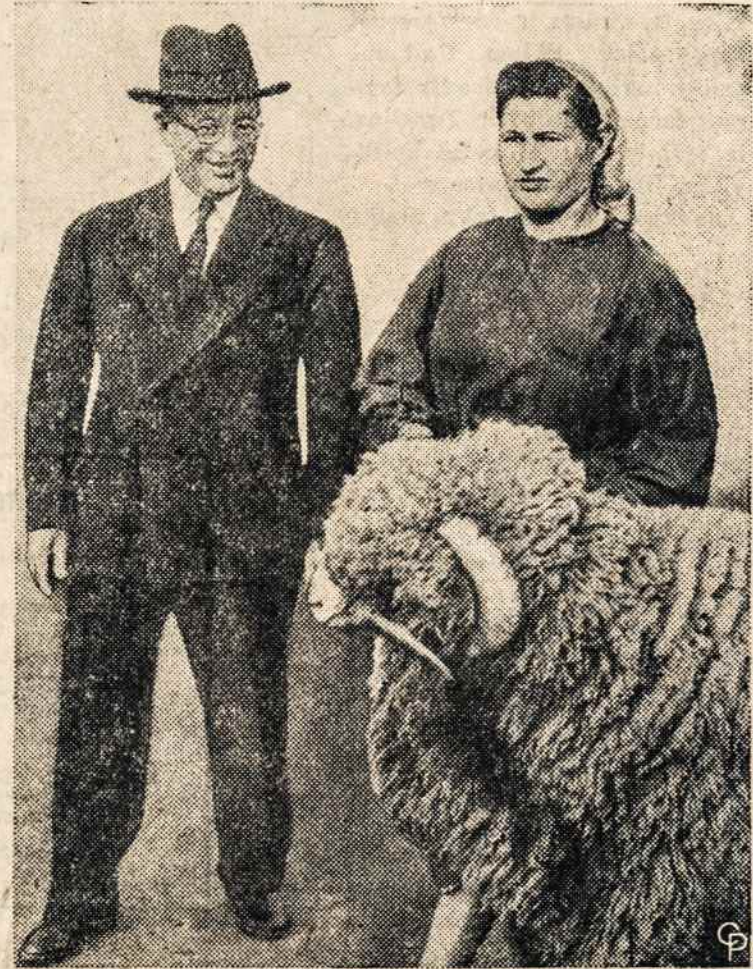
SEN. ALLEN ELLENDER (D-La) apžiūri "baroną" rusų žemės ūkio parodoj Maskvoje.

"Tu esi šmugelinkas, spekuliuoji amerikoniškom cigaretėm".