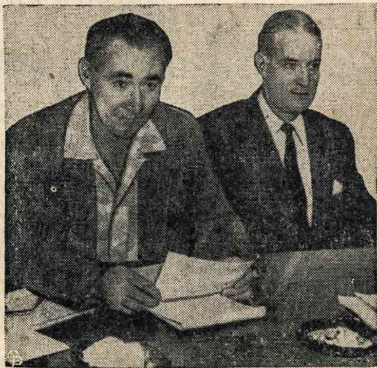
CIO UNIOS ir Chrysler korp. atstovai pasirašė trijų metų kontraktą, baigdami trumpai trukusį streiką.

Valstybės departamentas raštu pareikalavo iš kom. Vengrijos atstovybės Washingtone, kad ji sustabdytų visokią informaciją. Sykiu pažymėjo, kad tai represija prieš visokių kliudymus ir užgauliojimus, kuriuos patiria Amerikos atstovybės tarnautojai Budapešte.