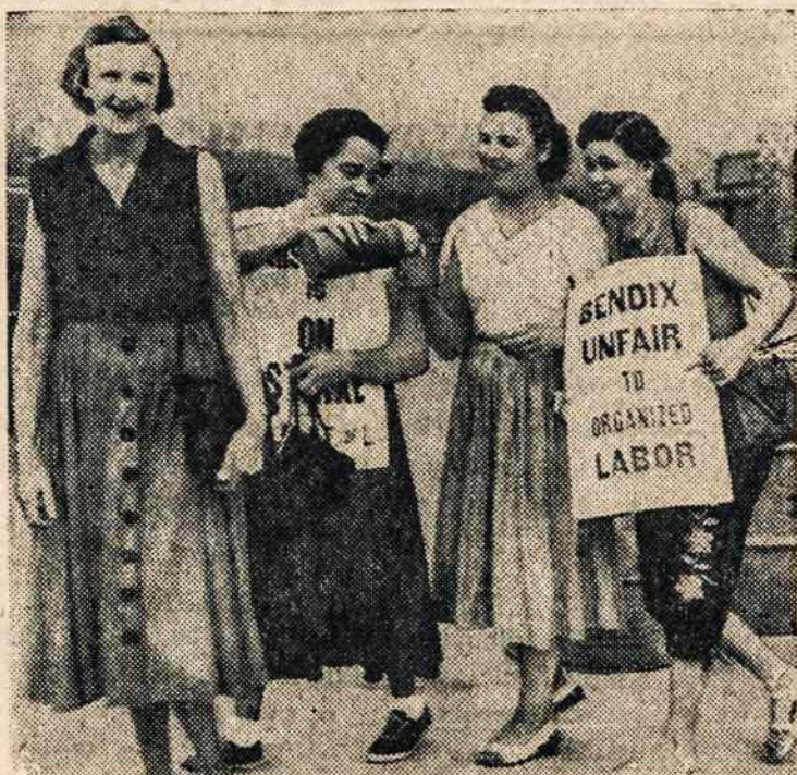
BALTIMORĖJE susitikavo Bendix radijo darbininkai, nesutardami dėl atlyginimo. Piketotojai prie fabriko geria kavą.