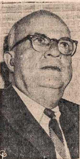
PRAMONININKAS HENRY J. KAISER, kai Hawajuose parvirstęs vonioje susižėdė, tai prie trijų gydytojų Hawajuose jo gėlbėti išskrido dar kiti trys iš Californijos.

Specialus PJT pranešimas Centro ir Rytų Europos tremtiniams informuoja apie įsigaliojimą 1954 m. pasirašytos Ženevos Tarptautinės Konvencijos. Ją tada pasirašė: Australija, Austrija, Belgija, Brazilija, Danija, Didžioji Britanija, Egiptas, Graikija, Irakas, Italija, Izraelis, Jungtinės Amerikos Valstybės, Jugoslavija, Kanada, Kolumbija, Lichtenšteinas, Liuksemburgas, Monako, Norvegija, Olandija, Prancūzija, Švedija, Šveicarija, Turkija, Vakarų Vokietija. Iki 1955 m. spalio 25 d. konvencija jau buvo ratifikavusios Australija, Austrija, Belgija, Danija, Didžioji Britanija, Ekvadoras, Italija, Izraelis, Liuksemburgas, Monako, Norvegija, Prancūzija, Švedija, Šveicarija, V. Vokietija.