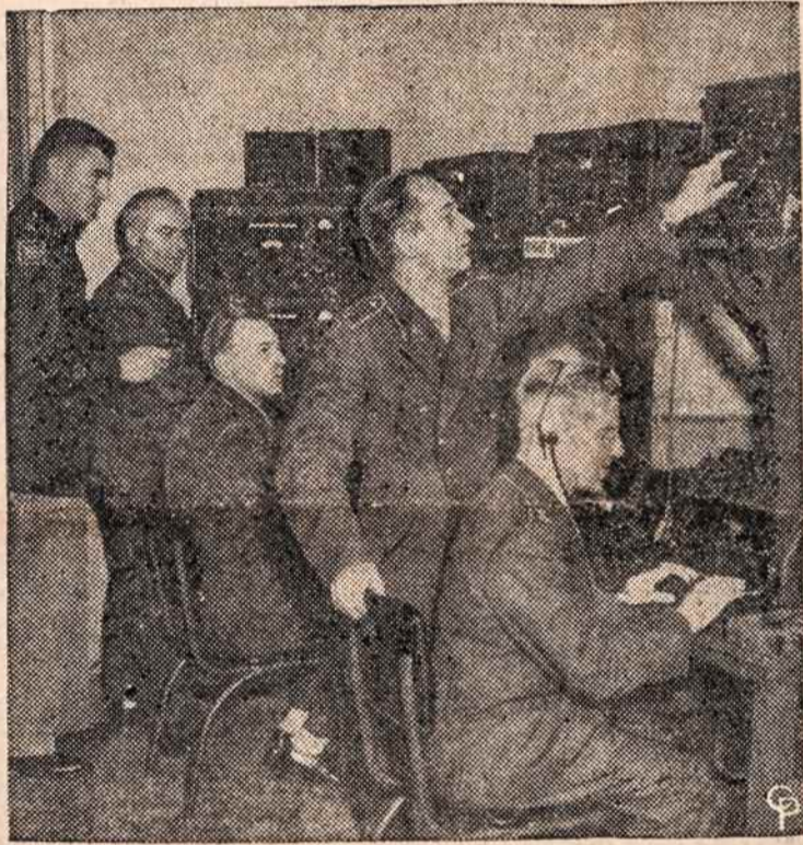
VOKIETIJOS KARIUOMENĖS karių grupė atvyko į Ameriką, kur juos ruoš Amerikos specialistai. Čia dalis jų treniruojausi prie radijo ir telefoto.

Amerika pareikalavo, kad Maskva sumokėtų 724,947 dol. už lėktuvą, kurį Sovietai nušovė pernai birželio 23 Beringo jūroje. Tada Molotovas atsiprašė ir pažadėjo pusę išlaidų sumokėti. Amerika su tuo sutiko ir dabar pristatė sąskaitą.