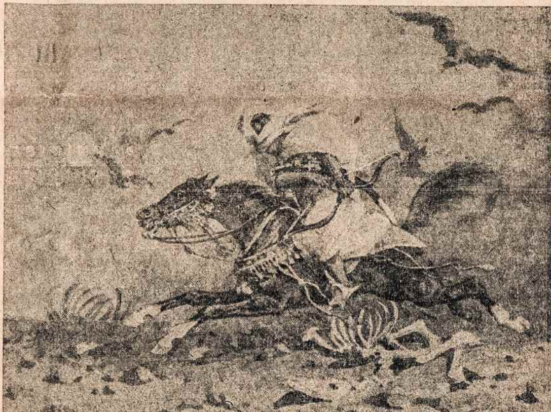
STEPIŲ RAITELIS — iliustracija prie Adomo Mickevičiaus baladės Farys.

dybą, tačiau jam staiga melsvai švysterėjo akyse ir tuo pačiu metu ausis apkurtino pasibaisėtiną trenksmas, suvirpinęs trobos sienas ir privertęs sučerkėti langų stiklus. Dėdė Jeronimas skubiai užtrenkė duris ir šoko virtuvėn, kur jį pasitiko iš išgaščio išplėstos namiškių akys. Dėdė Jeronimas tebuvo pats debesio pakraštys, drumzlinas ir verdas, tarsi nuo kaskart arčiau ir dažniau poškandios perkūnijos, kuri galiausiai ėmė kartotis beveik be perstojo visose pusėse. Kieme vėjas šiūsterėjo dėdėi Jeronimui į veidą smėliu, kita ranka nuo galvos nuvogdamas skrybėlę. Akimirka sukosi toks verpetas, kad viskas rūko, net nebuvo matyti stogų per tirštas dulkes. Paskui jos pakilo stulpu pro medžių viršūnes, ir dėdė Jeronimas, stovėdamas ant slenkščio, savo skrybėlę išvydo sklendantį aukštai rudame debesyje. Gluosnį ties stogais, sulinkę pavėjui, atrodė nežali, o balti, nes lapai buvo atvirtę savo pakuotomis pusėmis, dar labiau ryškiniami juodos padangės. Dėdė Jeronimas gal būtų priemenioje išstovėjęs ilgęsnį laiką, džiaugdamasis vėsumu ir žiūrėdamas į savo pasikeitusią, nerimastujančią so-