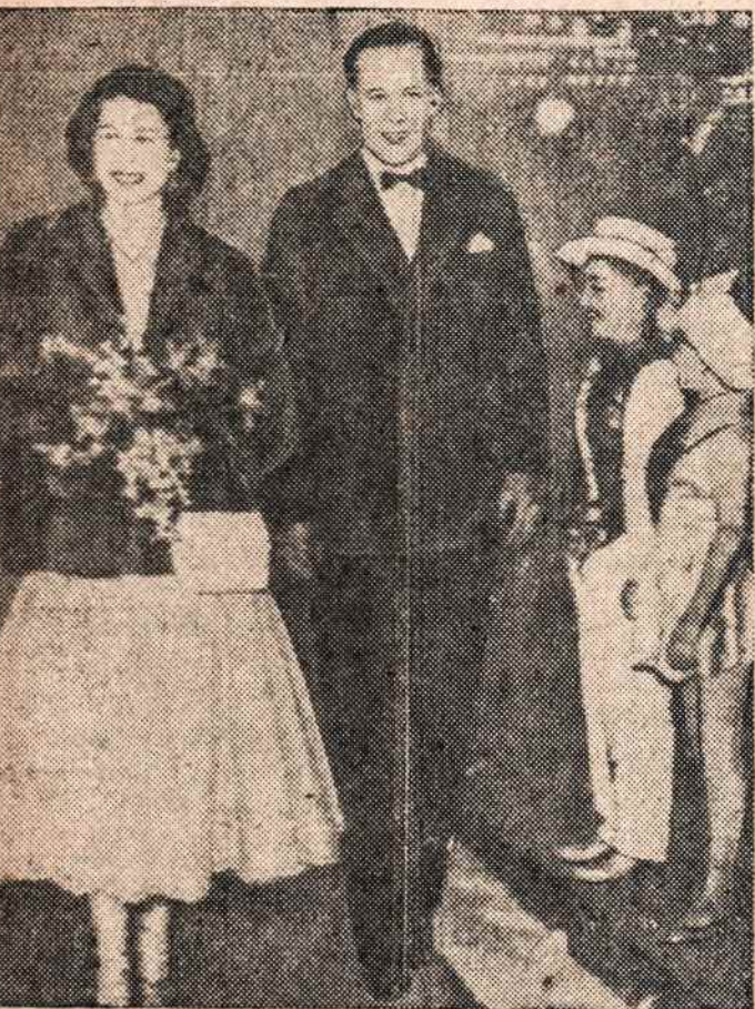
KARALIENĖ ELZBIETA II mėgsta ir cirka, ateina i ji Londone, lydimu cirko direktoriaus.