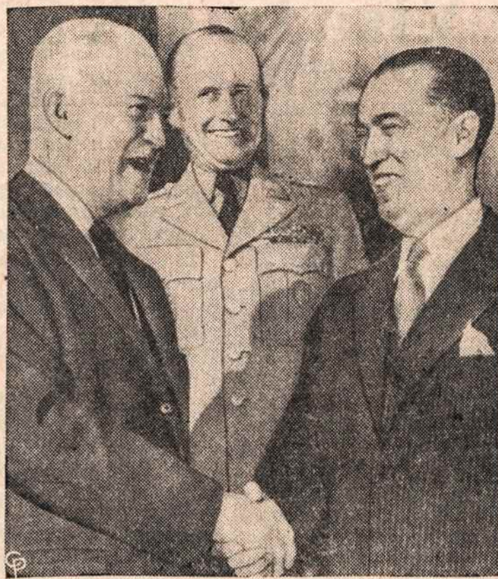
BRAZILIJOS PREZIDENTAS Juscelino Kubitschek atvyko pas prez. Eisenhowerį; vidury gen. A. Gruenther, Nato kariuomenės vadas Europoje.

Prieš pat šventes The Book of the Month Club išleido jo pieštą spalvotą kalėdinį atviruką.