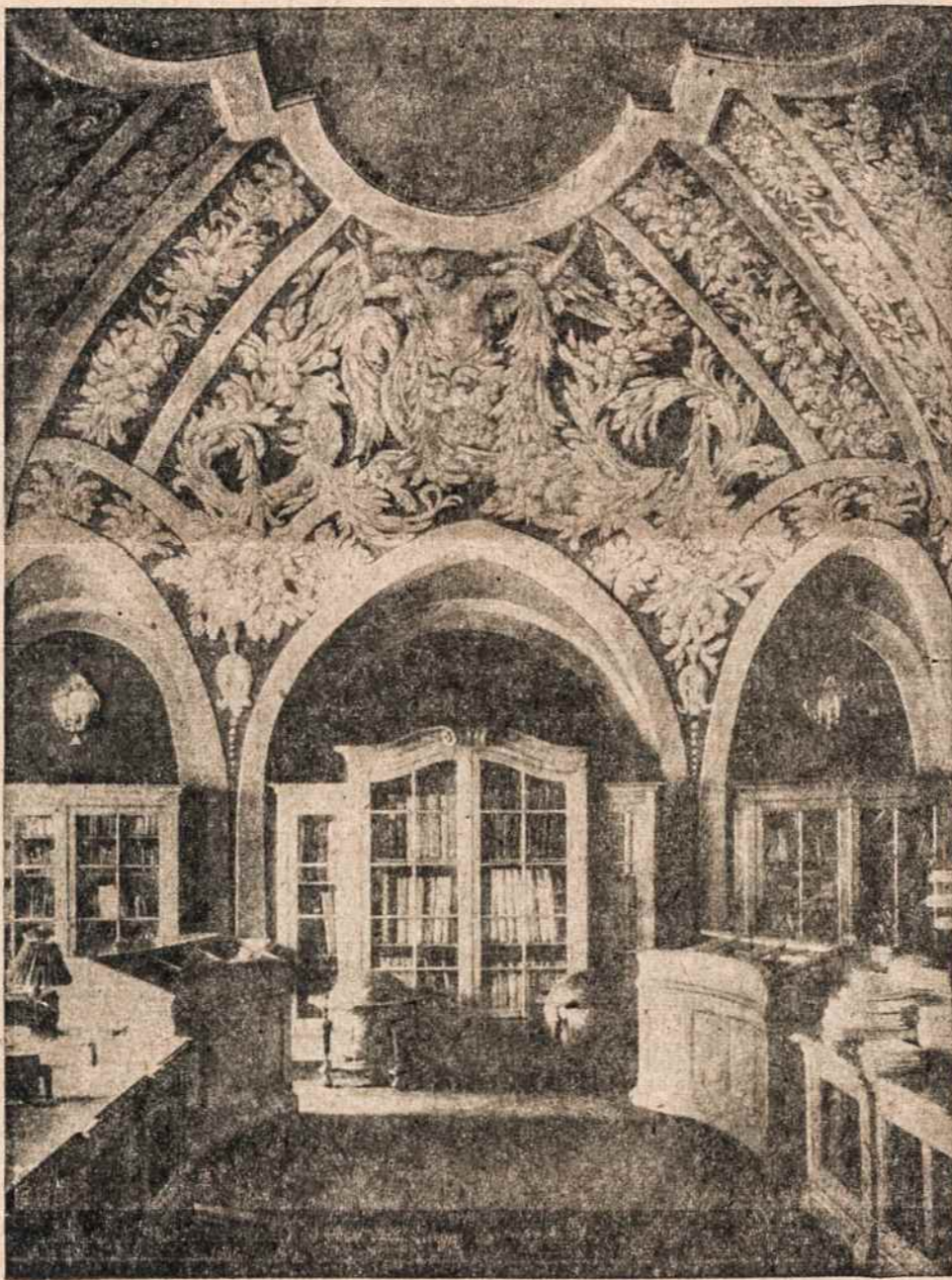
LELEVELIO SALĖ Vilniaus universitete