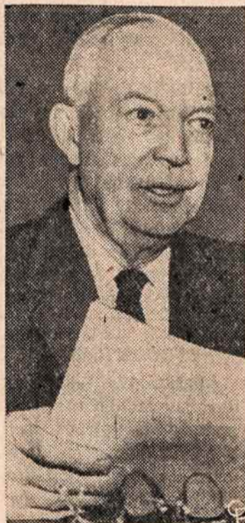
PREZIDENTAS EISENHOWERIS sausio 5 skaitė savo programą artimiausiu metu.

Be dovanų iš Lietuvos toli nenuvažiuosi. "Tiesa" prisipažįsta, kad kiekvieną savaitę iš Lietuvos net vyriausybės globojamiems "Plėšiniams" Sibire išsiunčiama daugybė pakietų su dovanom.