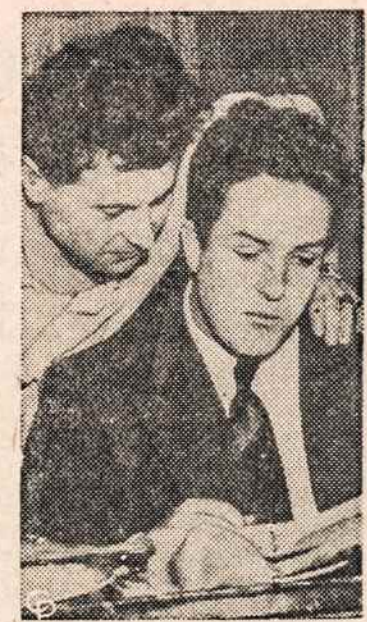
FRANCCZIOS PARLAMEN- TO ATSTOVAS, bet dar moki- nys — dienos "didvyris" Pau- jade, kuris iš užpakalio moko naująjį parlamentarą.