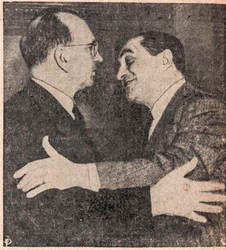
BETRŪKSTA TIK PASIBŪCIUOTI. Taip atrodo du didžiausi priešinkai rinkimuose: Faure ir Mendes-France.

Dėl raudonosios Kinijos grasinimo nutraukti derybas Ženevoje valstybės departamentas paaiškino, kad jis ir toliau pasiryžęs derėtis. Jis noris išgauti dar likusius 13 amerikiečių. Komunistai grąžino tik 28. Kol nebus grąžinti visi, amerikiečiai nusistatė nesileisti į derybas politiniais reikalais. Ir tik tada bus sutikta, kad valstybės sekretorius susi-