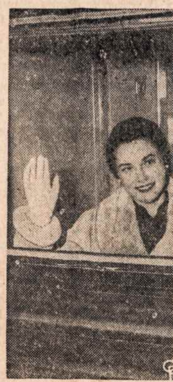
PIRMA DARBAS, PASKUI VEDYBOS... nusprendė Grace Kelly ir išvyksta į Hollywoodą, kur sulka su ja naują filmą.

Tremtinių imigracijos programa, pagal kurią turėjo būti įleista į Ameriką 214,000 tremtinių, iki šių metų galo nebus įvykdyta. Vizų tebus išduota daugybe daugiausia 165,000. Manoma, kad Kongresas terminą pratęs.