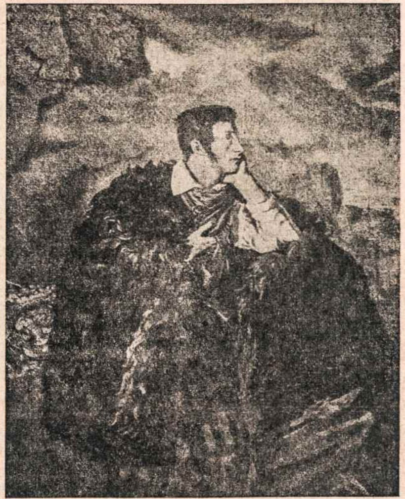
ADOMAS MICKEVIČIUS Kryme