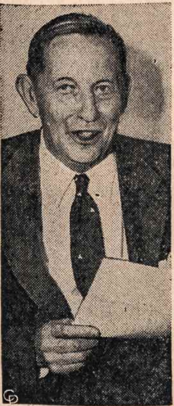
LOUIS BROMFIELD spaudos atstovam New Yorke pareiškė, kad jo žiniomis Maskva parūpinusi Egiptui apie 3000 komunistų techniku mokytis varuoti modernius ginklus, kuriuos sovietai pristato.

● Prez. Eisenhowerio sveikatą patikrinusi gydytojų komisija rado, kad ji nekluduoja prezidento pareigų eiti dar 5—10 metų. Prezidentas pareiškė, kad jis apsisprendė ne tiek pagal gydytojų nurodymus, kiek pagal savo paties savijautą.