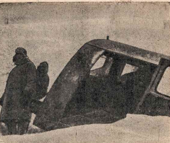
ADLAI E. STEVENSON, demokratu kandidatas į prezidentus, vos išvengė katastrofos lankydamasis Oregono valstybėje.

Sovietų šypsniak — sakė senatorius — nerodo jų politiko pakitimo. Naujos tarpusavio pagalbos sutartys Rusijai nieko nereikią, kaip rodo jos sutartys su Suomija, Lenkija, Estija, Latvija ir Lietuva.