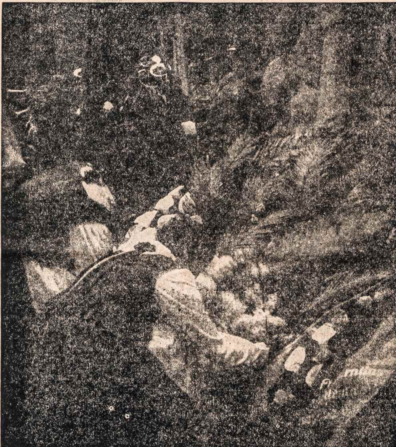
NEŽINOMOJO KAREIVIO kapa puošia gėlėmis Vasario 16 Lietuvos laisvės metais.

Vasario 16 švenčiant mums reikia greit išidėmėti du dalykus: viena, lietuviai turi būti uolūs laisvės gerbėjai ir gynėjai tiek savo, tiek ir kitų tarpe; antra, mūsų darbai turi būti nukreipti ne tik į kovą su komunizmu, bet ir su lietuvių tautos rusinimu. Abu pavojai yra vienodai grąsūs, bet antrasis tarsi išleidžiamas iš akių.