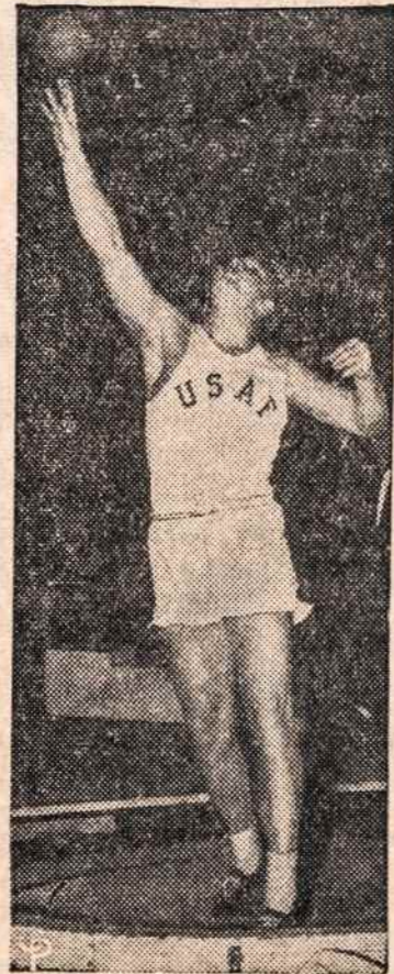
LT. PARRY O'BRIEN New Yorko Atletų Klube pasiekė naują rekordą. Jis 16 svaru rutulį nusivėdė 59 pėdas ir 9 inčias.