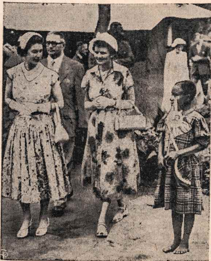
ELZBIETA II, Anglijos karalienė, lankydamosi Nigerijoje, Afrikoje, „adoptavo“ bąsą 10 metų neigriuke.