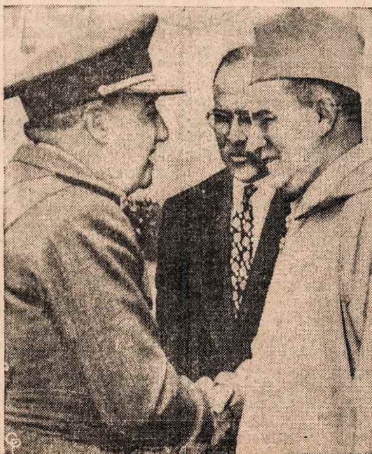
ISPANIOS FRANCO (kairėj) su Maroko sultonu Ben Youssef susitarė dėl ispaniškojo Maroko nepriklausomybės.

238 Leonard Street Evergreen 7-8247. Brooklyn 11, N. Y.