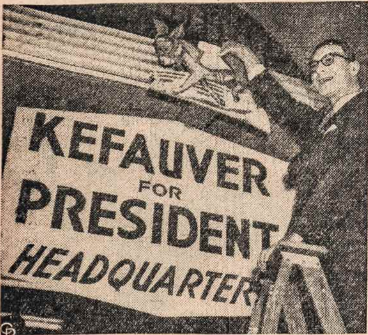
SEN. ESTES KEFAUVER prie savo rinkiminės būstinės Washingtone.