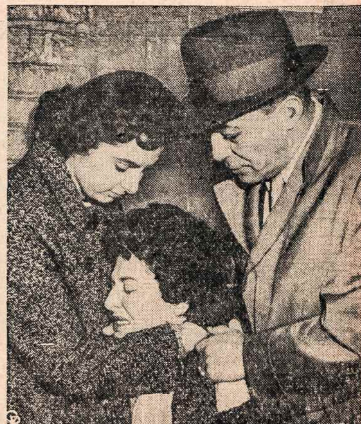
MACY sreikuojančios krautuvės sužeista piketininkė raminama savo draugu.

Alžiro sukėlėlai antradienį įsiviliėjo du sunkvežimiu prancūzų naujoku ir trijų valandų kautynėse 20 ju nušovė. 30 sužeidė. Žuvo ir sukilėliu daug, apie 120, kada i pagalbą atvyko daugiau prancūzų helikopteriais. Pašauti i 6 helikopteriai.