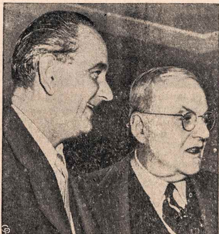
JOHN F. DULLES, Valstybės sekretorius, ir sen. L. Johnson po pasitarimų Artimųjų Rytų politikos klausimais.