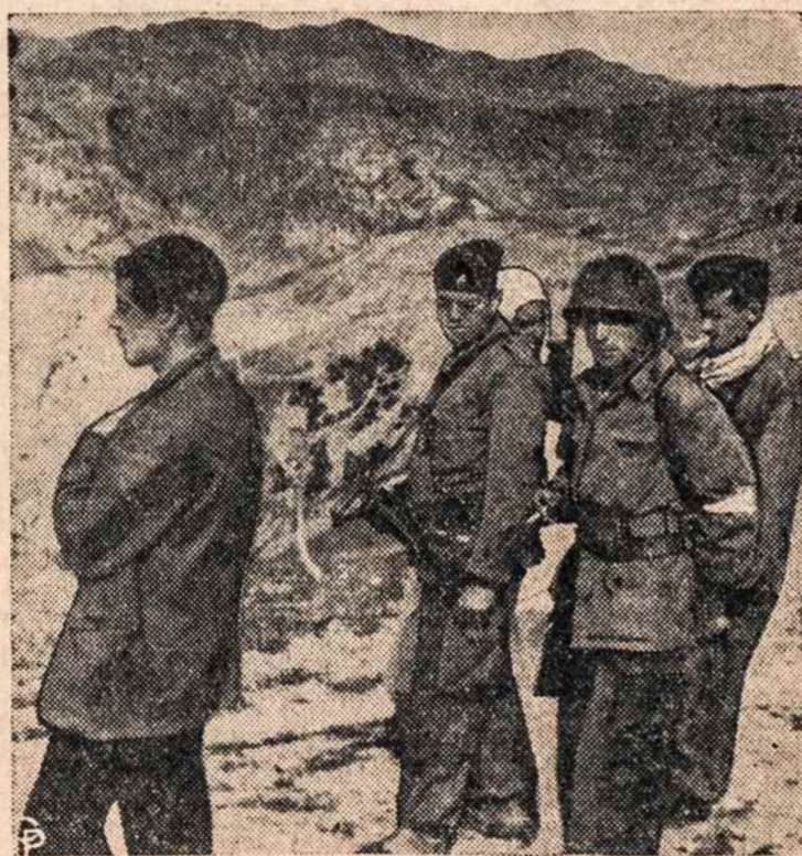
ALZIRE prancūzų sargybos suiminėja kalnuose visus įtartuosius.

★ Popiežius Pijus XII ragino ūkininkus pasipriešinti komunistumui Italijoje artimuose rinkimuose. Italijoje komunistai laimėdavo beveik trečdali visų balsų.