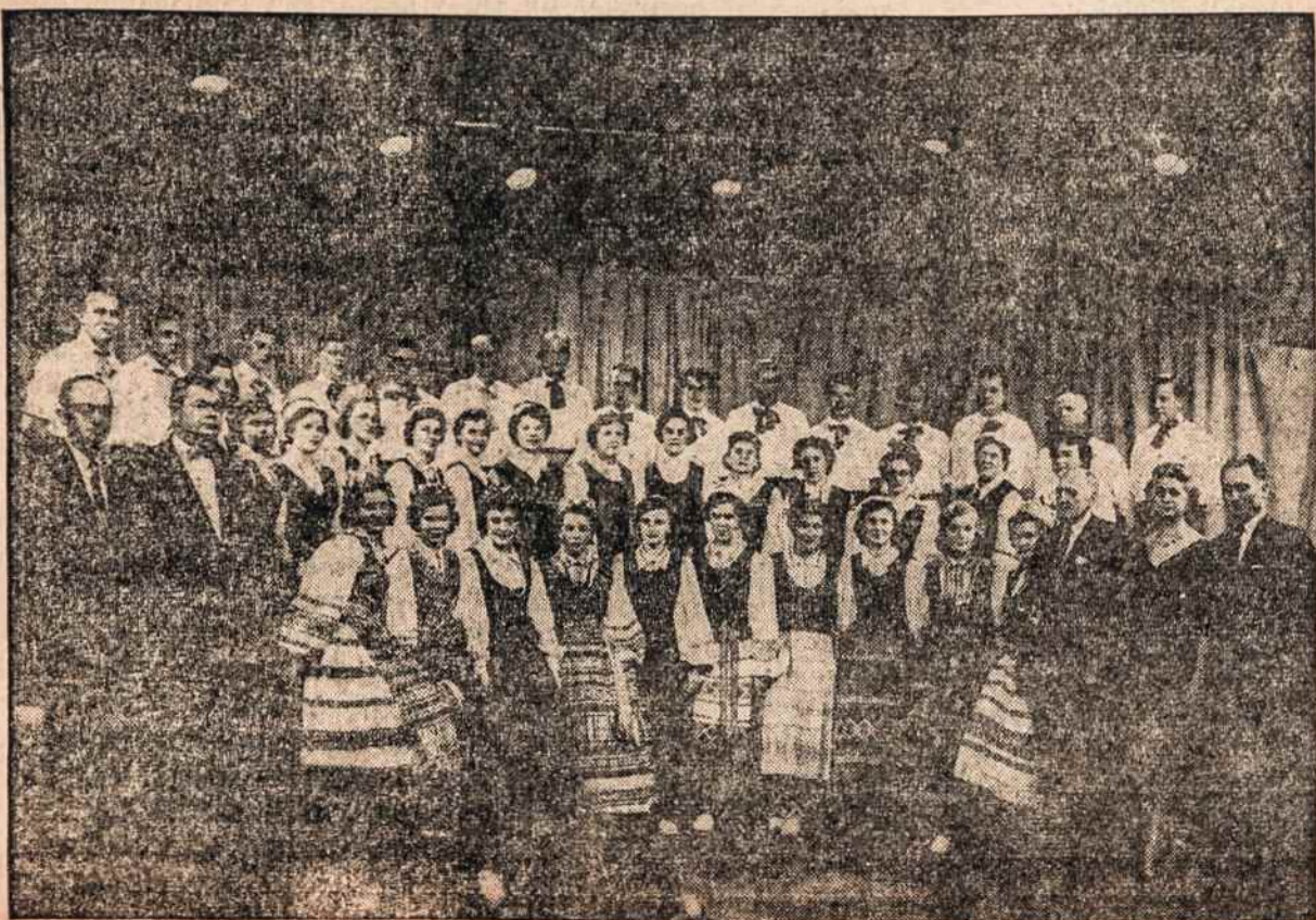
"RĖTOS" ANSAMBLIS dainuos J. Stulko radijo valandos koncerte New Yorke balandžio 22.

Ateitininkų Federacijos val-dyba tikisi, kad i šį Romos ateitininkų prašymą bus atsi-liepta. Aukas prašoma siųsti per Ateitininkų Federacijos valdybą Brooklyne pažymint, jog tai skiriama Europos ateiti-ninkų ideologiniam kursam pa-remti. At-ky Fed. Valdyba.