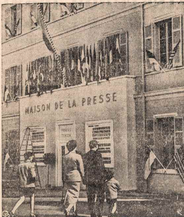
SPAUDOS BIURAS Monake apgultas žurnalistų, suvažiavusių sekti artistės Grace Kelly ir prince Rainier vedybu.