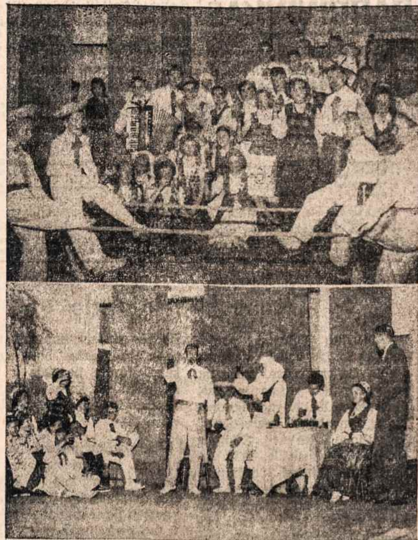
SAN PAULO ateitininkai vaidina „Sekminių vainiką“.