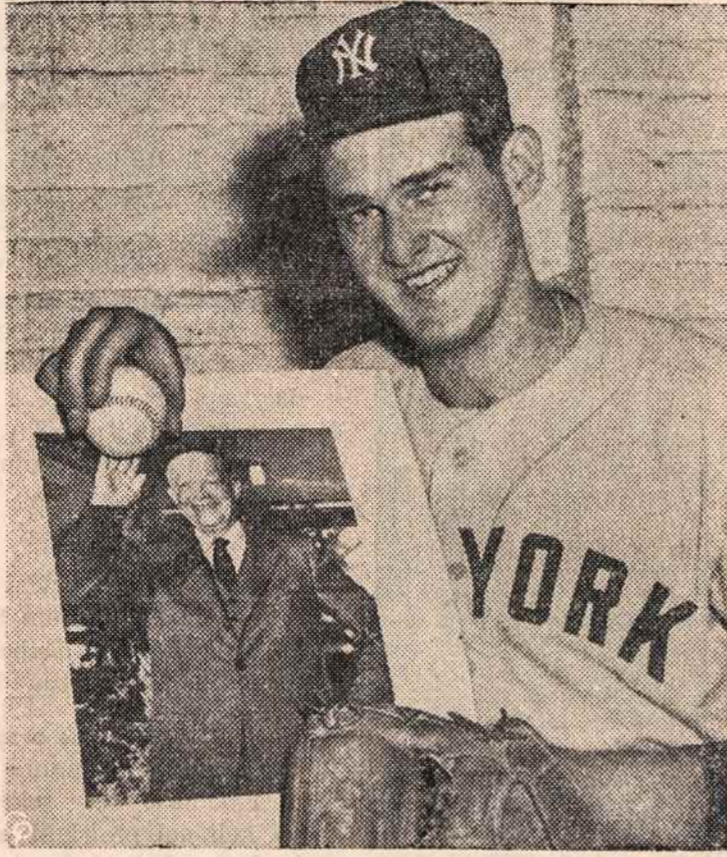
DON LARSEN, Yankee komandos pitcheris, pradėjo beisbolo sezoną Washington, žaidžiamas su senatoriais.