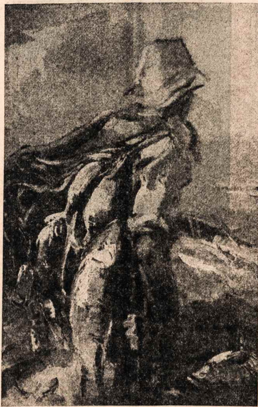
ZVEJAS. Iš kovo mėn. “Aidu”. Dail. J. Puzinas

Visi Toronto lietuviai parodė nuoširdų lietuvišką vaišingumą svečiams, ir jie išsivežė gražius išpūdžius apie šią gražią lietuvių koloniją. Taip pat ir pats vakaras — koncertas Torontui paliko gražios šventės išpūdžius. A. K.