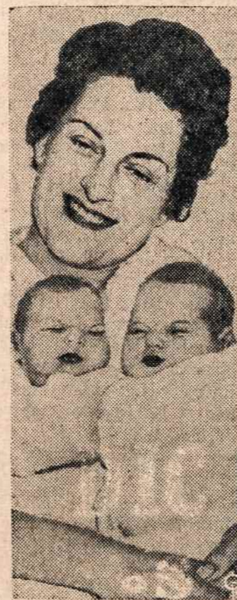
SUNKIAUSI dvynukai Memorial Hospital Glendale, Calif. Abu svėrė po 8 svarus.

Redakcijai iš Philadelphiajos pastebėta, kad Darbininko nr. 27 korespondencijoje apie "Joninių burtus Philadelphiaje" suklysta, nurodant, kad operetės choras pakviestas "Balso ir Alto skyrių". "Alto čia neegzistuoja ir iki šiol jo iš numirusių niekas nemėgino kelti" — pastebima redakcijai. "Jo vietą užima L. Bendruomenė, o mes girdime, kad operetės chora pakviestą Tautinė Sąjunga susitarus su Balfu. Norėta pelnas dalytis pusiau, bet tas siūlymas jau palaidotas".