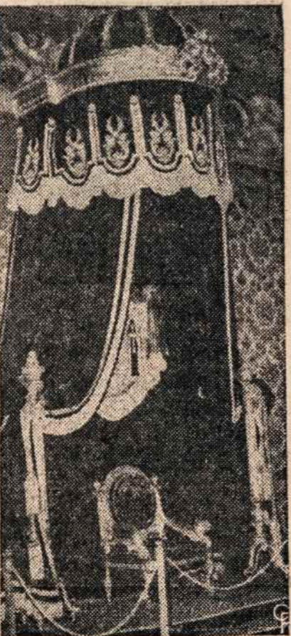
SOSTAS Bilputinėje. Monako valstybėje. Jame sėdės Grace Kelly, princo Rainier III, žmona.

Mintis dėmesio verta, nors tas autorius kalbėjimas už „kiekvieną lietuvių, ypač vilniečių“, tas vienim pasitikėjimo reiškinys, kitiem jo atsakymas, tenka laikyti individualiu paties autoriaus skoniui.