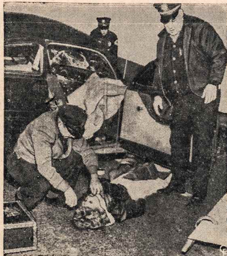
BĖGDAMI nuo policijos 80 mylių greičiu Los Angeles priemiesty užsimusė du jaunuoliai.