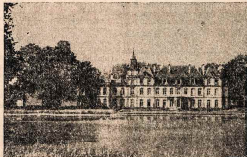
POURTALES pils Strassourge, kur posėdžiauja pavergtųjų Europos tautų atstovai.

Pagaliau, socialdemokratų aktyvesnis išsijungimas (jų buvo įvairių delegacijų sudėty, buvo atstovaujamas ir centro ir vidurio Europos socialistų internacionalas) buvo tarytum atsakymas į Sovietų pastaruo-