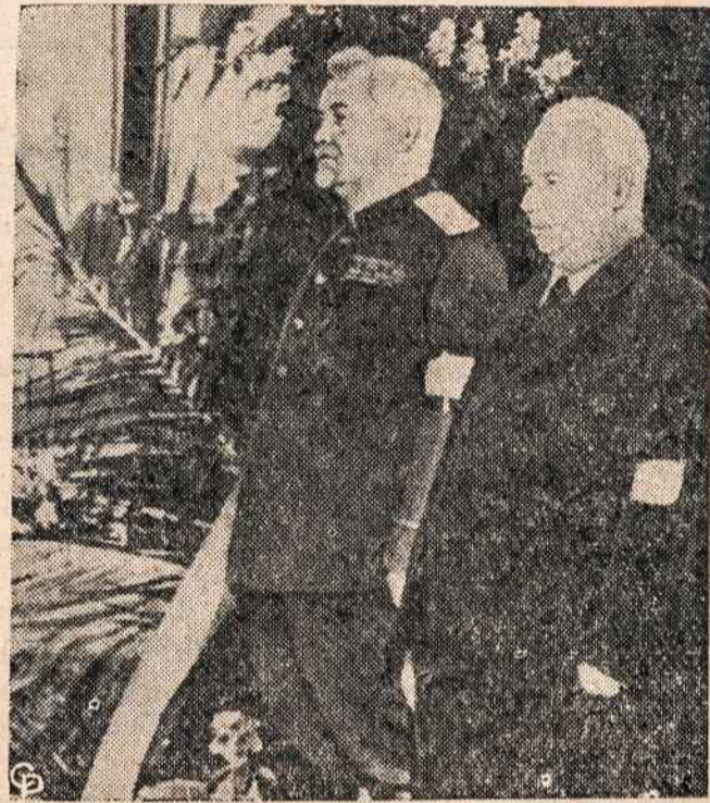
GRABOIAI iš Kremliaus. Chruščiovas ir Bulganinas liepa asaras prie Stalino karsto. Jį palaidojo, nuvyko pas Edena. Pakelė dar palaidojo Kominformą.

laikyti taiką Palestinoje. Patenkintas ir Izraelis. Patenkinta ir Maskva, nes ji turėjo progą pademonstruoti, jog vidurinių rytų klausimo sprendime ir ji turi dalyvauti. Anglijos užsienių reikalų ministras taip pat patenkintas, tačiau nuo optimizmo susilaikė. Nepatenkinti arabai tremtiniai, kurie dėjo viltis į Sovietų paramą.