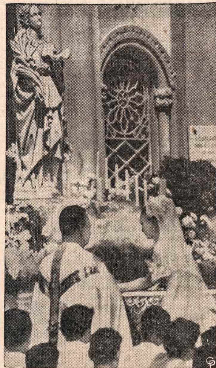
JAUNAV DĖ Grace Kelly eina bučiuoti relikvijų vienos krikščionės kankinės Monako bažnyčioje.