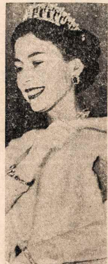
KARALIENĖ ELZBIETA turi šypsniu priimti besisėjančius Maskvos bostus.

Kaip visa tai išliko aikštėn, kokios įtakos turėjo didiesiems valymam, kodėl apie tai tik dabar kalbama, atpasakosim kitu kartu.