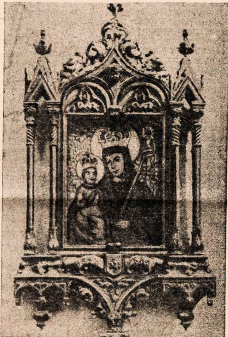
MARIJOS paveikslas, buvęs Vilniaus katedroje prie didžiojo altoriaus. Jis buvo dovanotas Vytautui D.

kunigai ir šventi pasauliečiai. Jų pastangomis amžių bėgyje Dievo Žodis ir mūsų Tėvyne Lietuva. Ji tapo katalikiška ir mieliai klausė Dievo Žodžio skelbiamą gyvą žodžiu iš sakysiu amžinųjų tiesių šio gyvenimo kelyje. Švedami Lietuvos paaukojimą Nekalčiausiai Marijos Sirdžiai mes negalime palikti nušalyje šv. Rašto. Juk čia mes randame visas žinias iš Marijos gyvenimo. Jame skaitome angelo apreiškimą Marijai, Marijos džiaugsmo giesmę "Magnificat", Marijos meilę žmonijai ir jos rūpinimąsi bei kančias mūsų išganimui. Tad skaitydami šv. Raštą mes nuolat turime progos stebėti Marijos pasiaukojimo stebuklus ir kreiptis į ją savo nuolankiais prašymais ir maldomis prašydami jos tarpininkavimo prie Aukščiausiojo sosto. Juk ji yra mūsų Tarpininkė!