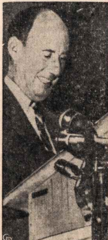
A. STEVENSONAS ŠYPSNIAUS, nes jis konkurentas Kefauveris daro mažiau pavojingas.