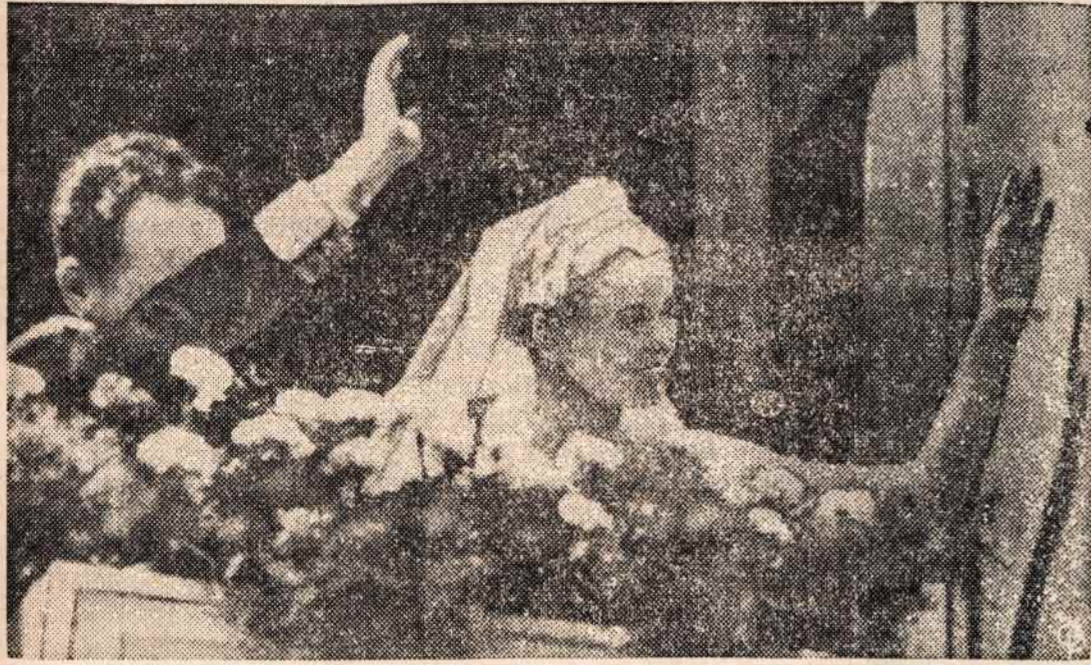
PRINCAS RAINIER III ir Grace Kelly. Monako jaunavedžiai, atsako į minios sveikinimus.