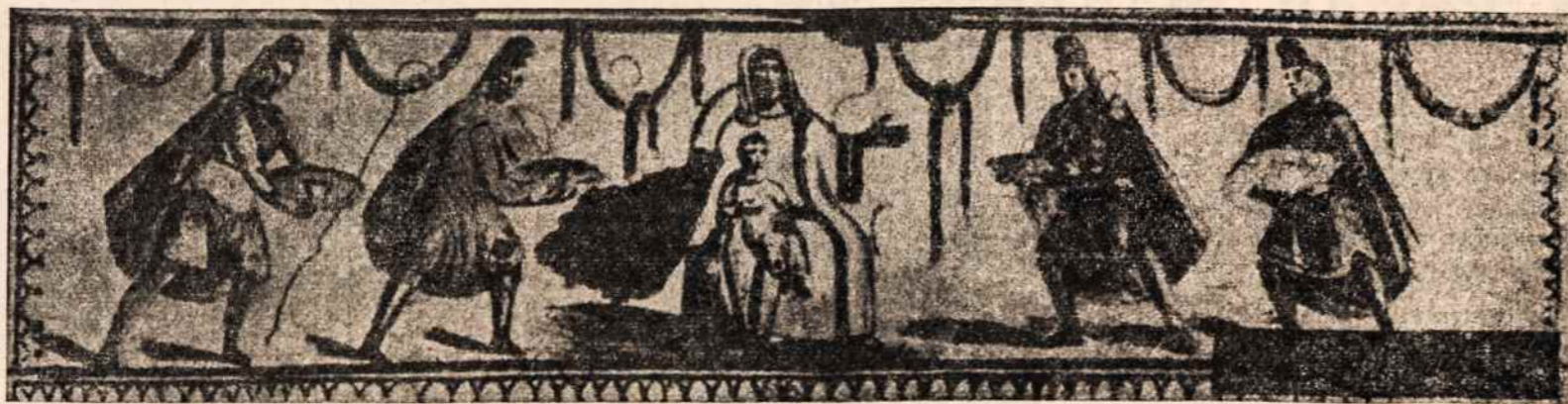
KATAKOMBOSE, pieštas Marijos paveikslas.