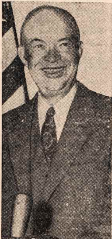
EISENHOWERIS ŠYPSNIAUS, nes rinkimuose jam geros perspektyvos.