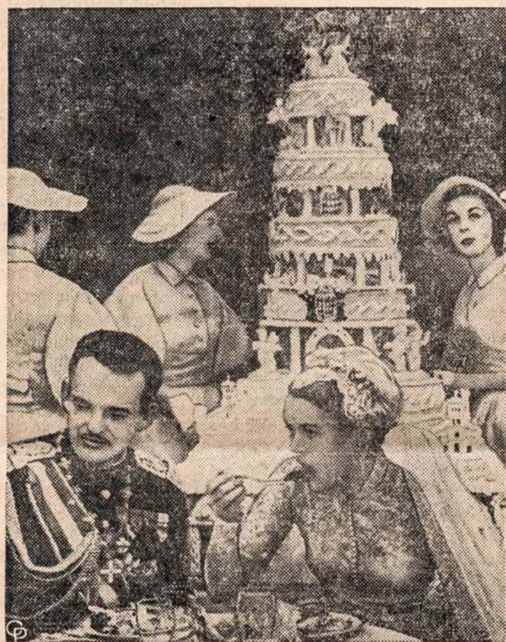
UŽKANDŽIAI tarp valgių Monako princo vestuvėse. Vestuvių tortas 5 pėdų aukščio ir 300 svarų buvo gaminamas 3 mėnesius.

Jau Seneka, kalbėdamas apie filosofiją, pabrėžė, kad filosofas turi gyventi taip, kaip jis kalba, nes filosofija turi remtis darbais, o ne žodžiais, ar minčių paradavimu. Šie žodžiai tuo labiau tinka auklėjimui.