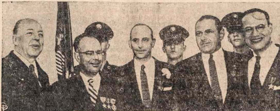
APDOVANOTI KONGRESMANAI, Armijos sekretorius Wilbur Brucker (l.) įteikė medalius burvėm II kare karininkam: Sen. Charles E. Potter (Mich.), Rep. Phil Weaver (Neb.), Rep. Steven Derouian (N. Y.) ir Rep. Henry Reuss (Wis.).

Ir dar viena skriauda, nebeatitaisoma. Kiek žmonių yra nukentėję, kai savo metu Stalinui neatidavė "tinkamos pagarbos", Kas atlygins už jų kančias ir kraują? Turi būti į šūkšlyų dėžę sumestas visas kraugerisškas bolševikų valdymas. Teisingumas to reikalauja.