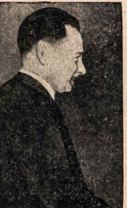
GEN. SEKR. HAMMARSKJÖLD turi teisę šypsotis, sustabdęs kovas Palestinoje.

"The Universe" rašė, kad Chruščiovos nėra geresnis už nacių karo nusikaltėlius, nes jis vykde Stalino įsakymus ir masiškai žudė žmones. O pasiteisinimus, kad nacių pareigūnai tik vykde aukštesnės valdžios įsakymus, Niurnbergo teisme ir vakariečiai ir sovietai atmetė.