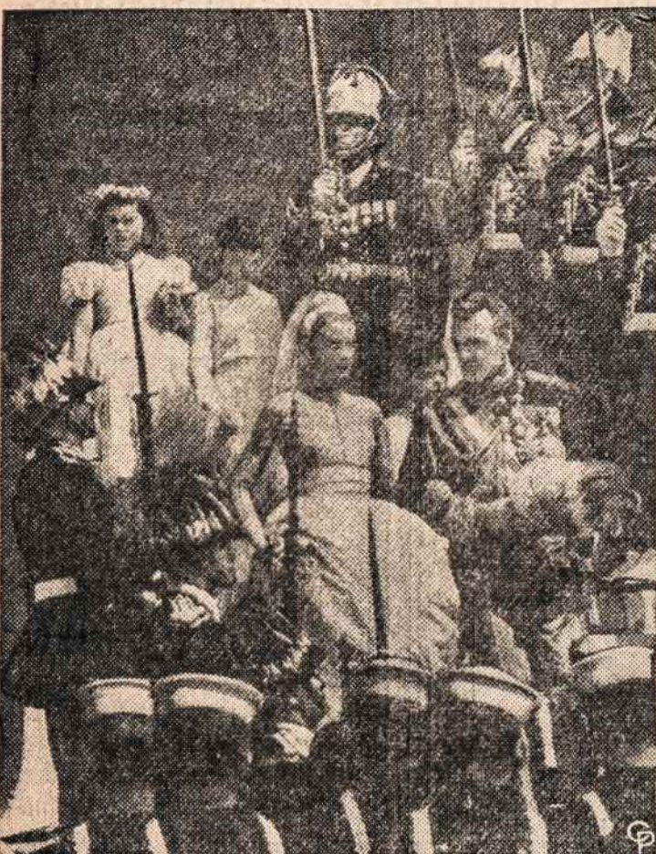
AMERIKOS jūrininkai atiduoda pagarbą Monako jaunavedžiam — princui Rainier III ir jo žmonai Grace Kelly.