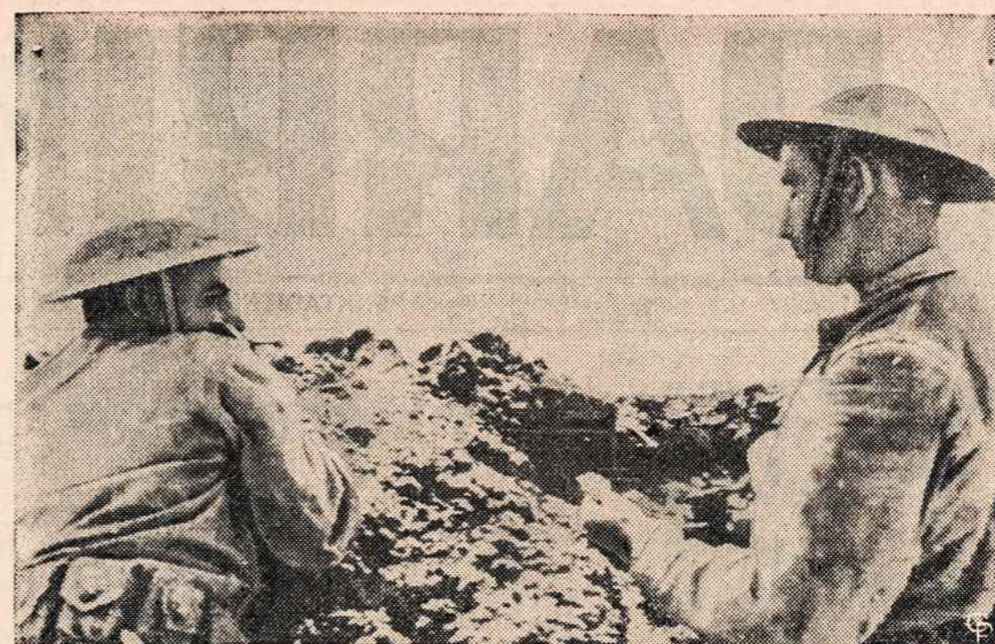
PALESTINOJE žydų kariai tikrina lauką, kada turi prasidėti karo pailaupos. Jos prasidėjo, bet pasienio susišaudymai neaprimsta.

Pakeitus stabą Maskvoje, pakeistas ir jam kruvinų aukų aukotojas Atėnuose. Tai vienas iš pirmųjų už Sovietų Sąjungos ribų. Lauksim eilės kitim, dar didesniems?