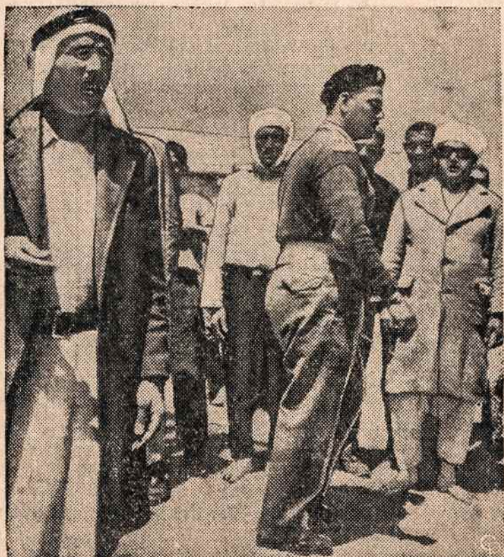
ARABAI, išvyti iš namų Gazoje, ruošiasi grįžti, nors žydai ir nenorėtų leist.

Sovietų Sąjungos N. Chruščevą ir N. Bulganiną, kai jie lankėsi Indijoje, indų skautų-čių sąjunga neturėjo jokios intencijos, o taipogi ir dabar laikyti Sovietų Sąjungos pareigūnus "garbės skautais". Įvyko nesupratimas, skautam nesupratęs vadovybės instrukcijos, užrišant kaklaraiščius N. Chruščioviui ir N. Bulganinui, ko nebuvo visai norėta padaryti".