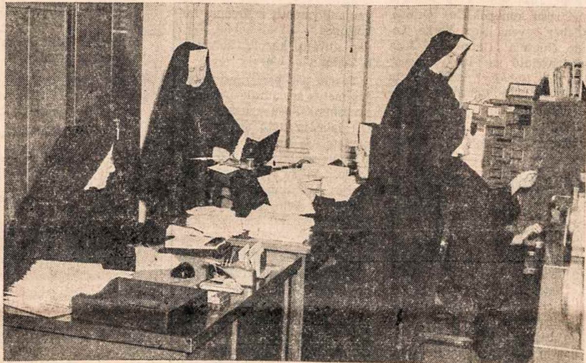
BROCKTONE Nukryžiuotojo Jėzaus Seserų tvarko koplyčiai statyti vaivus korespondencija.