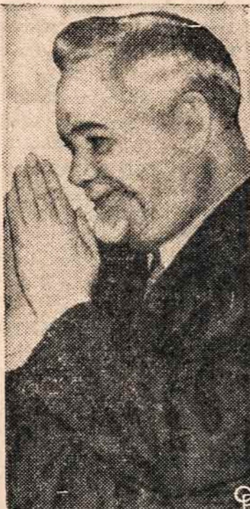
"TIKĖKITE MUMS", — maldauja Bulganinas Londone, — kad mes nesame žmogžudžiai, kaip tas Stalinas...

telstvo). Tai 1920 pradžioje pasikalbėjimo su "New York Evening Journal". Jis ten pabrėžė Rusijos taikingumą apskritai ir Lenkijos, Rumunijos atžvilgiu specialiai. Kaip tolimesnius Sovietų siekimus jis mini ten "taikinga sugyvenimą tarp tautų, darbininkų ir ūkininkų visose tautose, kurios bunda naujam gyvenimui, be išnaudojimo, be stambiųjų savininkų, be kapitalistų, be tarpininkų". Taigi