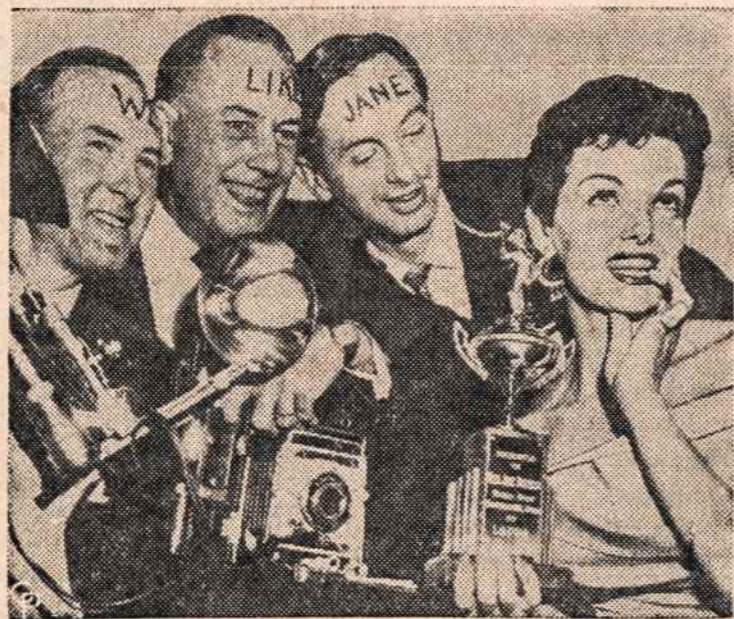
WELIKE JANE — išrašė savo kaktose Hollywoodo fotografai, kuriems patinka filmu artistė Jane Russell, šiemet pripažinta daugiausia dirbusi.