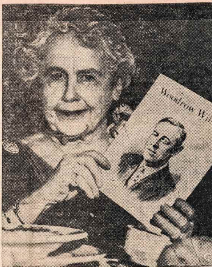
WASHINGTONE buvo prisimintas miręs prez. Woodrow Wilson jo 100 gimtadienio proga. Vėlonies žmona dar gyvena.