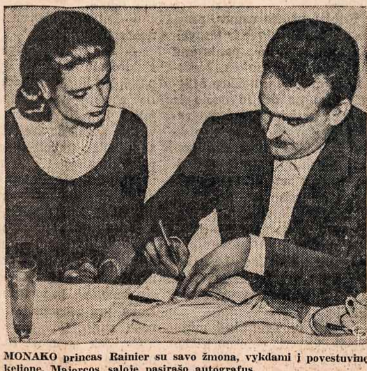
MONAKO princas Rainier su savo žmona, vykdamis į povestuvinę kelionę, Majorcos saloje pasirašo autografus.

Rengia Lietuvių Bendruomenės Kearny-Harrison Apylinkės Kultūros Būrelis 1956 M. GEGUŽĖS (MAY) 6 D. 6 VAL. VAK. Lietuvių Katalikų Bendruomenės Centro Salėje, 6 Davis Ave., Kearny, N. J. Visi lietuviai kviečiami dalyvauti šiame parengime. Programa bus įvairi ir miela kiekvieno lietuvio širdžiai. Matysite linksmą komediją: "ISNUOMOJAMA VILA", girdėsite lietuviškų dainų, džiaugsitės lietuvišku atžalynu — šeštadieninės Mokyklos mokiniais, dalyvaujančiais vakaro programoje, pasišoksitės ir tikrai lietuviškai pasilinksminsite. Pelnas Lietuvių Šeštadieninės Mokyklos reikams Auka $1.00