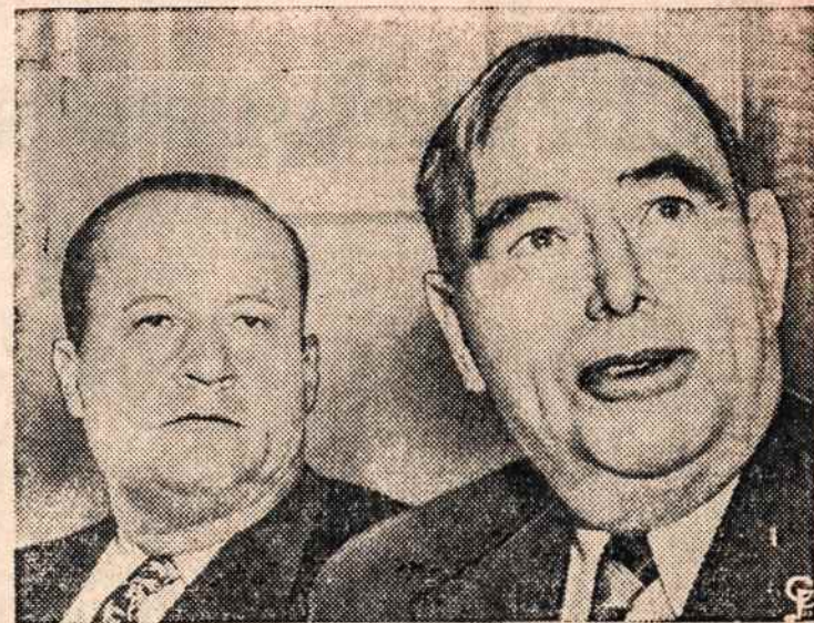
WILLIAM KNOWLAND (k.) ir Joseph W. Martin pareiškė, kad mokesčiai nenumatomi sumažinti.

XL INR. 31 680 BUSHWICK AVE. PENKTADIENIS - FRIDAY BALANDŽIO - APRIL 27, 1956 M. Redakcija - Glenmore 5-7281 Administracija - Glenmore 5-7068 10 CENTŲ