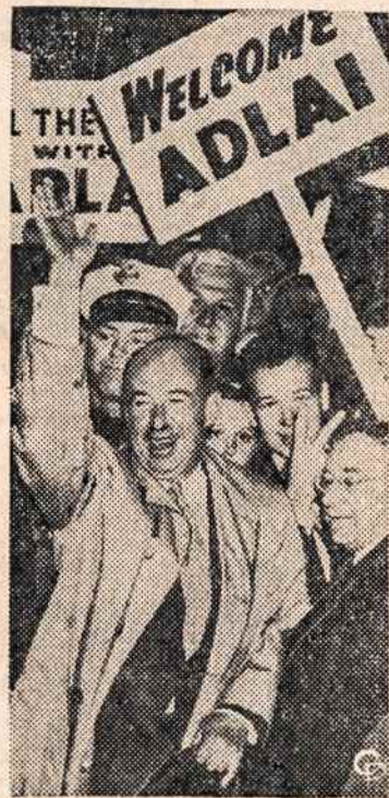
ADLAI STEVENSON, apsuks didesnę dalį Amerikos, sutinkamas Washington.

• Sovietai sumažino aukštųjų pareigūnų algas iki 50%.