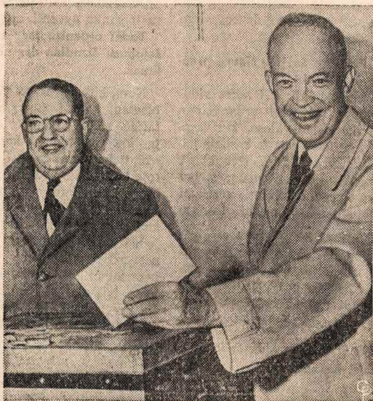
PREZIDENTAS D. EISENHOWERIS balsuoja Gettysburge, kas turėtų būti respublikonų kandidatas į prezidentus.

aktyvinių medžiagų, visai to nežinant. Dėl to mūsų kūnas ir turi mažus kiekius natūralinių radioaktyvinių elementų. Mes gauname tam tikrą jų kiekį, kai mus fotografuoja Rentgeno (X-ray) spinduliai. Mūsų laikrodžių skaitmens irgi yra kartais radioaktyvūs. Kitais žodžiais tariant, — radiologinis pavojus yra mums žinomas. Tokiu būdu, jei mes žinome apie gresiantį pavojų, tai galime kiek ir padirbėti, kad jo išvengtume. Didžiausias radioaktyvinių kritulių pavojus pri-