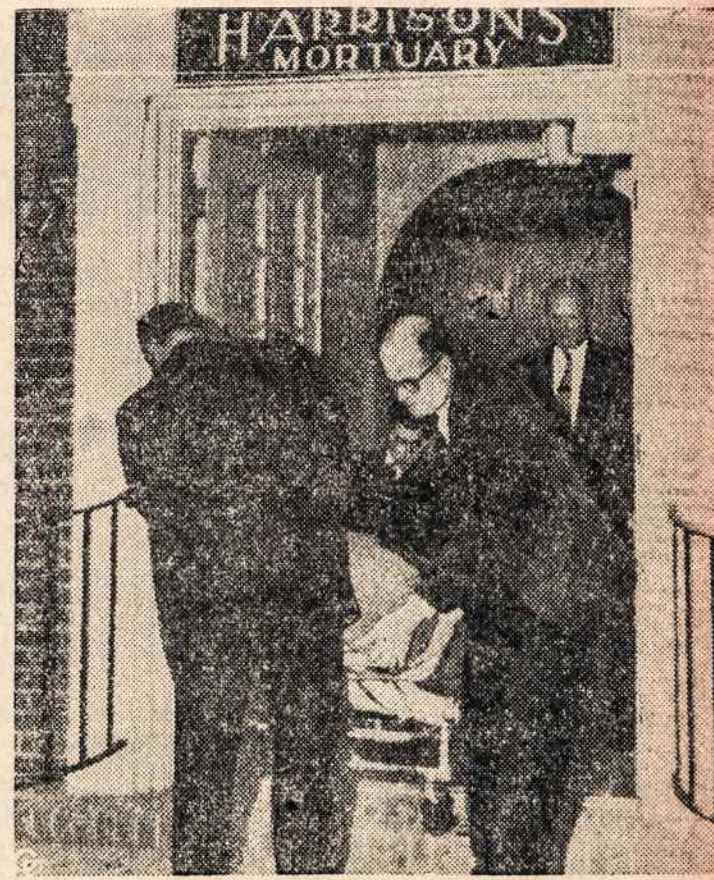
ISNEŠA mirusį A. Barkley, buvusį JAV viceprezidentą.