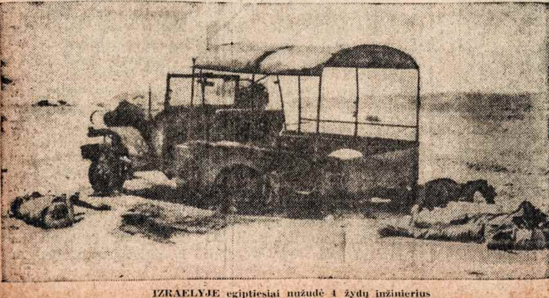
IZRAELYJE egiptiečiai nužudė 4 žydų inžinierius