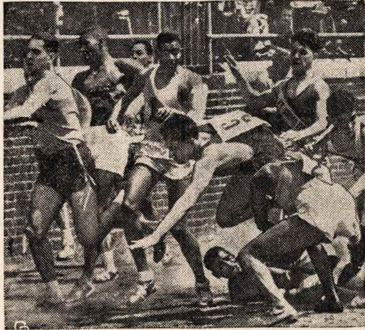
PHILADELPHIJOJE aukštesniųjų mokyklų mokinių sporto šventės dalyvavo ir Anglijos mokiniai.

New York'e Met. Lygos pirmenybėse lietuviai nugalėjo Marshall klubą rezultatu 4½—1½. Jau pradėjus lošti mūsiškiai tuojau įgauna persvarą keliose lentose. Pirmas baigia Trojanas negailestingai įveikdamas J. Petras, po to Marshall išlygina jų C. Junkers pergalę prieš Slapšį. Sukio (Nukelta į 8 psl.)