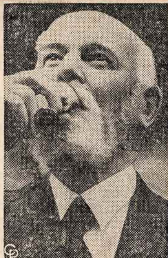
TH. KOERNER, Austrijos prezidentas, sulaukęs 83 metų, geria tosta į savo sveikata.

Prancūzijos min. pirm. Mollet pareiškė Vokietijos žurnalistams, kad Prancūzija remia Vokietijos sujungimą lygia greita su nusiginklavimu ir bus ištikima vieningai Europai, Nato ir vakarų politikai. Netrukus pats Mollet su užs. reik. min. Pineau vyksta į Maskvą. Vokietija Anglijos ir Prancūzijos pareiškimais patenkinta. Jaučia, kad vakarai nesirengia jos išduoti.