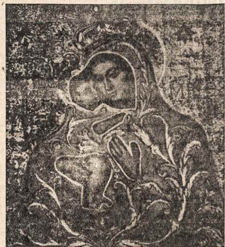
ROMOJE šv. Sergijaus bažnyčioje yra Lietuvos Pietų Madonos paveikslas, romėnų labai garbinamas.

Kristus yra pasakęs prilyginimą, kad visuomet reikia melstis ir nepailsti (Luk. 17, 1). "Nuolat melskitės" (Tes. 5, 17)—ragino šv. Povilas savo laiko tikinčiuosius. Čia,