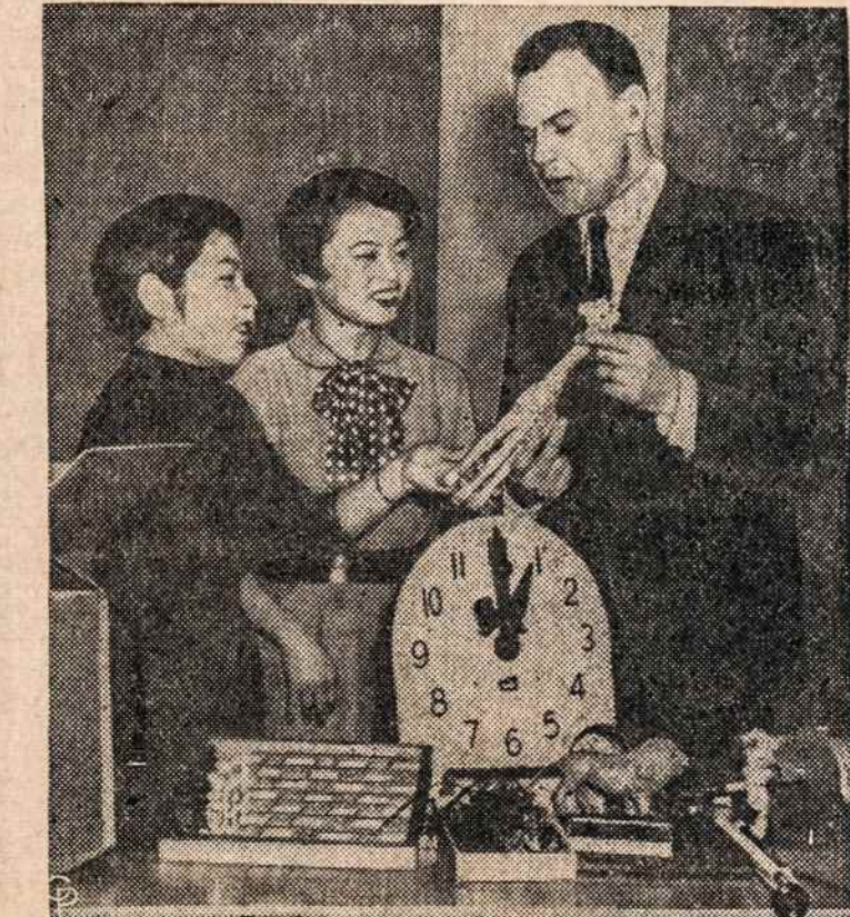
DVI JAPONIKES, Hirošimos atominės bombos aukos, apgydytos New Yorke, nors aklos grįžo namo, priimdamos dovanas iš fondo akliems remti.