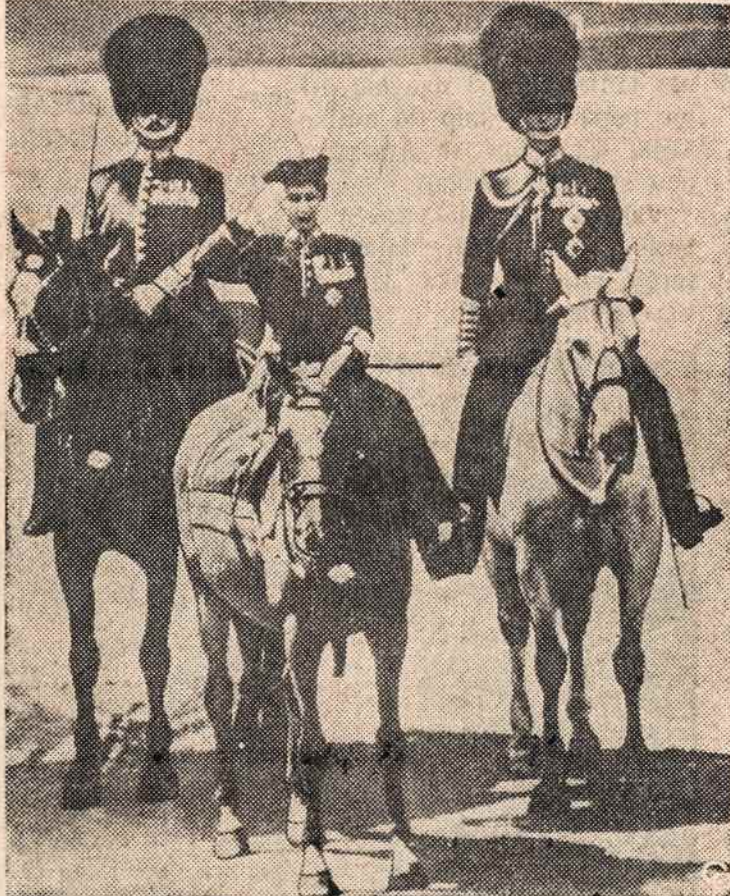
KARALIENĖ ELZBIETA susilaukė 30 metų, Ji priima kariuomenės parada nuo arklis ir iš balkono.