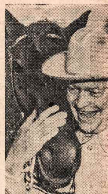
PREZ. D. EISENHOWERIS užtikrintai dovana, kuria jam parūpins JAV arklis draugija.