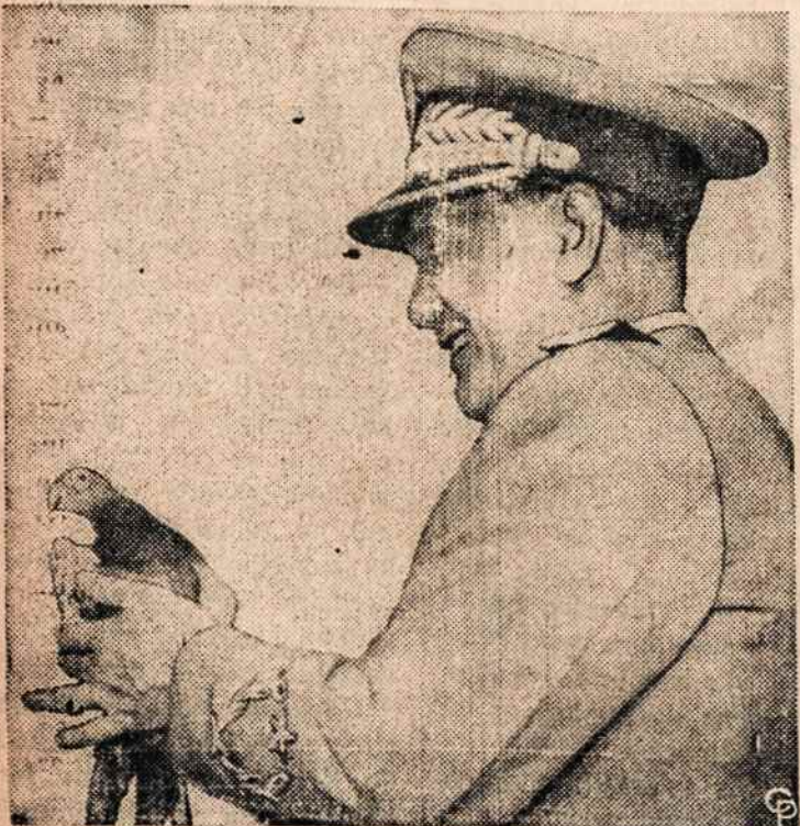
JUGOSLAVIOS TITAS važiuoja po svečius. Savo "gerai valiai" pažymėti laiko pašto karvelį, bet pats užtikrina, kad ten ne vana-gas.

Vilmaus "Tiesa" rašo, kad (Nukelta į 7 psl.)