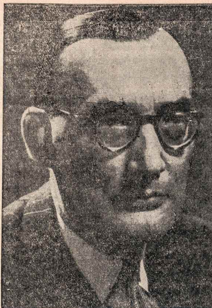
MIN. STASYS LOZORAITIS.