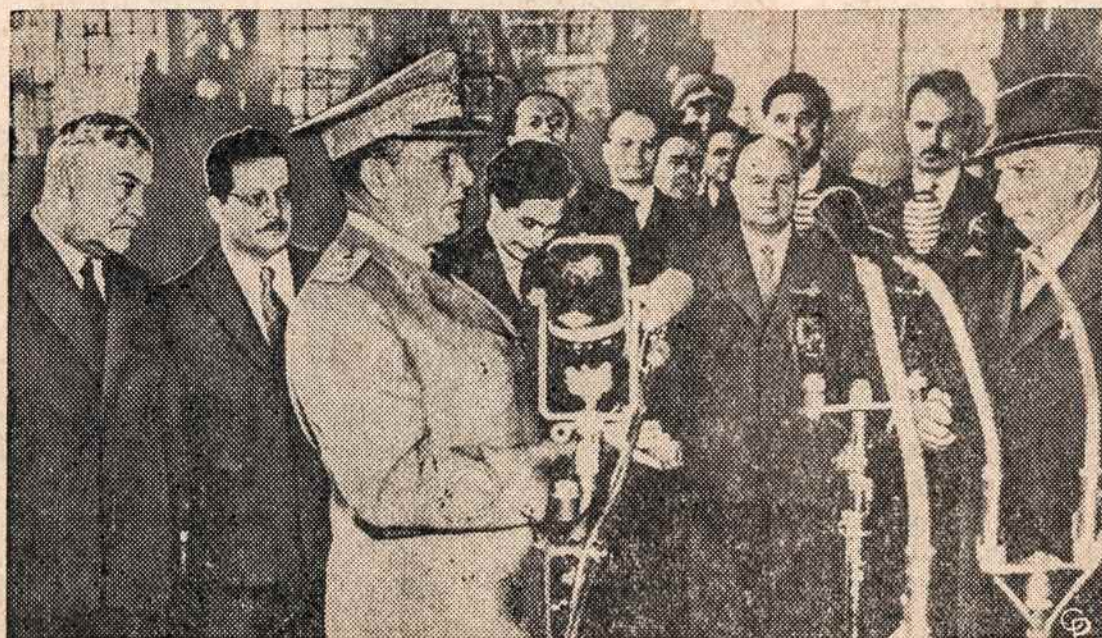
TITO sutinkamas Maskvos stotyje. Pirmoje eilėje iš k. į d.: premjeras N. Bulganinas, jugoslavų už. reik. min. Ed. Kardelj, Tito, Nikita S. Kruščiovas, maršalas E. Vorošilovas.