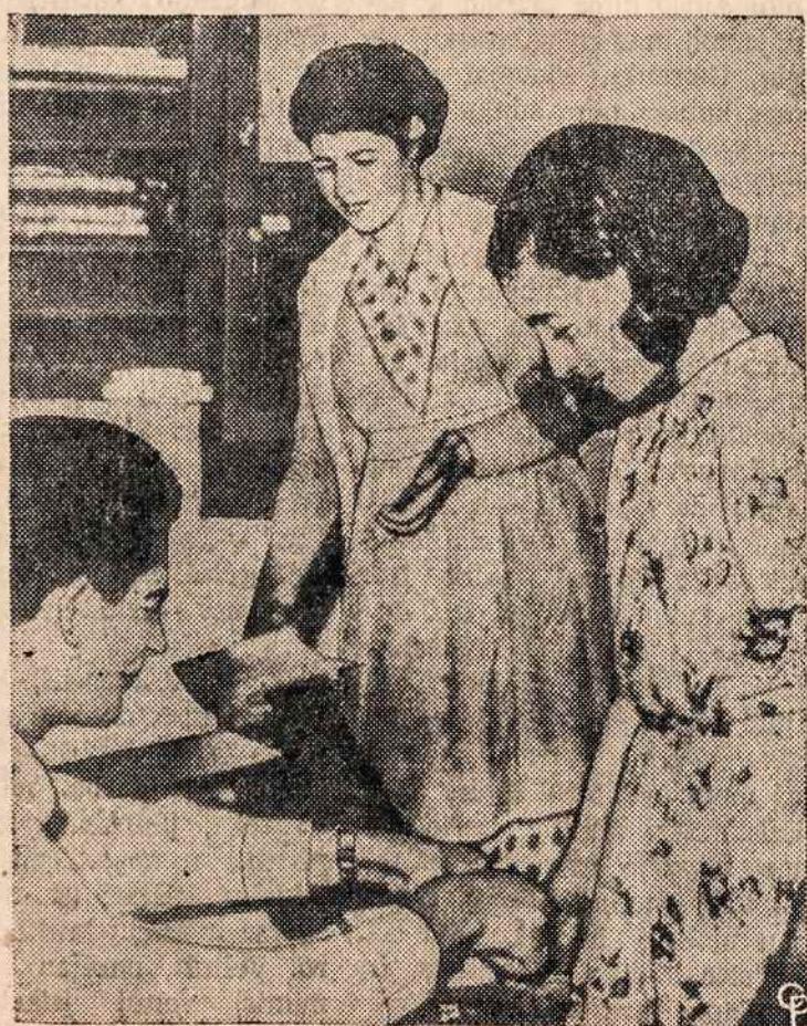
PIRSTUS SPAUSTI turi ir šios 13 metų mergaitės Kipro saloje. Tokia tvarka anglai įvedė, kad susektų teroristus.

jų pasių gyventojai, vadinami bužanais "buginiais". O Bus-kas dar XIa, gale ir XIIa, pirmoje pusėje labai dažnai išsis-kiria iš Valuinės Vladimiro kunigaikštijos, jos valdų ir ei-lės miestų ir kuris dar prieš Rusų valstybės pradžią bus tu-reikšmė bei apie save jungęs plačią sritį, eilę valstijų. Mieste visi senoviniai paminklai laiko ir karų sunaikinti. Dėmesio vertos naujoji pilis su parku ir katalikų unitų bažnyčia. Bus-kas yra sena vietovė, kur kele-tą kartų maišėsi totoriai. Gre-timai viename urve yra prois-torinių radinių vieta. Taip pat apylinkėje yra kapų ir kurgan-ų dar iš lietuvių čia karų. Daugiau žr. Sen. ir Nauj. Liet. Enciklopedijas.