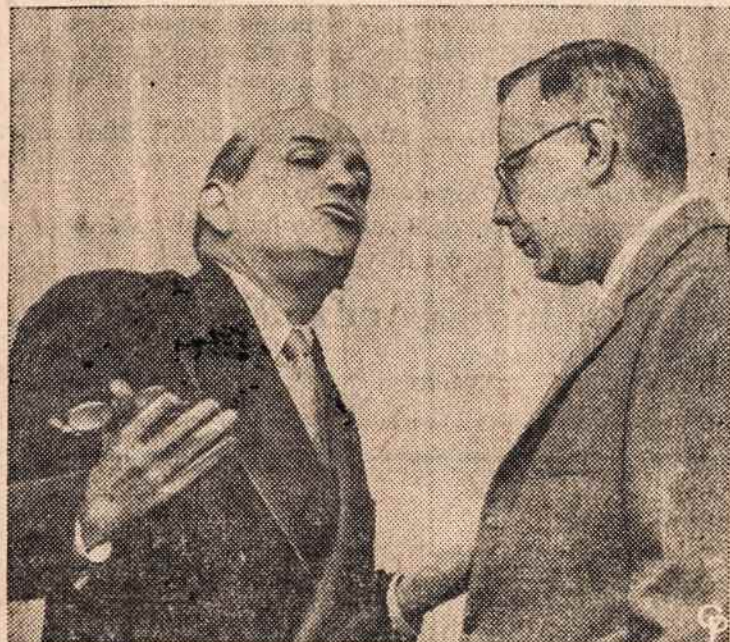
A. A. SOBOLÉVAS , Sovietų atstovas prie JT, informuoja iš anksto savo globojamą Egipto atstovą, kaip jis balsuos.