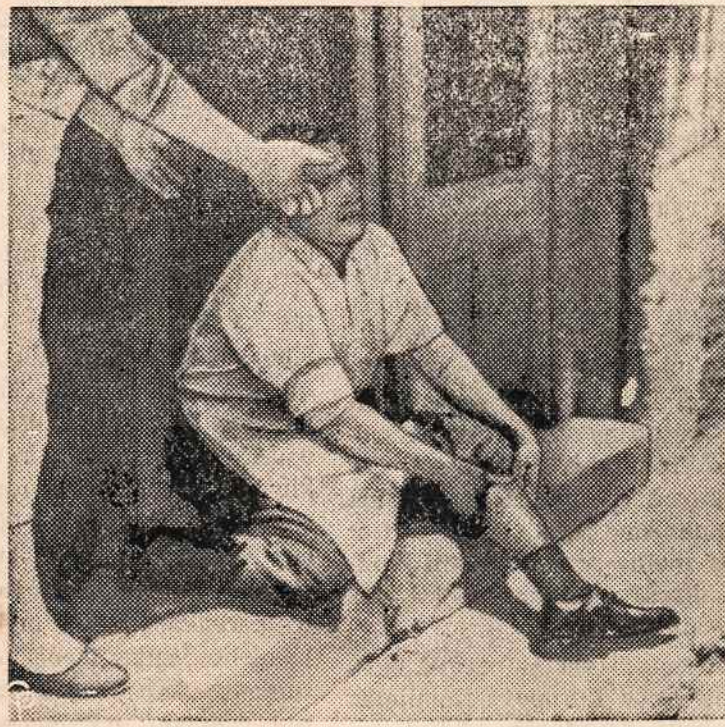
NUO BOMBU Kipro saloje, slėptų anglam, kliuvo ir civiliniam žmonėm.