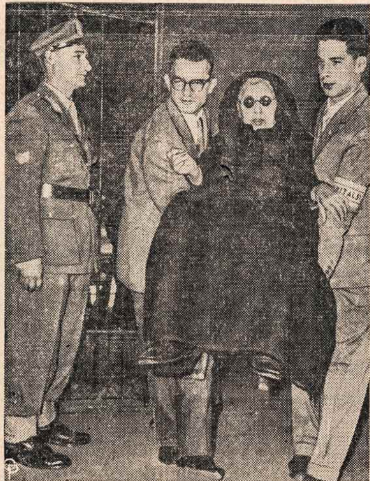
ITALIJOJE toliu būdu keliavo į savivaldybių rinkimus; dalyvavo 88%.