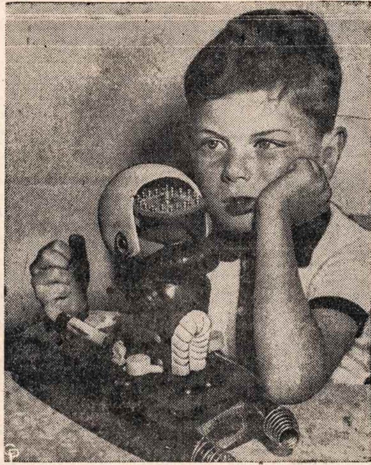
ZAISLŲ PARODOJE NEW YORKE vaikus žavi žaislai su „elektroniniais smegenimis“.