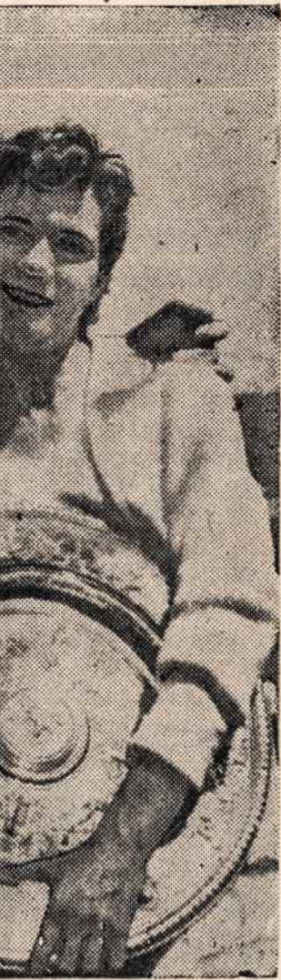
SHIRLEY FRY (dešinėje), laimėjusi teniso rungtynes, laiko do-va. Anglijoje ji nugalėjo Angela Buxton (kairėje).