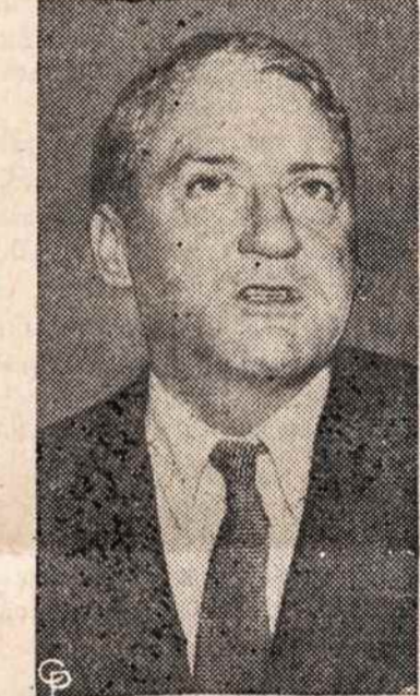
JOHN SHERMAN COOPER, Amerikos ambasadorius Indijai, sutiko kandidatuoti į senatą kaip Kentucky re-publikonų atstovas.

for Clerical Positions as STENOS AND TYPISTS Permanent openings with Fast Growing Company. Pleasant Associates. Company Benefits — Good Starting Salaries — 40 hr. week — Time and one half for overtime. apply PERSONNEL Combined Insurance Co. of America 5316 Sheridan Road Tel. RAvenswood 8-1000