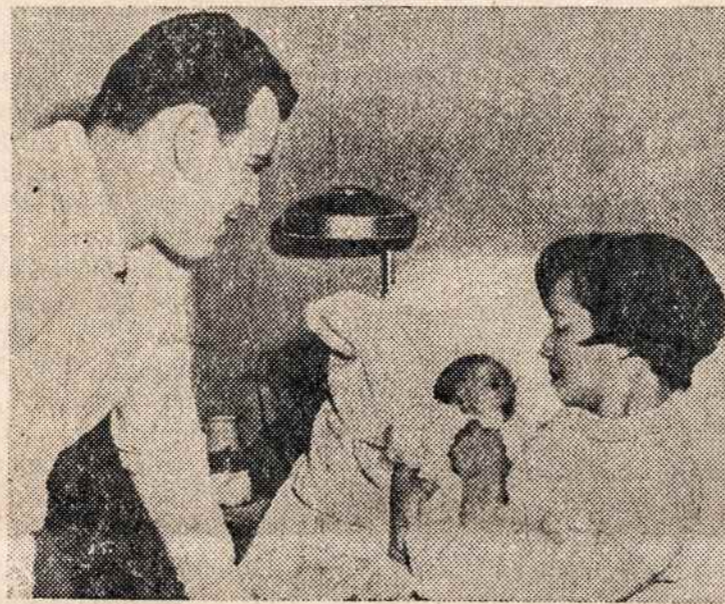
BALTIMOREJE Orioles beisbolo komandos žaidėjas susilaukė dukters.