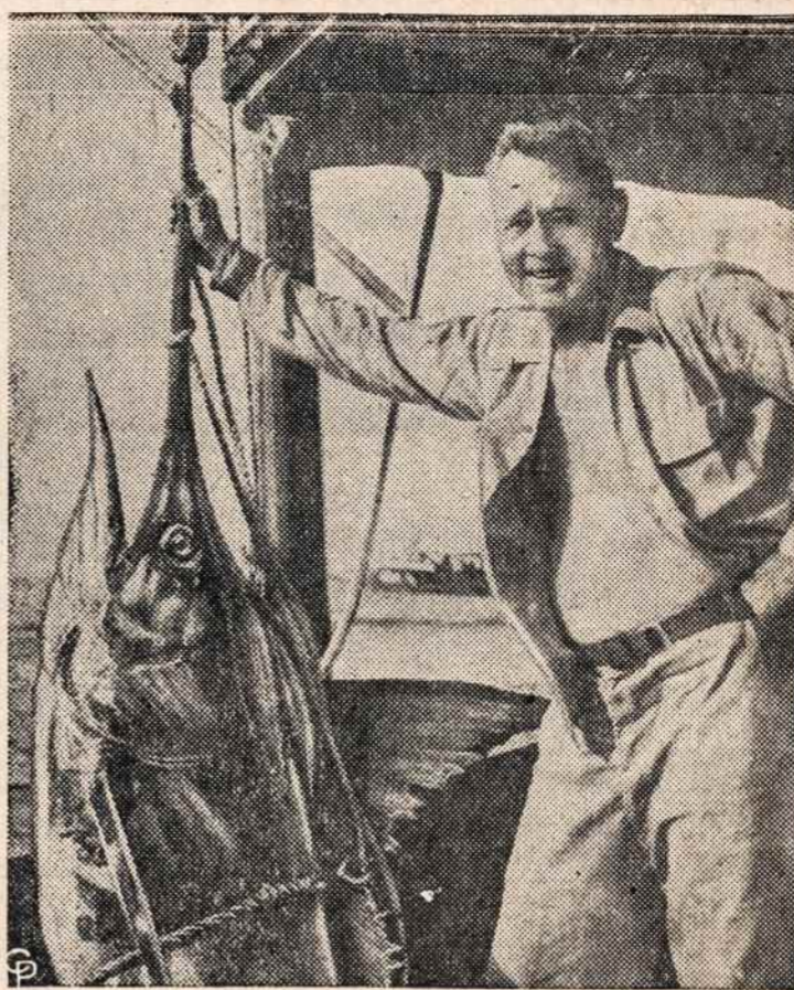
CONGREJO jachtos klubas Puerto Rico suruoštos žvejybos varžybose pagavo 322 svarų žuvį.

Išnuomojamas 5 kambarių butas prie parko ir Jamaica linijos stoties. Kreiptis: Tel. MI 7-2658 arba asmeniškai: 112 Jerome St., Brooklyn 7, New York.