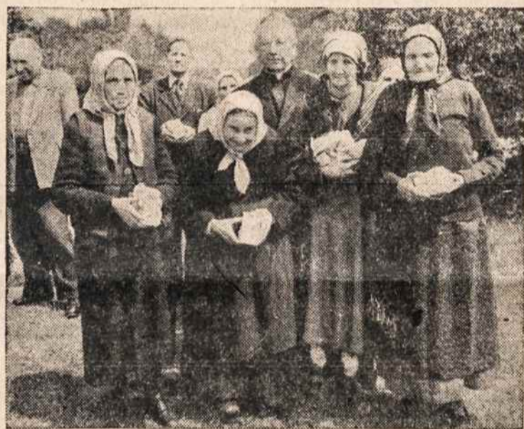
VOKIETIJOJE užsilikusios lietuvių senutės.

— Nors aš ir dipukas esu, bet tau neleisiu žeminti mano brolių "krajanų", pirmųjų mūsų ateivių Amerikoje. Jei tu vėl lauki faktų — prašau: o kas ikūrė lietuviškas parapijas, kas pastatė mokyklas, kas suorganizavo ir patį Balfo, padėjusį tūkstančiams mano likimo brolių? Kas siuntė ir tebesiunčia Europon ir net Sibiran siuntinius, kas aukoja ir remia įvairius labdarinius darbus? Ir mes, dipukai, daug širdies iš jų esame patyrę — jų rūpesčiu ir aukom ir čia atvažiavom, — kalbėjau jau kiek pakeltu tonu ir gniaus savo tautiečius, rusiškųjų caro laikų "dipukus", pirmuosius