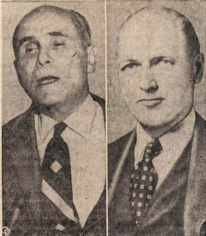
NOBELIO medicinos premija šiemet gavo du amerikiečiai ir vokiečiai. Atvaizde matome Kolumbijos un-to (ew Yorke) prof.: dr. A. Kourmand ir dr. D. W. Richards.