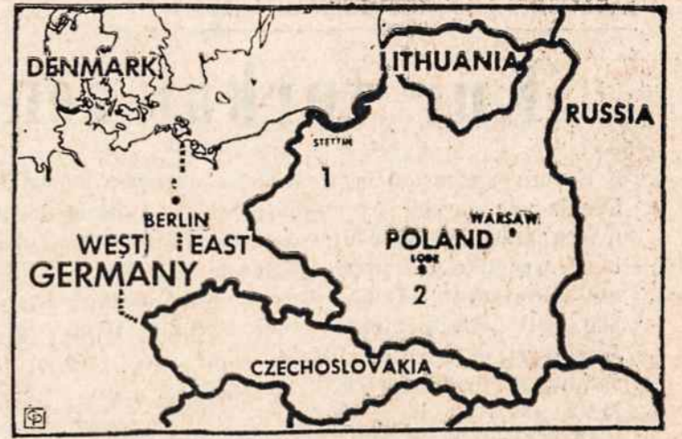
LENKŲ KARIUOMENĖ pasipriešino Sovietų kariuomenei prie Stetino, kuri mėgino ten, iš rytų Vokietijos pereiti į Lenkiją.

Tačiau išsivadavimas esą lenkų reikalas, ir jis nemanas, kad Amerika siųstų savo kariuomenę, net jeigu Sovietai mėgintų gir. klu palaužti lenkų išsilaisvinimo pastangas.