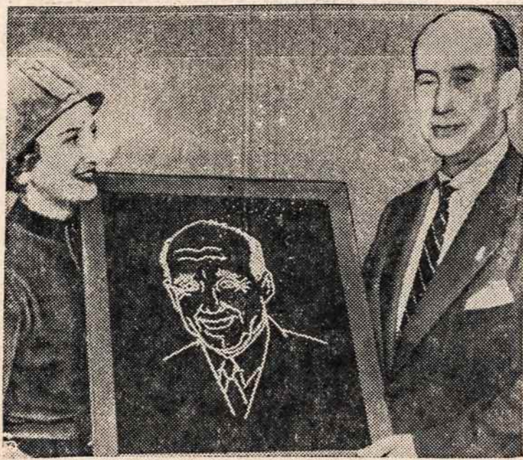
CHICAGOJE Adlai Stevensonas gauna savo fotografiją, padarytą iš makaronų.