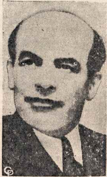
WLADYSLAW GOMULKA, naujas lenkų komunistų vadas, "titininkas".