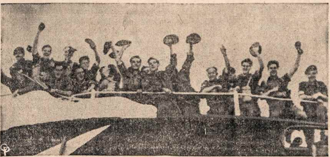
ANGLAI išvyksta iš Suezio.

Pagal nusistojusias pažiūras ginkluotos pajėgos yra laikomos valstybės suvereniteto reiškiu. Ginkluotas karys negali peržengti kitos valstybės teritorijos be tos valstybės sutikimo, karo laivai negali be to sutikimo įplaukti į teritorinius vandenius, o karo lėktuvai skraidyti ties kitos valstybės teritorija. Austrija pašovė sovietų kari, kai jis, besivydamas pabėgėlius iš Vengrijos, įsibrovė į Austrijos teritoriją. Toks įsibrovimas pagal tarptautinę teisę yra laikomas valstybės sienos ar teritorinio suvereniteto pažeidimu, kuriam kiekviena nepriklausoma valstybė priešinasi. Del tokių pažiūrų ir satelinės valstybės, siekdamas nusikratyti Maskvos viešpatavimo, pirmiausiai rūpinasi Sovietų kariuomenės pasitraukimu iš jų teritorijų. Įsibrovusias į jos teritoriją svetimas ginkluotas pajėgas valstybė paprastai nuginkluoja, jeigu tos pajėgos neturi teisėto pamato ten su ginklais pasirodyti. Jeigu valstybė nepajėgia įsibrovusias į jos teritoriją kariuomenę nuginkluoti, kaip kad atsitiko su raudonosios kariuomenės antplūdžiu Baltijos valstybėse 1940 m. birželio mėn., tai jos suverenitetas laikomas suspenduotu, jos teritorija yra laikoma svetimos kariuomenės okupuota.