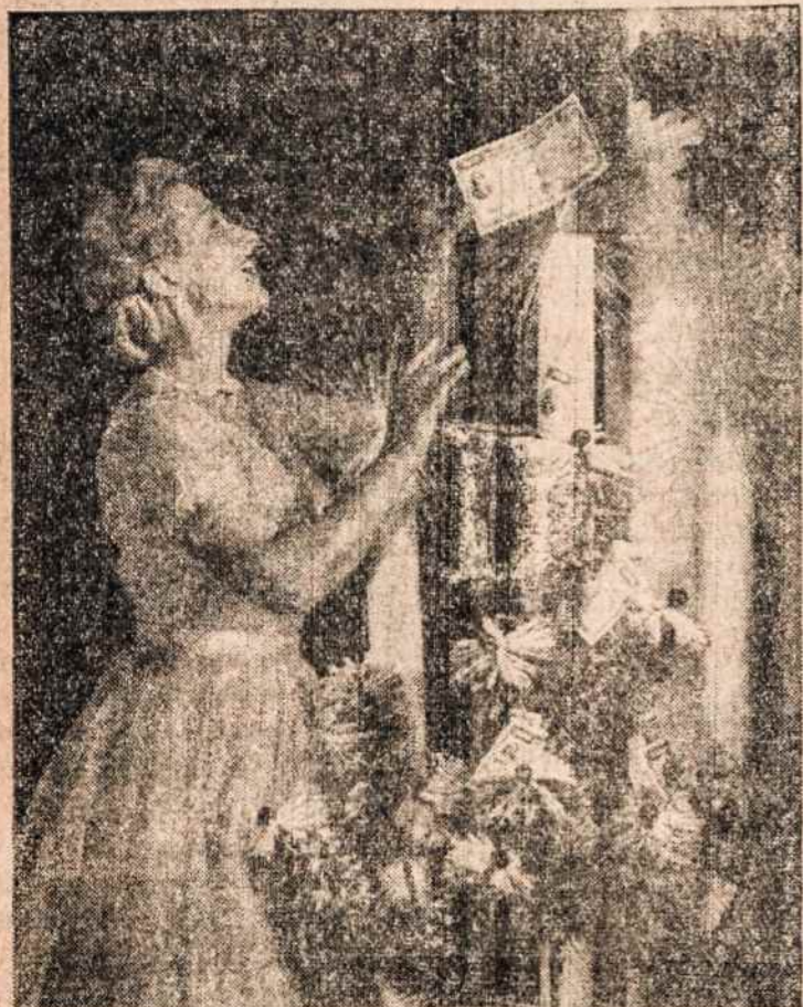
Actress Hona Massey, decorating Christmas candles with United States Savings Bonds, takes time out from helping the people of her native Hungary to wish her fellow Americans a happy New Year of peace on earth, good will toward men. "What a wonderful thing," she says, "to be able to own these shares in one's country and to give them to our loved ones as presents with a future, representing our faith, our trust, our love for our country and our free way of life."