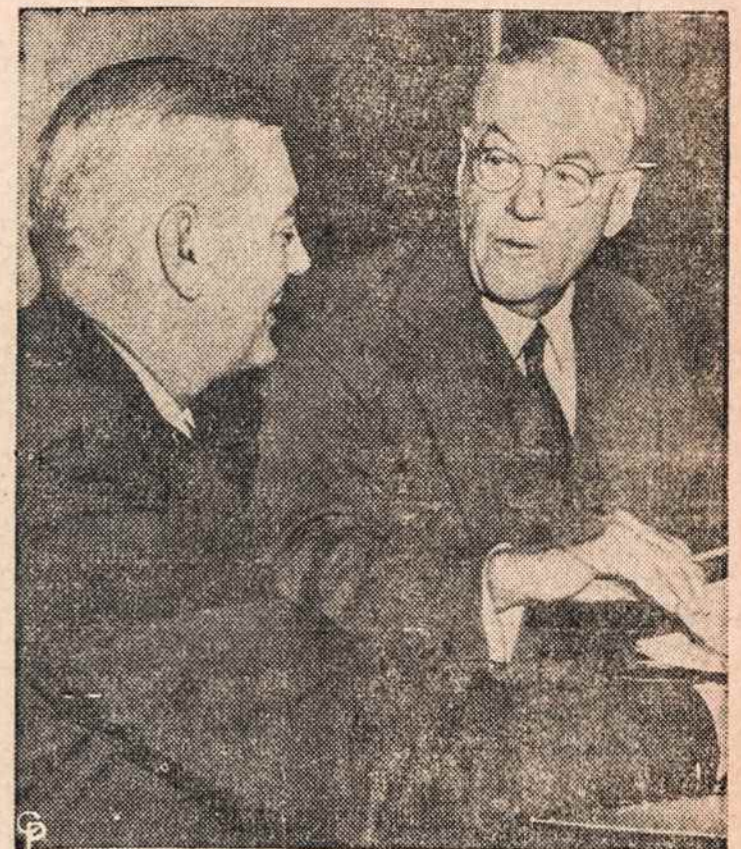
DULLES jau pasveikęs. Prieš išvykdamas į Europą tarėsi su savo pasekretorium Hooveriu.

Rodos, nesunku būtų del to susitarti. Bet taip nėra. Lygiai taip, kaip valstybės nėra linkusios išsivadinti kad ir mažiausios dalies savo suvereniteto, taip jos yra įsikibusios ir į to suvereniteto reiškią — ginkluotas pajėgas. Jos ir klausyti nenori apie bet kurį