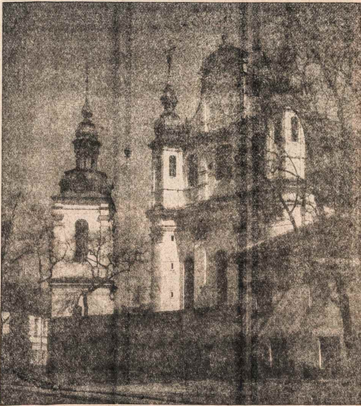
SV. MYKOLO bažnyčia Vilniuje. Vytauto Augustino Lietuvos vaizdų albumas — geriausia dovana Kalėdom visiems — saviem ir svetimiem. Tekstai lietuvių ir anglų kalba. Išleido Ateitis. Gaunama Ateities administracijoje, 916 Willoughby Ave. Brooklyn 11, N. Y. Nepavėluokite užsisakyti. Kaina 6 dol.

Choro pobūvis įvyko lapkričio 26, parapijos svetainėje. Po įvairių pasisakymų ir diskusijų nutarta visu rūpestingumu lankyti dainavimo repetitijas, kurios bus kas antrą ir ketvirtą mėnesio pirmadienį 7 val. 30 min. vakare, mokyklos patalpose. Kiekviena choristė, atėjusi į repetitiją, sumoka kasininkei 10 centų.