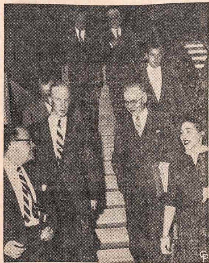
VENGRŲ DELEGACIJA protestuodama išeina iš Jungtinių Tautų visumos posėdžio.

Nėra abejonės, kad sukilimas Vengrijoje sekamas Lietuvoje su didžiausiu dėmesiu, nes Lietuvoje yra tas pats laisvės troškimas, o vergija didesnė. Tačiau šiuo tarpu nėra pagrindo galvoti apie sukilimo reiškinį Lietuvoje. Sniečkaus kalba reiškia Maskvos nepasitenkinimą lietuvių noru bent kultūrinėje srityje turėti daugiau laisvės. Maskva stengiasi diskriminuoti Lietuvoje lietuvių tautinį elementą ir infiltruoti rusišką; vadovėliai tik vertimai iš rusų kalbos, istaigose rusai brukami lietuvių vietoje, tarnybam ir butam rusai gauna pirmenybę. Po Stalino mirties lietuviams galėjo šiek tiek daugiau išleisti bent lietuviškų veikalų. Tai buvo jų tautinis ir kultūrinis laimėjimas. Už tat Maskvos pakalimas Sniečkus dabar ir sukilo pirmiausia prieš kultūrininkus, mokslininkus, mokytojus, studentus.