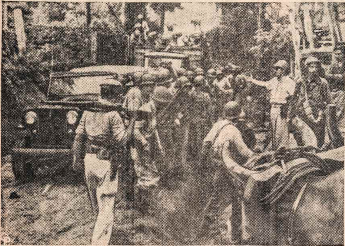
KUBOS kariuomenė žygiuoja prieš sukilėlius.