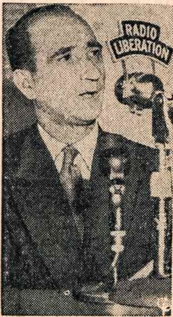
JOSEPH KOVAGO, kuris Vengrijos sukilimo metu buvo Budapešto burmistras, atvykęs

XLII NR. 7 910 WILLOUGHBY AVE. PENKTADIENIS - FRIDAY SAUSIO - JANUARY 25, 1957 M. Administracija GLenmore 2-6916 10 CENTŲ BROOKLYN 21, N. Y. Redakcija GLenmore 5-7281