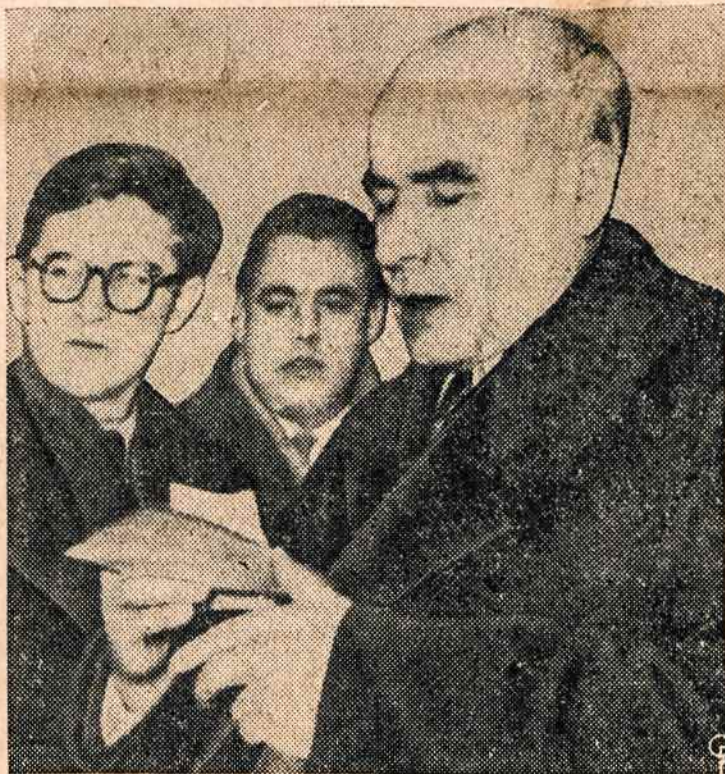
W. GOMULKA, laimėjęs rinkimus Lenkijoje, žada valyti pačią partiją.

Schleswig - Hollsteino valstybėje jau 11 savaičių streikuoja 38 imonių, daugiausia laivų statyklų, darbininkai. Reikalauja mokėti už atostogas, atostogas prailginti ir mokėti atlyginimą už darbą ligos atveju. Streikas gresia išsiplėsti ir virsti dideliu ginklu rinkiminėje kovoje. Inicijatyvą jam baigti imasi Adenauerio vyriausybė.