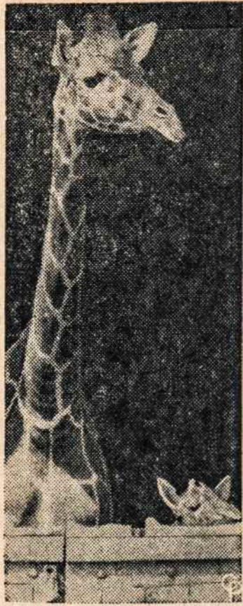
LONDONE mažas žirafos karklas dar trumpas, bet greitai ir ji susilygins su savo motina.

— Bet tai ne klausimas. Tokių aiškių dalykų nereikia nė rašyti, — sakė vedėjas.