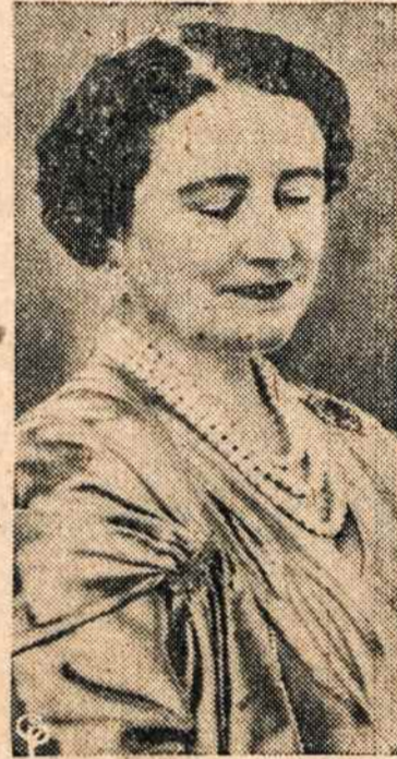
ANGLIJOS karalienės motina Elzbieta šventė savo 57 metų gimtadienį. Jos įtaka karališkuose rūmuose tebėra stipri.

• Afrikos katalikų vyskupai bendrai išleido ganytojišką laišką, kuriame katalikams įsakoma neklausti vyriausybės įsakymo, draudžiančio bažnyčiose sueti drauge baltiem ir juodiem. "Katalikų bažnyčios turi būti visiem atviros" — sakoma laiške.