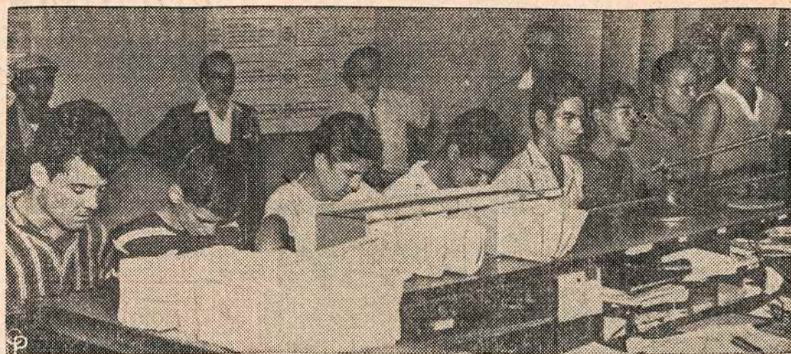
NEW YORKE gauja jaunuolių nužudė 15 metų berniuką ir vieną sužadė. Iš jų aštuoniems graso mirties bausmė.