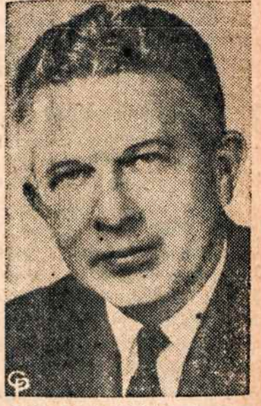
NEIL H. McELROY, pirmininkas didelės muilo korporacijos Amerikoje, vienas iš žymesniųjų pramonininkų (Cincinnati, Ohio), lankėsi Washingtone. Jis norima skirti gynybos sekretorium vietooje Ch. E. Wilsono.