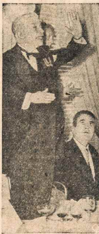
NEBYLYS mostais sako prakalbą 400 kūrėjų — nebylių suvažinime Romoje.

Tokis buvo tos "kolaboracijos" likimas. (B. d.).