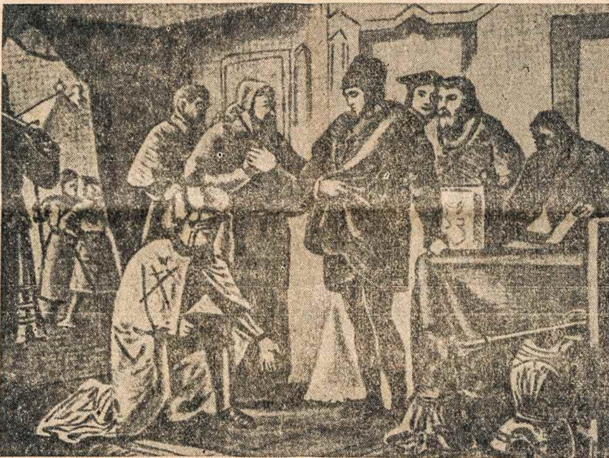
PASVALY magistras Fuerstenbergas atsiprašo Zigmantą Augustą.

Baltijos marių Maskva tada dar nesiekė, bet į ją seniai dairėsi, kai sau palenkė Naugardo ir Pskovo pirklių miestus. Šie miestai savo prekes plukdė upėmis, kurias kontroliavo (Nukelta į 4 psl.)