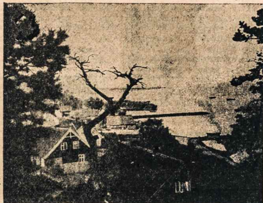
KURŠIŲ marios prie Nidos.

Keleivis, Mažosios Lietuvos lietuvių laikraštis, leidžiamas Vokietijoje, kovo-gegužės nr. atkreipė dėmesį į "Tiesos" pasisakymą dėl Kuršių marių priskyrimo prie Lietuvos.