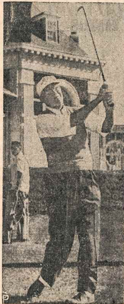
PREZ. D. EISENHOWERIS, atostogaujantis Newport, R. I., muša golfa.

Pereita sekmadieni LSK pradėjo savo 1957-58 metų sezoną draugiškoms rungtynėms su pereitų metų lygos meistrė N. Y. Hungarians.