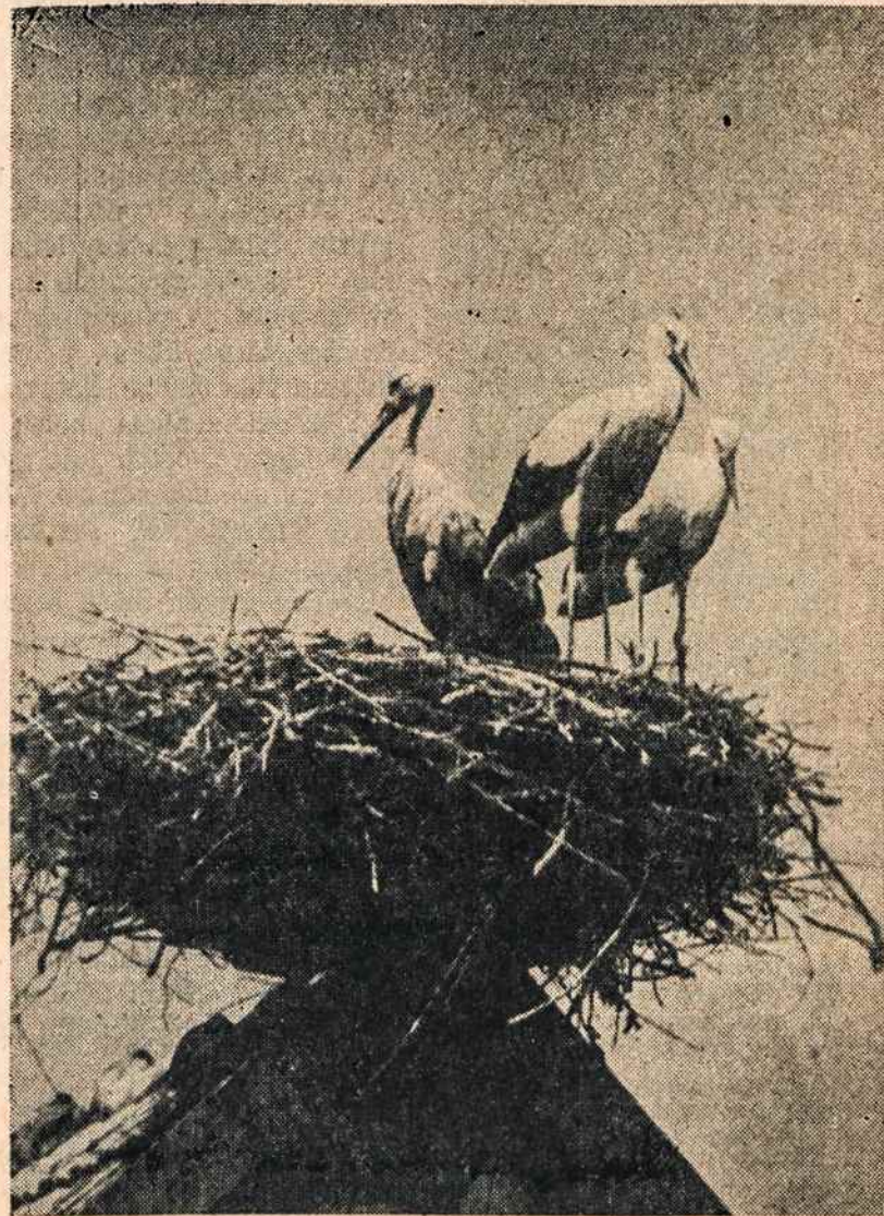
GANDRAI tėviskėje buriojasi išskirti. Ar dar juos pameni?