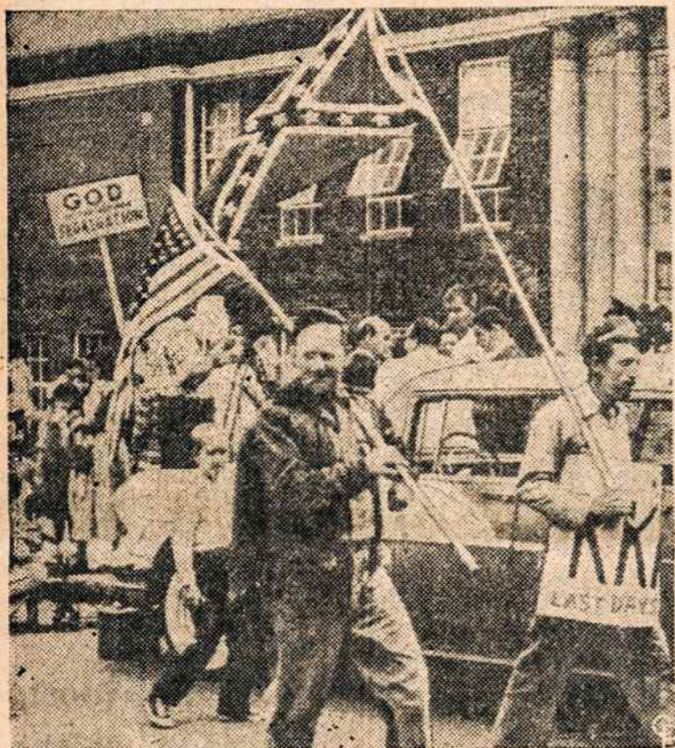
NASHVILLE, Tenn., baltieji demonstruoja už rasų segregaciją, kurios autorius esąs Dievas.

"Kuršių mariose turi būti vienas šeimnininkas! Mūsų manymu, Kuršių marias reikėtų pavesti Tarybų Lietuvai".