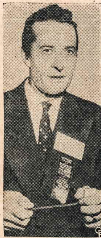
DR. H. LABORIT, prancūzas chirurgas, atvykęs į JAV ir Kanados chirurgų kongresu, spaudos atstovam aiškina, kad jo anestezijos operacijoms pasirodė labai sėkminga.