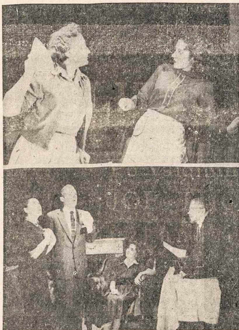
VAIZDAI IS "PAZADĖTOSIOS ŽEMĖS"