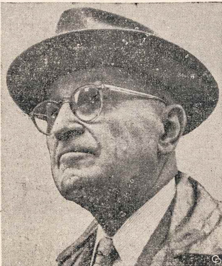
HARRY S. TRUMAN atvyko į New Yorką rinkimų reikalais.