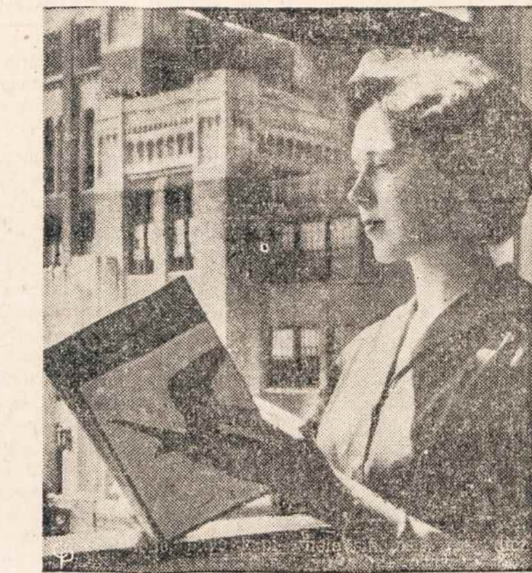
LITTLE ROCK aukštesnėje mokykloje anglų k. mokytoja tuščioje klasėje.

Per karą ir po karo nebuvo kam rūpintis bažnyčios atstatymu. Senasis Lazdijų parapijos klebonas buvo išvežtas, o naujo nepaskyrė. Taip ir buvome apie metus laiko be klebono. Sekmadieniais žmonės susirinkdavo į bažnyčią, užsidegdavo žva-