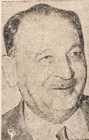
SAMI ES-SOHL, Libano ministras pirmininkas iš Beirut slaptai išvyko į Turkiją.

— Prezidentas Eisenhoweris leidęs Adams, savo asistentui, pačiam apsispręsti, ar pasiduoti respublikonų vedų spaudimui ir pasitraukti.