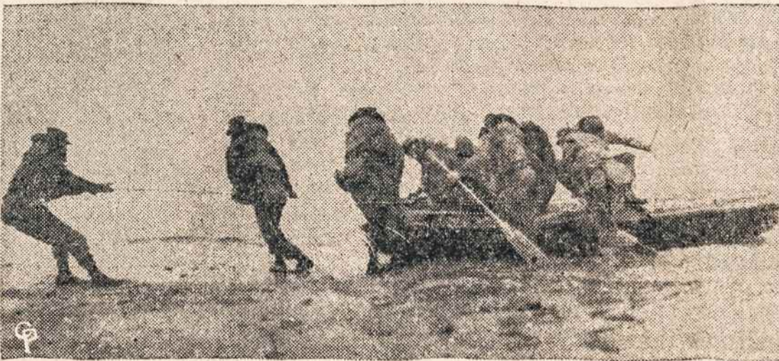
AMERIKIEČIAI kėliais į salą, tačiau ne Quemoy, o Rocky Point, L.I., N.Y.

Anglijai rūpi ir Jordanijos reikalas. Ji nor derintis su Amerikos nusistatymu.