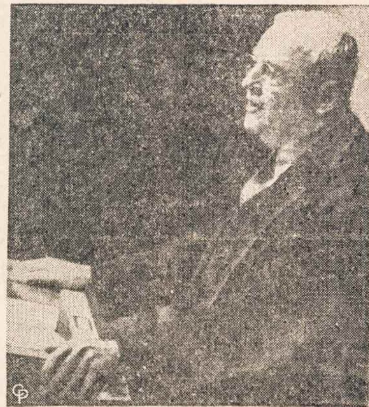
VALST. SEKR. J. F. DULLES Jungt. Tautose pareiškė, kad Varšuvos derybom nepavykus, Amerika siūlys kom. Kinijos agresijos klausimą perduoti Jungt. Tautom.

— New Yorko valstybėje bendrųjų skaičius rugsėjo pirmo pusę vėl padidėjo 2,000. Per aštuonias savaites buvo palaipsniui kritę.