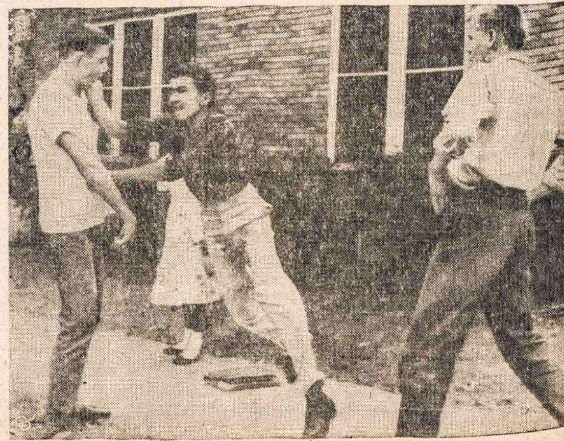
LITTLE ROCK kartais apsistumdo juodieji ir baltieji mokiniai.