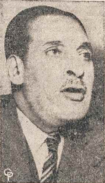
FERHAT ABBAS, 59 metų, paskelbtas Alžiro laikinės vyriausybės pirmininku.

Arabų pasaulyje nauja tai, kad Alžiro "išlaisvinimo frontas" rugsėjo 19 paskelbė Kaire Alžiro laikinę vyriausybę. Ją tuoju pripažino Jungtinė Arabų Valstybė, Irakas, Marokas, Tunisas.