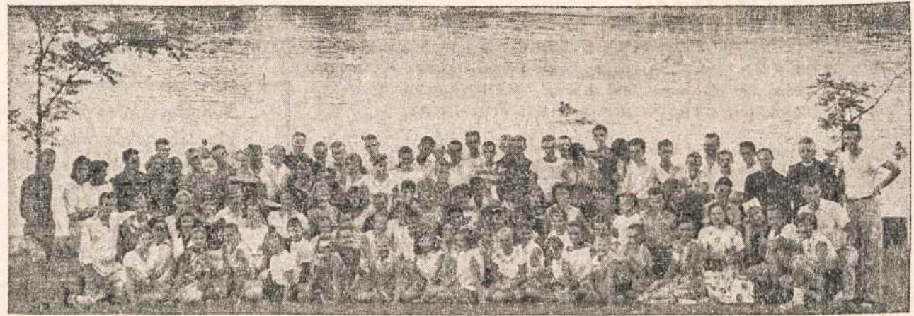
STOVYKLAUTOJAI prie Spyglio.

kurios pagrindai glūdi Evangelijos mokslo dėsnuose. Mes tad kviečiame lietuviškąją jaunimą gilintis į tikrosios demokratijos principus ir dėsnius, juos studijuoti, suprasti ir gyvendinti politiniame, visuomeniniame, kultūriniame, socialiniame, ekonominiame gyvenime.