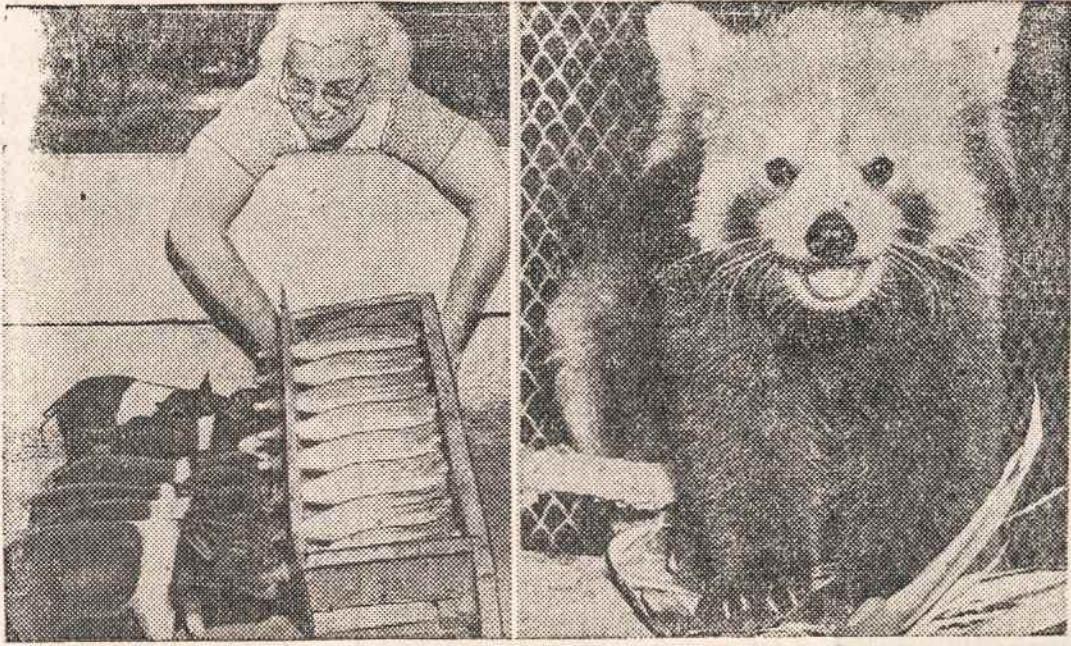
ISRADINGA šeiminkė, kai jos klaučė atsisakė savo paršus maitinti (Memphis, Tenn.). Dešinėje: jauniklė panda iš Himalajų kalnų atvežta į Paryžiaus zoologijos sodą.