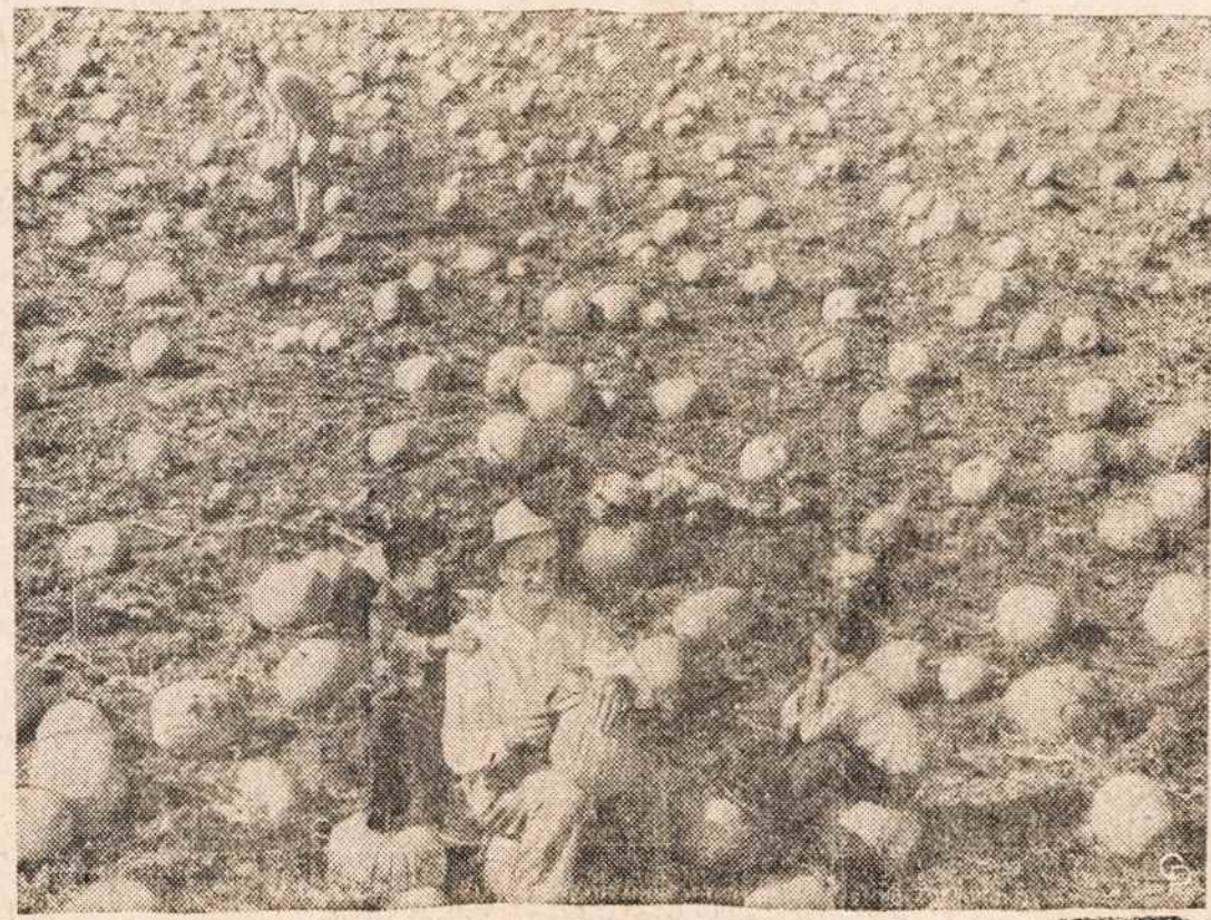
PUMPKINAI, kurie "halloweenose" virst baldyklėmis. Vaizdas iš vienos farmos prie Chicagos, Ill.