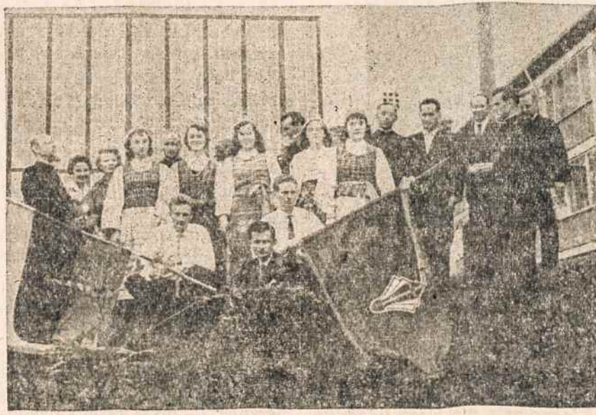
VOKIETIJOS ateitininkai Koenigsteine įvykusiame kongrese „Bažnyčia priešpaudoje“ su savo vėliava. Klišė Ateities.

Gausiose demokratijos aptarimuose pats trumpiausias ir pats išsamiausias yra vieno prancūzo aptarimas: demokratija yra teisingumas lygybėje, meilė brolybėje ir visų pagerbimas laisvėje. Gyvename šiandien demokratijos žydėjimo ir kartu jos krizės metą. Tikrosios demokratijos vardas ir veidas yra dažnai iškraipomas ir suniekinamas. Demokratijos vardu šiandien nevienas vadina anarchiją, diktatūrą, vergiją, rasizmą, imperializmą ir t.t. Iš demokratijos turinio nevienas išjungia autoritetą, teisingumą, moralės principus ir jų vieton gyvendina nihilizmo, neribotos laisvės, iškreipto teisingumo koncepcijas. Todėl gausu pseudo-demokratijų. To akivaizdoje mūsų žvilgsnis turi būti kreipiamas į tikrąją demokratiją, kuri yra išaugusi iš evangelinės išminties ir meilės gelmių ir