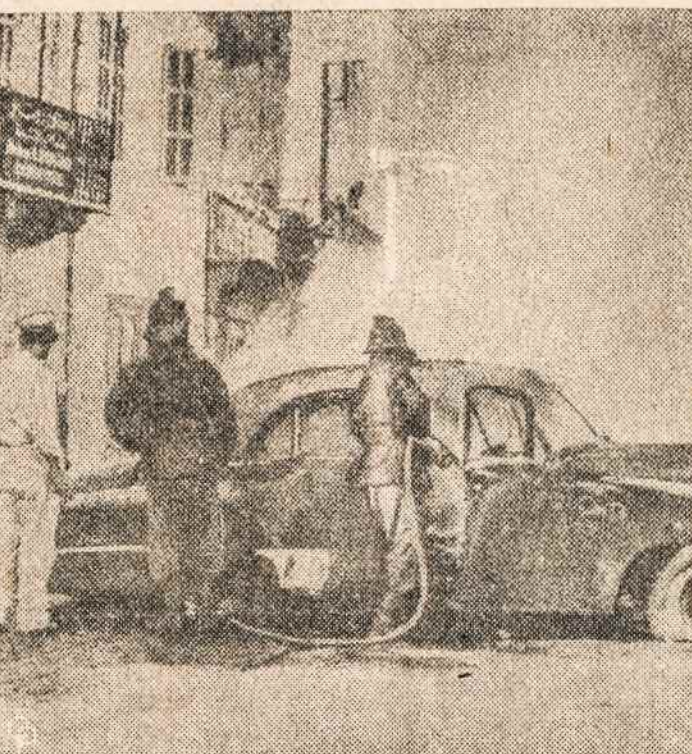
LIBANE. Beiruto mieste, gaisrininko gesinamas padegtas automobilis. Gyventojai nepatenkinti, kad naujas prezidentas visą valdžią pavedė sukilėliams.

Tartasi dėl plano įsteigti Pabaltijo kraštų studijų institutą, kuris tyrinėtų dabarties padėtį ir įvykius okupuotose Pabaltijo kraštuose. (Jau iš seniau veikia Pabaltijo tyrinėjimo institutas daugiau — tyrinėja Pabaltijo tautų praeitį). Numatoma, kad šitoks studijų institutas galėtų veikti sutartinais su atitinkamomis vokiečių institucijomis.