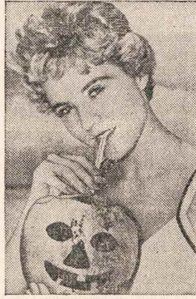
KOKUSO riešutas tinka ne tik atsigaivinti skaniu gėralu, bet ir pasidaryti baidyklę "hallo-weenoms".

DAFB I Lygos 1958/59 metų pirmajame rate Lietuvos Sporto Klubų futbolo komanda dar turės tokias rungtynes: Spalių 5 LSK: Kollsmann New Farmers Oval Spalių 12 LSK: Greek-Americans New Farmers Oval Spalių 19 Stanford United: LSK Stanforde, Conn. Spalių 26 SC Garfield-Passaic: LSK Passaice, N. J. Lapkričio 2 LSK: Hota New Farmers Oval Lapkričio 9 Minerva: LSK Franklin Square L. I. Lapkričio 16 LSK: French SC New Farmers Oval Lapkričio 23 DSC Brooklyn: LSK New Farmers Oval Lapkričio 30 Blue Star: LSK Kiekvienose rungtynėse priešaismį žaidžia tų pačių klubų rezervinės komandos Jauniai pirmenybių sezoną pradės gruodžio mėn., mokymų varžyboms pasibaigus. Atletas