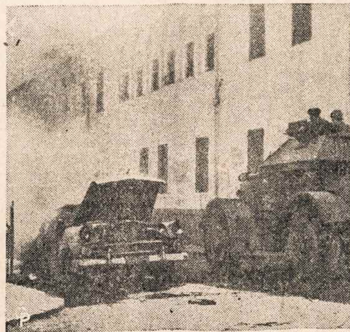
LIBANO SOSTINES GATVESE tankai, taxi padegtas. Riausės paskyrus sukilėlių vadą min. pirmininku apmokėtos 30 gyvybių.

Siais metais dar numatyti PJT Seimo pilnates posėdžiai spalio 23 ir 24 ir gruodžio 10, 11 ir 12 dienomis.