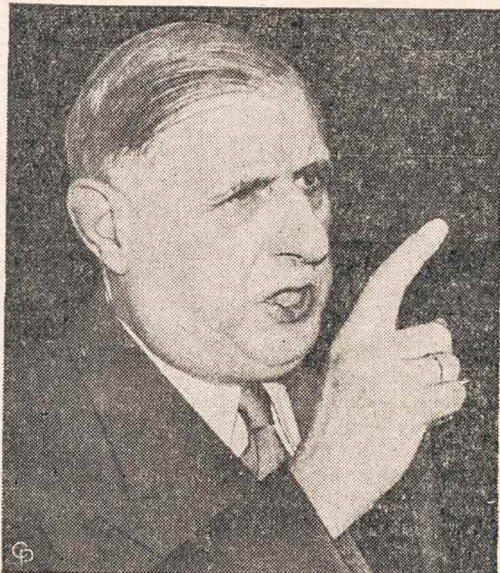
CHARLES DE GAULLE