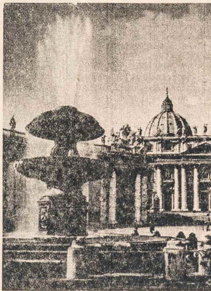
FONTANAS šv. Petro bazilikos aikštėje.