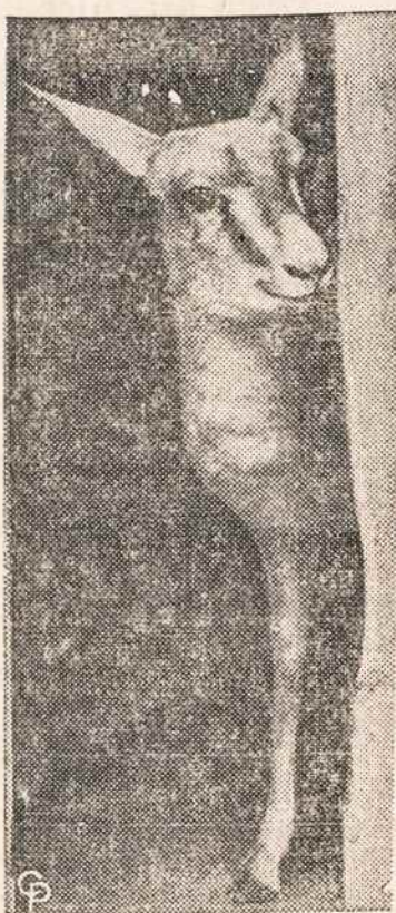
BAUGU NELAISVES. Pagautas gazelės pirmas žvilgsnis į Londono zoologijos sodą.