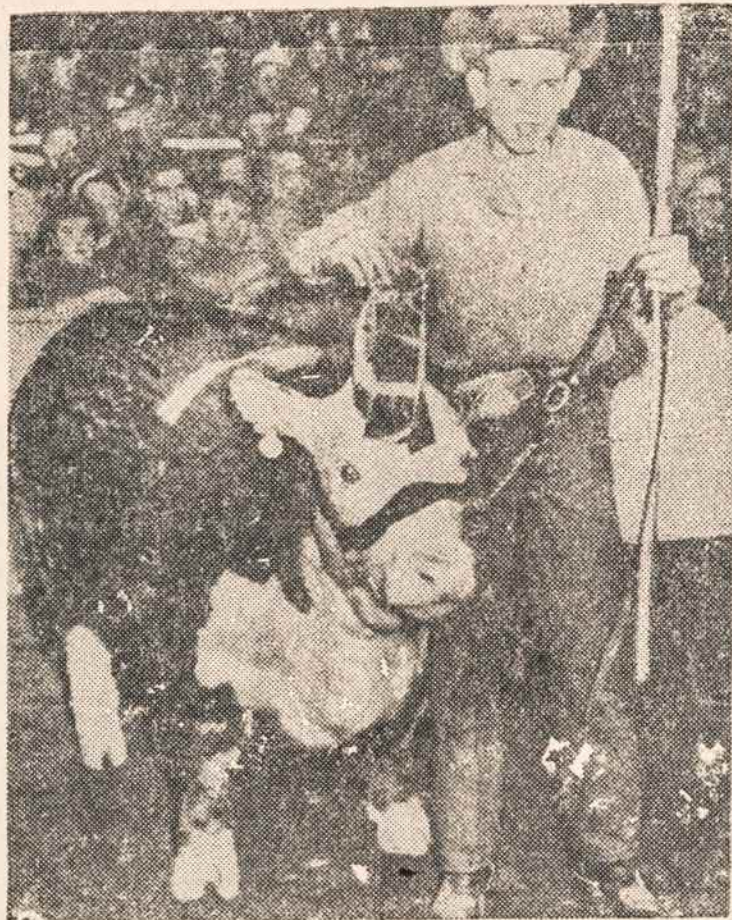
CHICAGOS gyvulių mugėje pirmąją vietą laimėjo jautis iš Lubbock, Texas.

Kas norėtų skelbtis Parbininke, prašomas skambinti GLenmore 5-7281