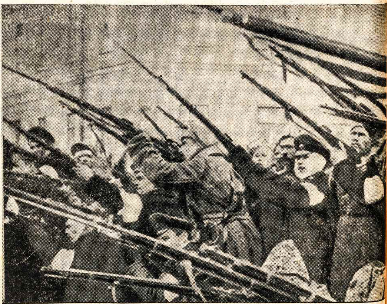
PERVERSMAS Petrapilyje 1917.

(Kitam numeryje: Yra čia toksai ponas Leninas...)