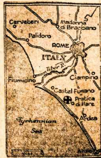
LAVINIUM Ilekanos rastos šioj vietoj.

— Sovietai paskelbė, kad Dagestane viena pora atšventė 110 metų sutuoktinių sukaktį. Vyrai yra 136 metų, moteris 131.