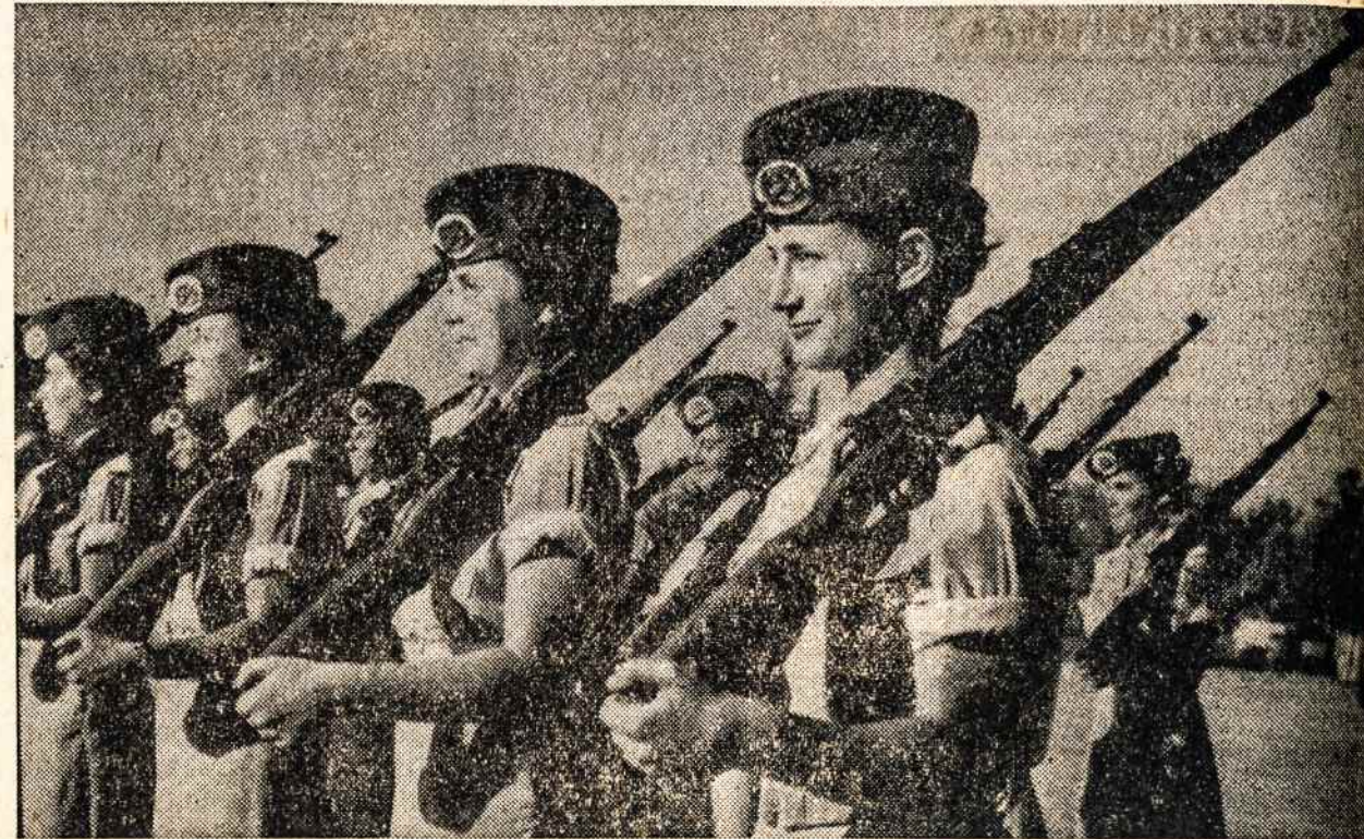
IZRAELIO mergaitės po šautuvu. Pirmoji iš dešinės (priekyje) Yael Dayan, pagarsėjusi savo autobiografinė knyga.

PERSIJA vis daugiau modernėja. Taip rodo ir šis persaitės paveikslas. Ji sekretoriauja vienai pramonės įstaigai su savo telefono aparatais ir krūva popierių atrodo visai taip, kaip sekretorė amerikietė.