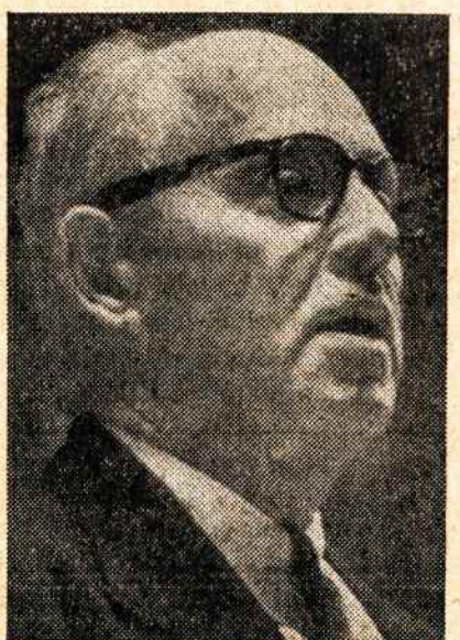
MEANY, unijų federacijos prezidentas. San Francisco pakartotojai: Chruščiovas yra pavojingasis už Staliną.

Čia ji pertraukia Chruščiovą, ir bendrame kelių asmenų pasikalbėjime negalima išskirti, kas ką sako. Pagaliau vėl Reuther: Kiekvieną kartą, kai mes iškeliamo supykusią, pirminkas supyksta. (bus daugiau)