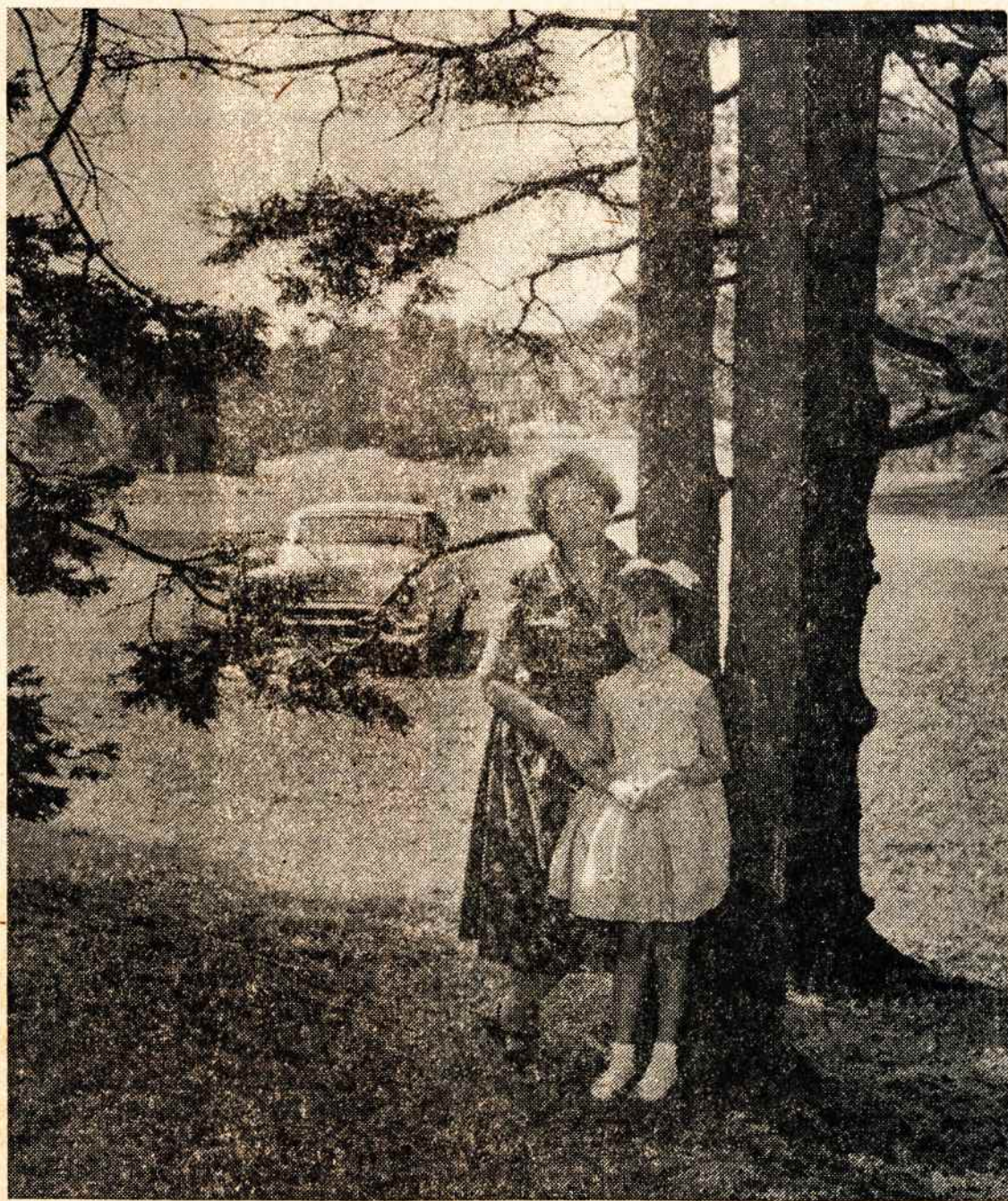
PASKUTINIS žvilgsnis į atostogų šalį Kennebunkport, Me.