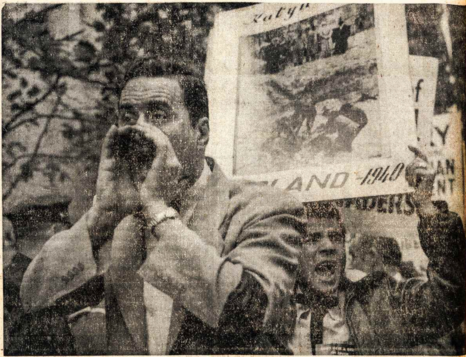
PAVERGTŲ demonstracija prieš Chruščiovą New Yorke.

— Kongreso komisija rugsėjo 23 pradėjo apklausipėti dėl paauglių nusikaltimų.