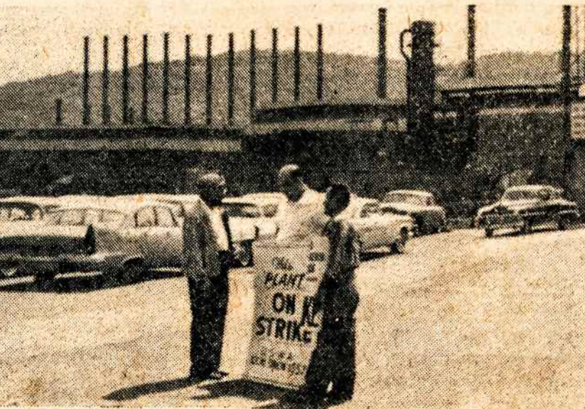
PLIENO FABRIKAI nerūksta jau trečias mėnuo, ir galo dar nėmatyti.

"Mes nesuitaikome su milijonų pavergimu ir nežiūrėsime į tą pavergimą kaip į nuolatinį reiškinį. Mūsų politika komunistinių satelių atžvilgiu yra emancipacija — pasiekiamas ne jėga, bet labiausiai laisvės apeliacija į kiekvieno žmogaus mintis. Emancipacijai pasiekti mūsų ginklai yra ne kariniai, bet ideologiniai, psichologiniai, politiniai, diplomatiniai. Kad šių nekarinių jėgų veikimas būtų efektingas, mūsų karinės jėgos turi būti pakankamos komunistinei ginkluotai grėsmei neutralizuoti".