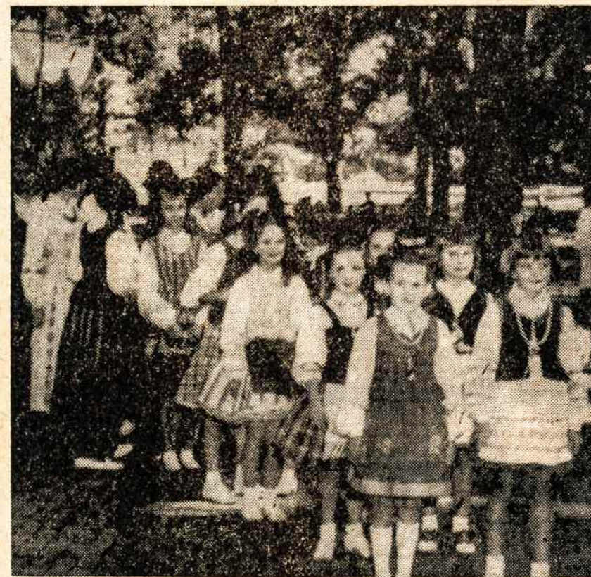
LIETUVAITES protesto eisenoje Bostone.

Eisena, kuriai vadovavo šv. Petro parapijos CYO benas, tyliame susikaupime nuėjo į šv. Kryžiaus katedrą. Čia kardinolas R. Cushingas visus sutiko prie katedros durų, o kai visi suklauptę katedroje, jis atkalbėjo rožančių ir pasakė pamokslą, kuriame visus ragino nepamiršti savo gimtojo krašto ir prašyti Amerikos prezidentą ir Jungtines Tautas nepamiršti pavergtųjų kraštų ir jų išlaisvinimo idėją palaikyti gyvą.