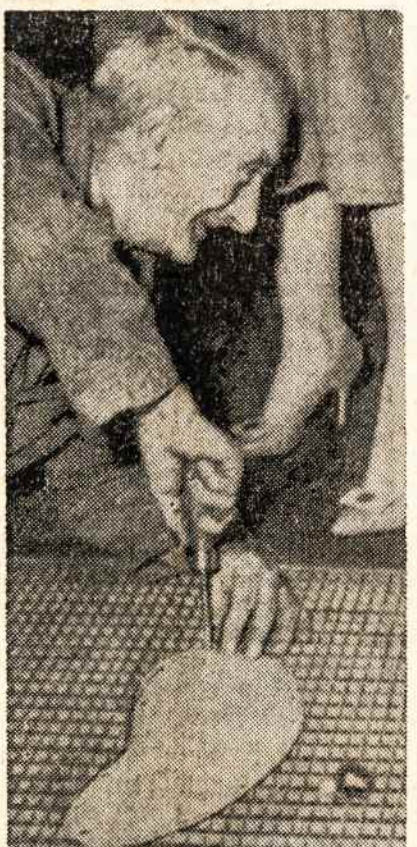
VOKIETIJOJE ant saligatvių grotelių pritaisioną plokštės, kad eidamas moterys nenusiūzėtų batus kv. kuily.

Kiek Sovietų valdomi plotai yra tušti, kiek jie yra apžioję dideles teritorijas, rodo jų gyventojų tirštumo palyginimas su Europos vakarų valstybėmis: Prancūzijoje vienai kv. myliai tenka 205.8, Vengrijoje 275.9, Italijoje 415.5, Vokietijoje 534.2, Belgijoje 759.9. (Lietuvoje tas pats almanachas