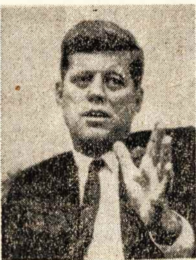
J. PROVOKAVO. Sen. Kennedy kandidatas į prezidentus.

Reikalas populiariesnis už viršūnių konferenciją. — Ne taip baisu ty, kurie gyvena, bet kurie dar negimė. — Kad alkanos rankos nesiektų dar tuščių, negyvenamų plotų, sugalvojom gimimų kontrolę. — Ko bijosi Sovietų Rusija ir ko baiminasi amerikiečiai? — Pirmoji pagarsėjo žudydama suaugusius, antrajai norima įkalbėti, kad išgarsėtų žudydama negimusius.