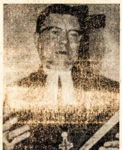
JIS PROVOKAVO. Episkopas Pike

Protestantų bažnyčių pasaulinė taryba pritarė gimimų kontrolei. Kiti nuėjo dar toliau — siūlė, kad Amerika pagelbėtų kitiems kraštams jų gyventojų