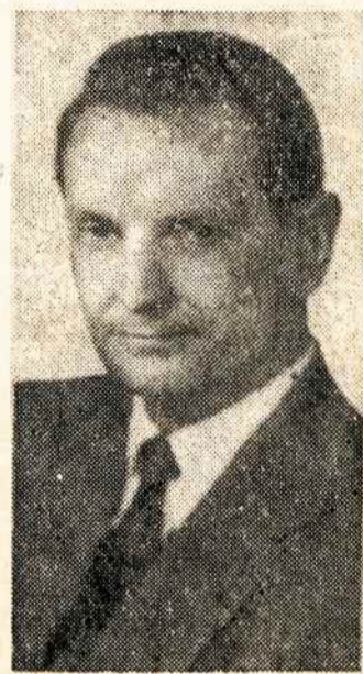
LAURENCE S. ROCKEFELLER, pagrindinis Brolių Rockefellerių fondo raportu autorius.

Raportas sako, kad kom. Kinija yra jėga, kuri nedings, jei ją išmesime iš savo minčių. Ją reikia pažinti, nors tuo ne siūloma jos diplomatiškai pripažinti ar priimti į Jungtines Tautas. Amerika turi nieko nedaryti, kas labiau sublokštų komunistinę Kiniją ir Sovietų Sąjungą; jų skirtingi interesai gali išaugti.