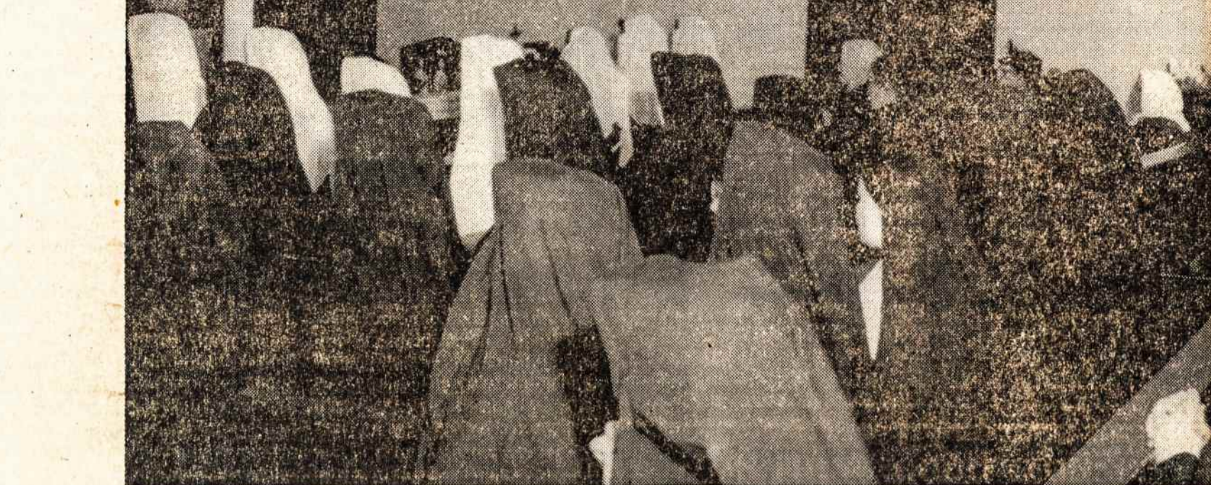
NUKRYŽIUOTOJO Jėzaus seserys tebesimeldžia kambaryje.