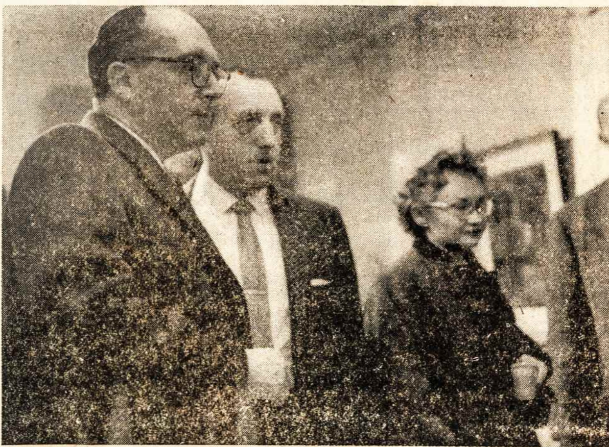
PUBLIKA apžiūri dail. V. K. Jonyno parodą, kuri atidaryta gruodžio 6 Almus galerijoje Great Necke.