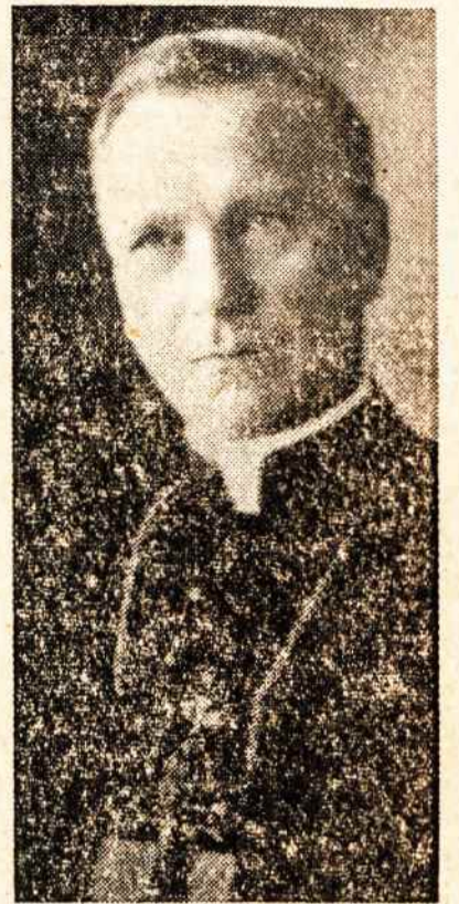
ARKIVYSKUPAS METROPOLITAS J. SKVIRECKAS