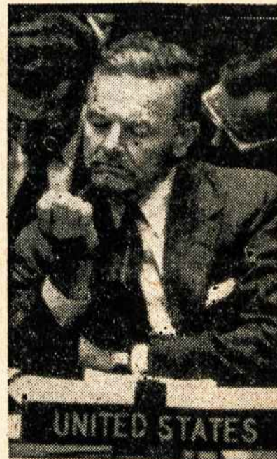
KOVOJE BENT ŽODŽIAIS: Henry Cabot Lodge Jr.