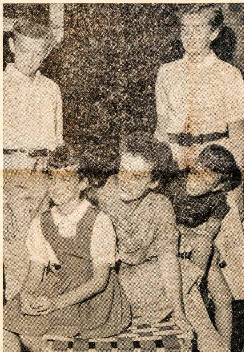
BANG-JENSENO žmona su dviem sūnum ir dviem dukterim; atvaizde trūksta mažiausios dukrelės. Visi gyvena Great Neck, L. I.

Su pasitenkinimu buvo katalikų spaudoj iškeltas Aschaffenburgio miesto burmistro ges-