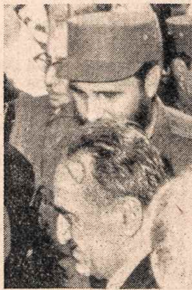
PIRKLYS IR REVOLIUCIONIERIUS — Mikojanas ir Castro.

doneziją, kad ją labiau priveržtų prie Maskvos, ne prie Kinijos.