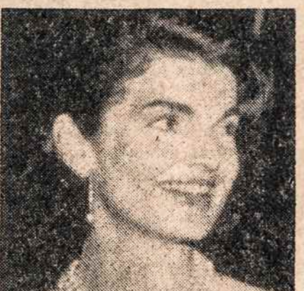
MRS. JOHN KENNEDY Jacqueline Bouvier mokėsi Paryžiuje, buvo fotografė viename Washingtono laikrašty, ištėkėjo 1953, turi 2 metų dukterį. Dabar yra 29 — jauniausia varžovė į Baltuosius Rūmus.

— Amerikos Blue Cross nori pakelti šiais metais mokesčius už liginines draudimą 30-35 procentais. Jei bus pakelta, tai kolektyvinis draudimas per darbovietę vienam asmeniui iš 2.61 dol. pakils iki 3.39 mėnesiui, šeimai iš 6.60 iki 8.58. Draudimas ne per darbovietę asmeniui bus 4.39, šeimai 10.10.