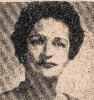
MRS. LYDON JOHNSON Claudia Taylor, ištėkėjo 1934, turi du sūnus 15 ir 12 metų, gyvena pasidalidamas tarp farmos Texas ir Washingtono Dabar 47 metų.