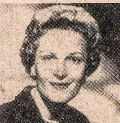
MRS. RICHARD NIXON Patricia Ryan buvo mokytoja Kalifornijoje, ištėkėjo 1940. Turi 14 ir 11 metų dukteris. Dabar 46 metų.

Čilėj vasario 7 nuo bėgių nuėjo traukinys. Žuvo 25.