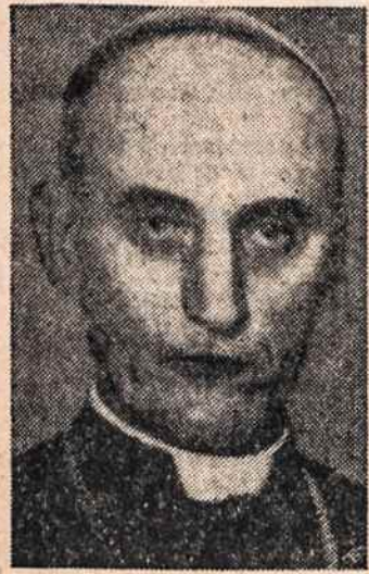
ALOIZAS STEPINAC mirė 61. metų.

XLV NR. 12. SECOND-CLASS Postage paid at Brooklyn, N. Y. PENKTADIENIS - FRIDAY, VASARIO - FEBRUARY 12, 1960 910 WILLOUGHBY AVE., BROOKLYN 21, N. Y. 10 CENTU