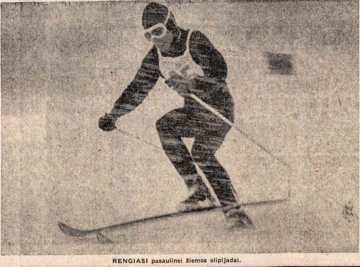
RENGIASI pasaulinei žiemos olimpiadai.