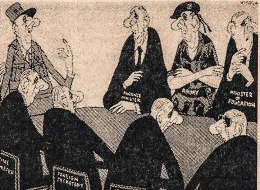
VIENINGA VALDŽIA. Taip Londonio Evening Standard atvaizdavo de Gaulle suteiktus pilnus įgaliojimus.

Prezidentas į raketų centrą Prez. Eisenhoweris vasario