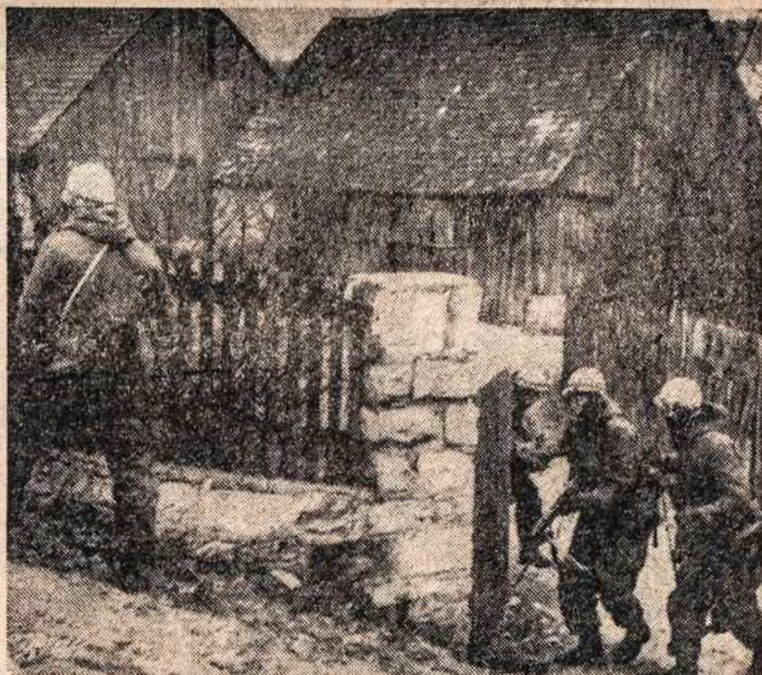
ZVALGYBOJE. Bavarijoje, Vokietijoje, buvo Amerikos ir Vokietijos kariuomenių bendri manevrai. Dalyvavo 60,000 kariuomenės, 11,000 autovežimiu. Manevrai pasisekė, tačiau niekada tiek ūkininkams nebuvę pridaryta nuostolių kaip dabar — už 6 mil. markių.

— Sovietai raketų bazę rengia prie Sverdlovsko Urale.