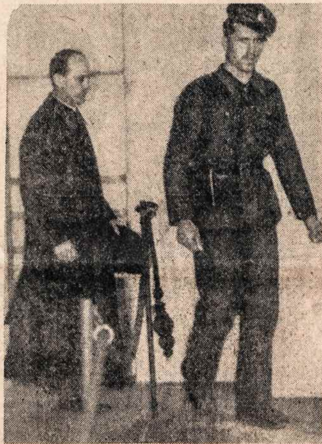
TEISME 1946. Sargybinis atvedė arkivyskupą Stepinac į teismą.

Apie tokius samprotavimus informuodamas, C. L. Sulzberger (NYT) kelia klausimą: ar Chruščiovas pajėgs apmulkinti abejus — mus ir Mao?