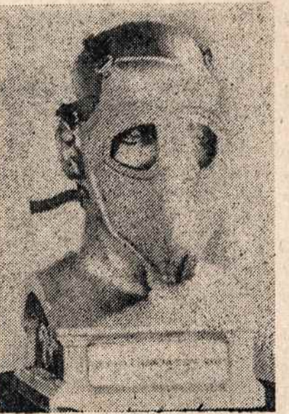
AMERIKOJE pagaminta kaukė nuo atominių kritulių, cheminių dujų. Liepos mėn. jos 24,000 bus išmėginti manevrus paskiau numatoma masiškai gaminti civiliniam asmenim po 2-3 dol.

Katalikai veikėjai daugiausia susitelkę demokratuose. Demokratų tautinio komiteto pirmininkas Paul Butler — katalikas, gubernatoriai Pensilvanijoje, Ohio, Washingtono ir Kalifornijoje — katalikai, majorai Chicagoje, New Yorke — katalikai.