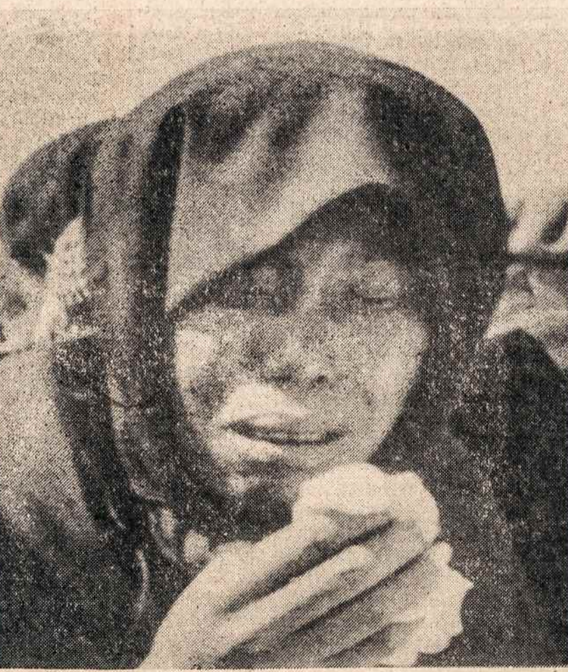
MOTINOS VISUR TOKIOS PAT. Pietų Afrikoje vykdant Verwoerd politiką nušauti 72 negrai. Čia vieno iš žuvusių motina.