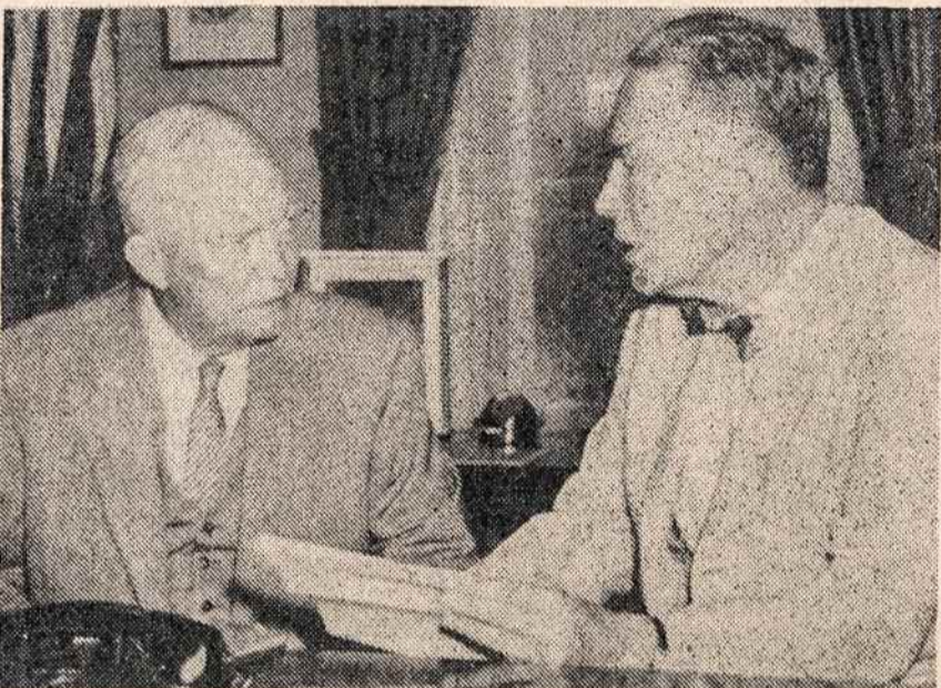
PO VIENERIŲ METŲ. Perna balandžio 18, vietoj pasitraukusio Dulles, Herteris paskirtas valstybės sekretorium. Užsienio stebėtojai vertina, kad nuo tada užsienio reikalus tvarko pats Eisenhoweris.

New Yorke eilė respublikonų irgi su panašiu šūkiu išėjo prieš Nixoną. Jie kelia Rockefellerį.