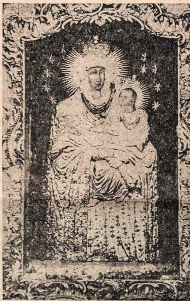
SVČ. MARIJOS stebuklingas paveikslas Šiluvoje.

Nixonas ir religija Nixonas redaktorių susirinkime pareiškė: būtų klausimas dėl kandidato į prezidentus, jei jis būtų be religijos, nes visas Amerikos gyvenimas yra pagrįstas religija ir jos moralės principais. - Amerikiečių žvalgyba įspėjo, kad naujausia komunistų agresija Azijoje gali būti pietų Vietnam.