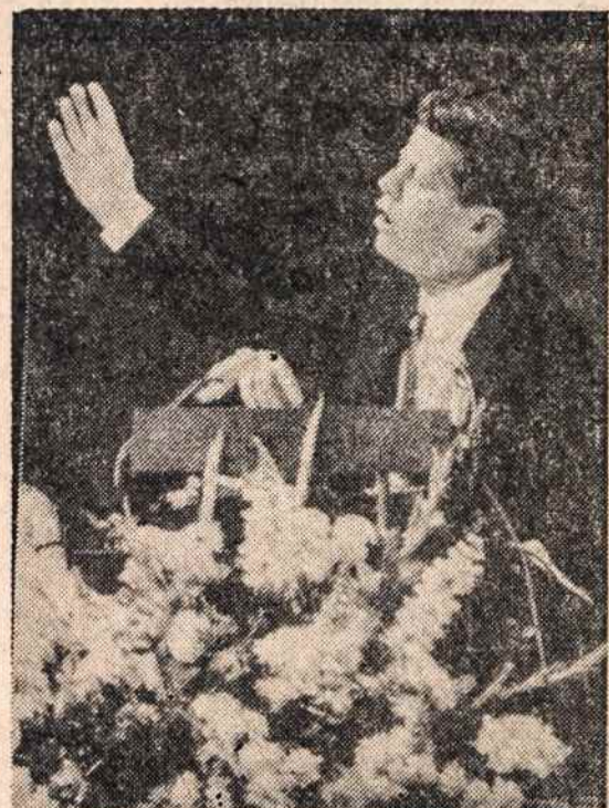
SEN. KENNEDY: Aš nesu kataliku kandidatas.

Aiškinosi sen. Kennedy. Bet jo priešininkai nenori turėti patikėti, nes jie nenori prezidento kataliko, ir kai kurie siūlo jam tenkinti viceprezidento vietą. Kas laimės?