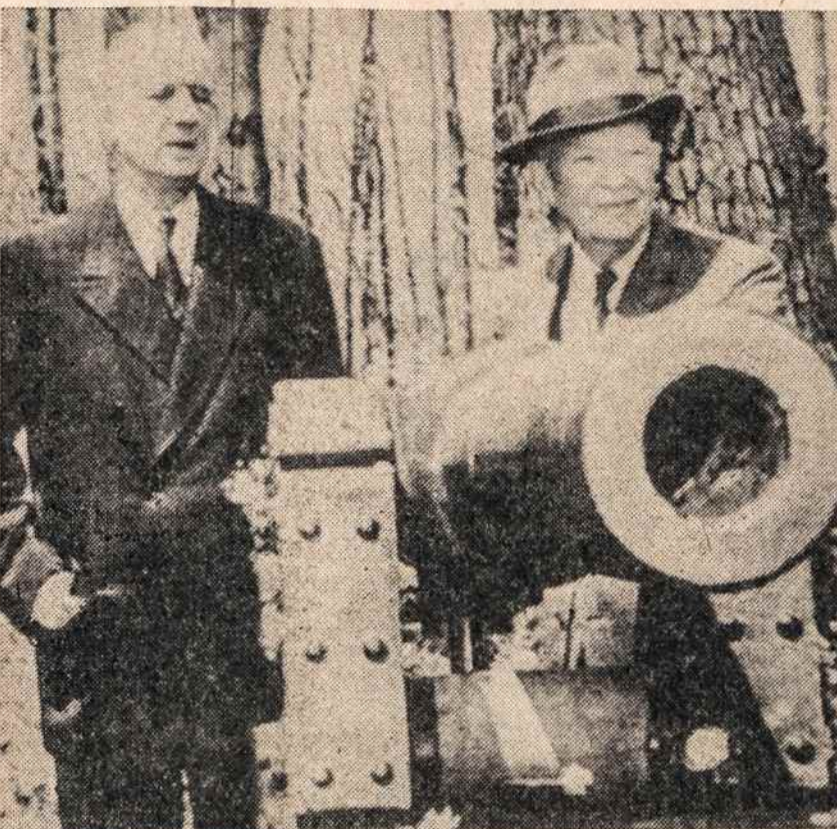
SENI PAS SENUS. Seni kariai — de Gaulle ir Eisenhoweris lanko senus ginklus Getysburge. Washington, New Yorke, San Francisco de Gaulle priimtas triumfaliskai.

Tačiau ar jo pareiškimai randa atgarsio ir pritarimo, galima spręsti ir iš to, kad didžioji spauda juos nutylėjo. Juos randa pakartotus tik tokiam "The Tablet", kuris yra aiškioje kovoje prieš komunizmą (jo tiražas 500.000).