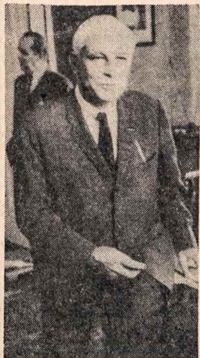
SEN. THOMAS DODD siūlo "paketa"

Senatorius Dodd siūlo Vakarų ofenzivos planą viršūnių konferencijai Paryžiuje