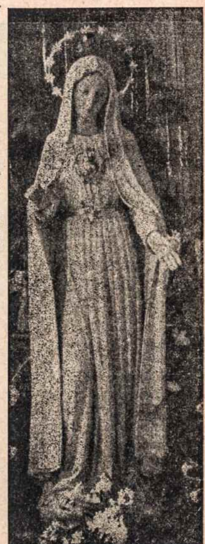
SVENC. MARIJOS statula, kelia-vusi po lietuvių kolonijas laisvame pasaulyje.

Tik maldos, atgailos ir apaštališkos veiklos gyvenimas duos mums teisės save laikyti vertais kovojančios bažnyčios ir mūsų kenčiančios ir kovojančios tautos nariais. Norėkime jais būti ir jais būkime. Žmonių sielų meilė, mūsų pačių tautos kraujas mus teskatina. Dievo palaima ir švenčia-