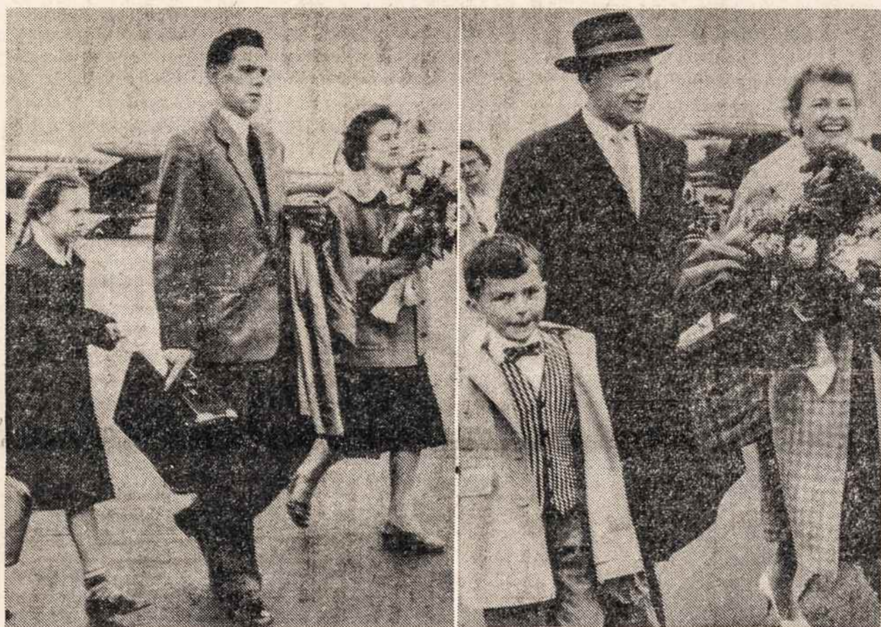
SOVIETŲ šnipai išvažiuoja iš Šveicarijos su savošeimom. Abu jie buvo sovietų atstovybės tarnautojai, kuriuos Šveicarija gegužės mėn. paprašė išvažiuoti.