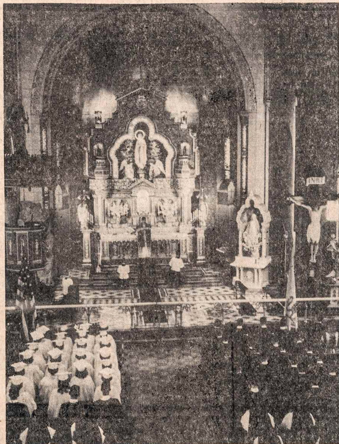
PAMALDOS Apreiškimo parapijos bažnyčioje už baigiant mokslus.