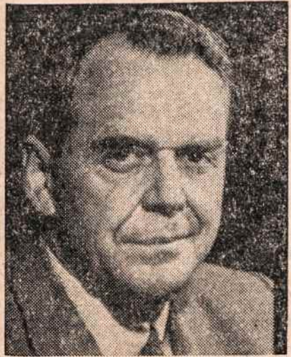
CLARK M. CLIFFORD, Kennedy ryšininkas su Baltaisiais Rūmais, vyriausias Baltųjų Rūmų patarėjas Trumano laikais.

Vienas iš Kennedy kandidatų jau susilaukė stiprios opozicijos dėl Kinijos