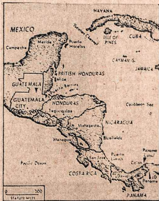
PAZYMETOSE VIETOSE tuo pačiu metu buvo sukilimai ir visi sumalšinti.

Sukilimai Nicaragujoj ir Guatemaloj irgi numalšinti Sukilėliai buvo paėmę du miestus, tačiau vyriausybės kariuomenės stumiami mėgino pasitraukti į Costa Rica pasienį. Sukilėliai buvo susitelkę Costa Ricoje ir iš ten puolė Nicaragua. Costa Ricos kariuomenė taip pat buvo susidūrusi ten su tais sukilėliais. Sakoma, kad tarp sukilėlių buvo ir Castro agentų. Guatemaloje lapkr. 13 buvo