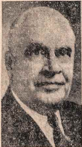
LUTHER H. HODGES, būsimas prekybos sekretorius.

Po rinkimų visuomenė labiausiai domisi, kaip išrinktasis prezidentas sudarys savo vyriausybę. Tuo tarpu jis paskyrė savo įgaliojimų ryšiams su Baltaisiais Rūmais — Clark Clifford, dirbusį prie Trumano.