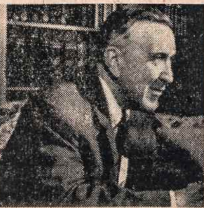
CHESTER BOWLES, buvęs atstovas Indijoje, dabar kandidatas į valstybės sekretorius.

Kalifornijoje lapkričio 12 paleistas satelitas Discoverer XVII. Discoverer, eidamas per ašigali, kelis kartus per dieną eis ir viršum sovietinių satelitų teritorijos. Aviacija atsisakė pasakyti, ar satelitas turi televizijos kameras, kuriomis galima perduoti vaizdus iš perskrendamos teritorijos. Tačiau šitas satelitas, yra iš eilės tokių satelitų, kurie turi smaigali, galimą išmesti pagal ženklą iš žemės. Skiriasi šios rūšies satelitai ir tuo, kad pagal ženklą iš žemės jie gali sustoti ir pakeisti kryptį.