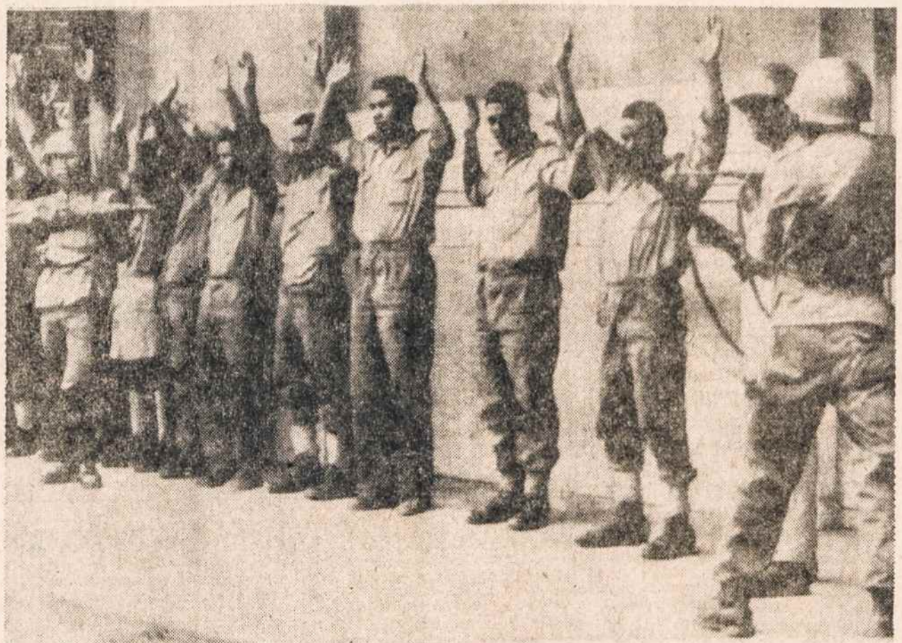
JUNGTINĖS TAUTAS PAĖMĖ NELAISVĘ. Matadi mieste Kongo kariuomenė paėmė nelaisvę sudaniečius. Sudanas paskelbė, kad visai pasitraukia iš Kongo.