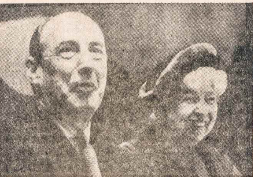
AMERIKOS VIRŠŪNĖS Jungtinėse Tautose: A. Stevensonas ir Mrs. E. Roosevelt.

to priešingus nusistatymus, bet kurios šiuo tarpu sulaukytos senato išikišimo dėka, — prezidentas nieko aiškesnio ir konkretesnio neatsakė.