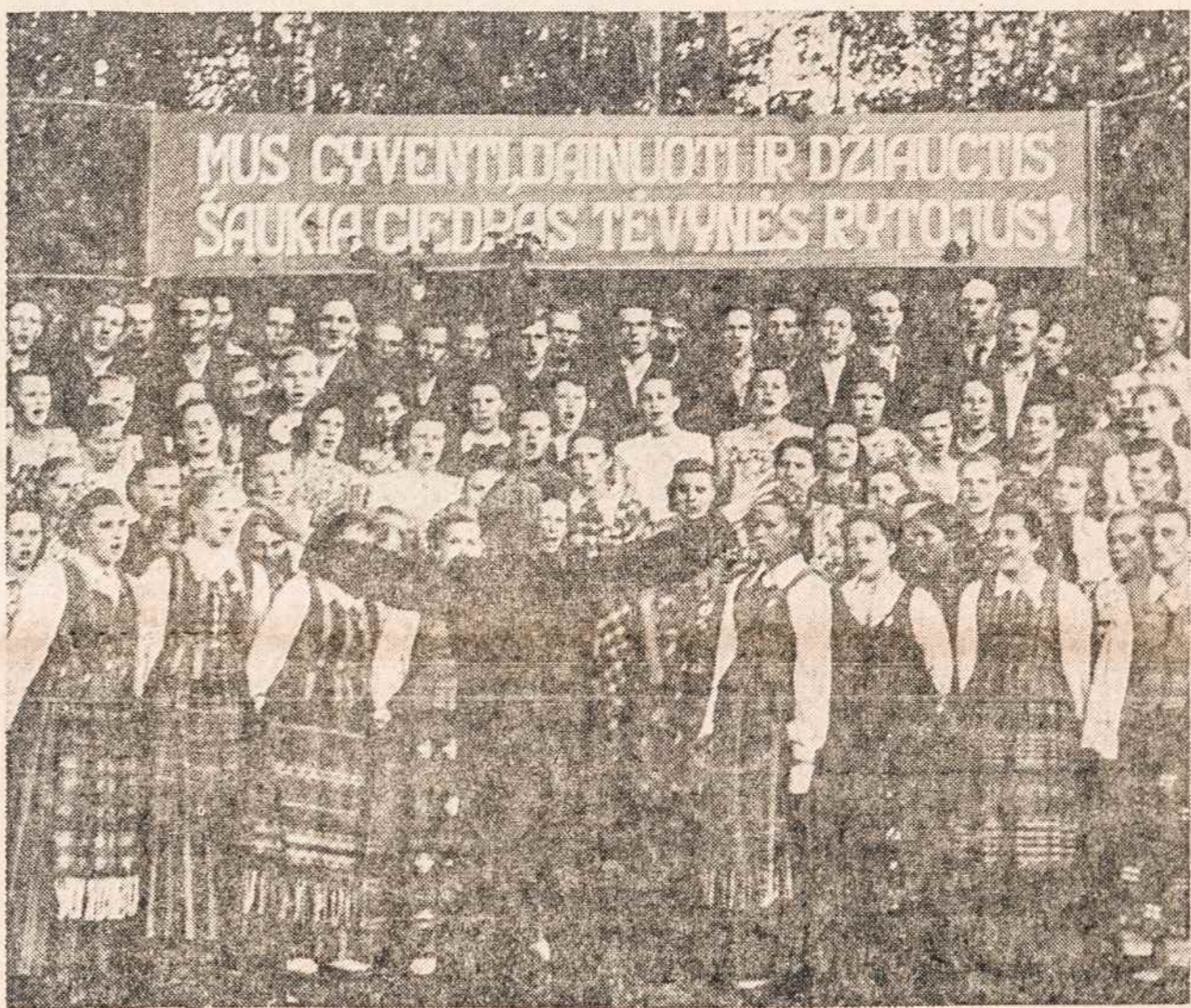
MIROSLAVE, Dzūkijoje, liaudies šventės metu išrašytas žodžiais daina reiškiamas "pasitenkinimas" kolonizacija Lietuvoje.

Kanados atstovas J. G. Diefenbaker savo kalboje tarp kitko pareiškė: "Aš statau šiuos klausimus: kiek žmonių išlaisvino Sovietų Sąjunga... Kanados atstovas J. G. Diefenbaker savo kalboje tarp kitko pareiškė.