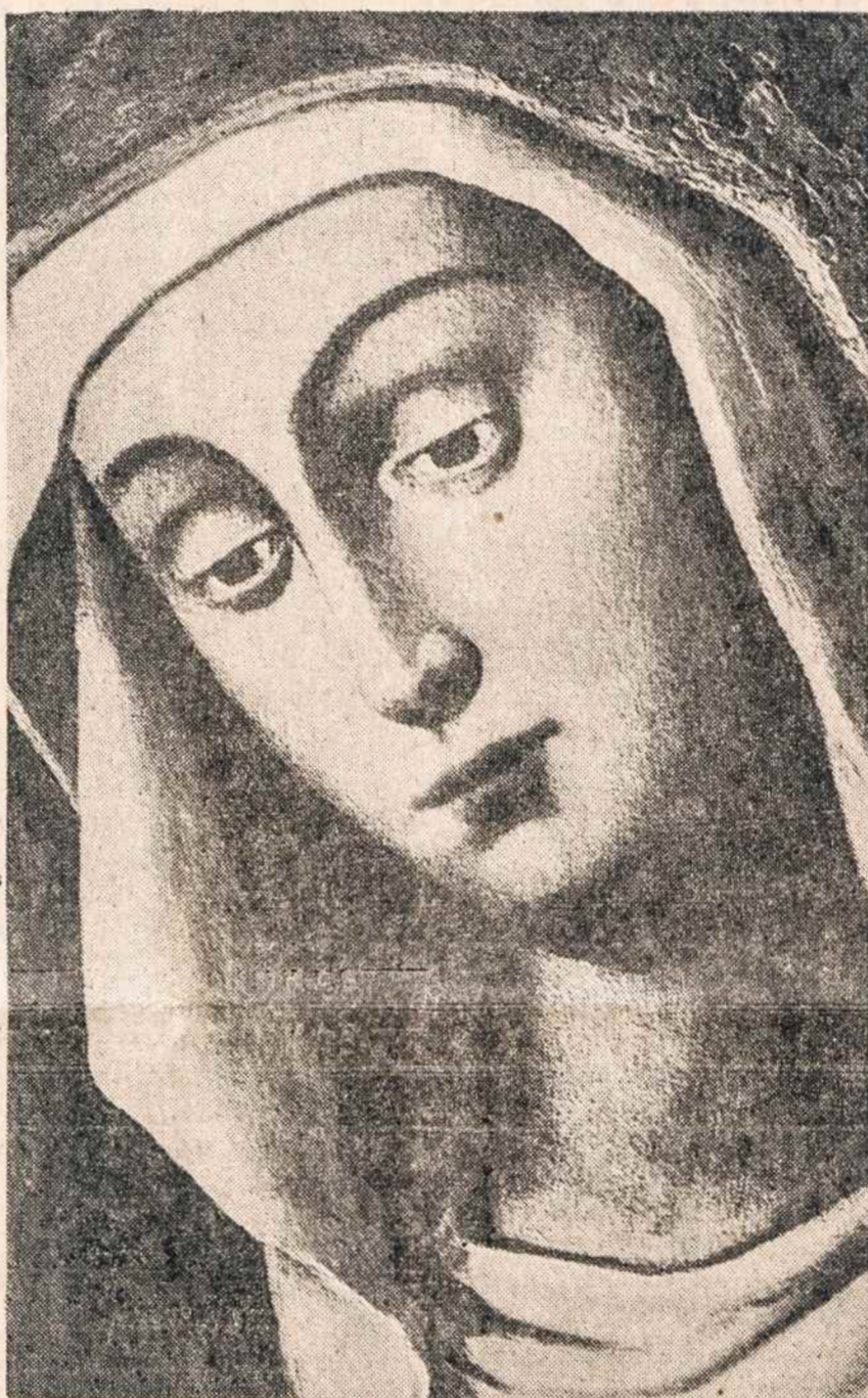
AUSROS VARTŲ MARIJA.

Tuo tarpu kiti, jau apsilvę, išėjo. Patalpa liko tuščia. Vienas iš pirties darbininkų ištraukė iš pasuolės du gumulus