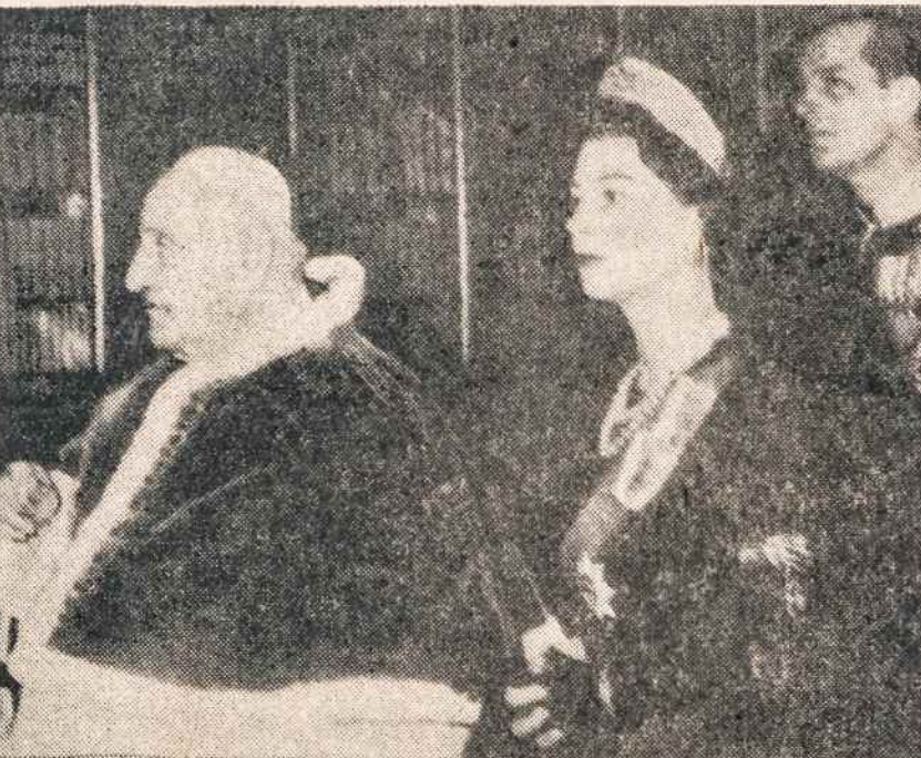
POPIEZIUS JONAS XXIII privačioje audiencijoje priėmė karalienę Elzbieta II ir princą Pilypą. Popiežius padovanojo karalienei 20 senų romėniškų pinigų, įtaisyty rėmuose, o karalienė popiežiui savo šeimos portretą ir mahagoni medžio lazda.

Kas sukliudė žmogaus kelionę raketą? Senato komisija ištyrė, kad Cape Canaveral darbininkų streikai pirmą amerikiečio kelionę raketą nudelsė mažiausia pusę metų.