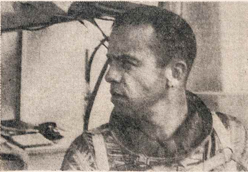
PIRMASIS KELIAUTOJAS ALAN B. SHEPARD, JR.

Laos sukilėliai komunistai gegužės 9 atsisakė kalbėtis su kontrolinės komisijos nariais — jie neturį instrukcijų. Ryšium su tuo pakimba ore ir 14 konferencija. Amerika yra pakartojus, kad ji nedalyvaus, jei nebus kovos sustabdytos, nors dalis delegacijos jau išvyko į Zenevą. Kinija suspėjo paskelbti, kad Amerika boikotuojanti "taiką".