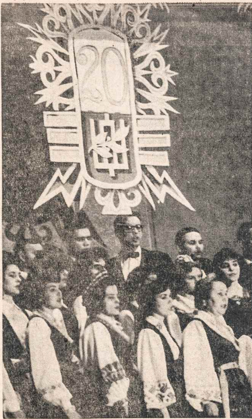
"LIETUVOS ATSIMINIMŲ" radijo programos 20 metų sukakties koncerte dainuoja "Rūtos" ansamblis.