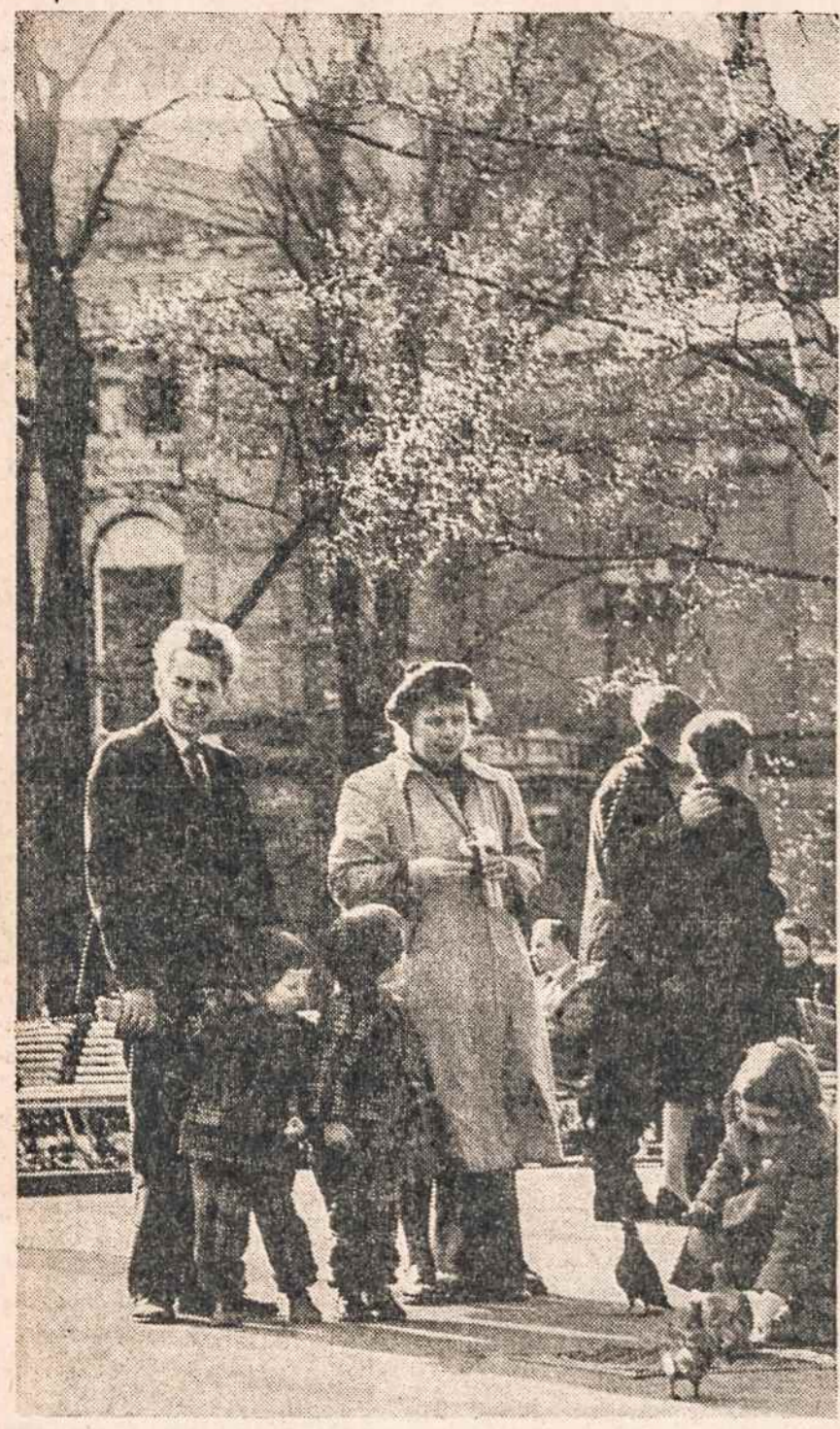
PAVASARIS Oslo mieste, Norvegijos sostinėje. Gilumoje — Valstybinis teatras.

Amerikos naftos firmos Caltex ir Shell pasiuntė laivą su geologų ekspedicija, kurie rankiojo Spitzbergene akmenis. Jų pora helikopterų, kurie skraidė viršum Spitzbergeno, dar labiau nervino rusus. Tokia jau jų prigimtis — manyti, kad kiekvienas žmogus turi būti dar gausesnės — ieškos naftos. Kiekvienas Vakarų išiveržimas jau yra pavojus rusam kurie norėtų turėti tenai monopolį. M.