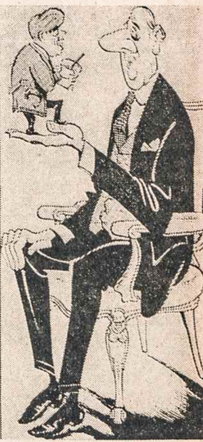
SAKYKIT, Sir, kur yra jūsų pasisekimo paslaptis? — Taip prezidentų Kennedy ir de Gaulle pasimatymą vaizduoja Londono Sunday Telegraph.

— Vokietijoje gegužės 8 suminta nemaža Sovietų agentų. Tik Bavarijoje 18.