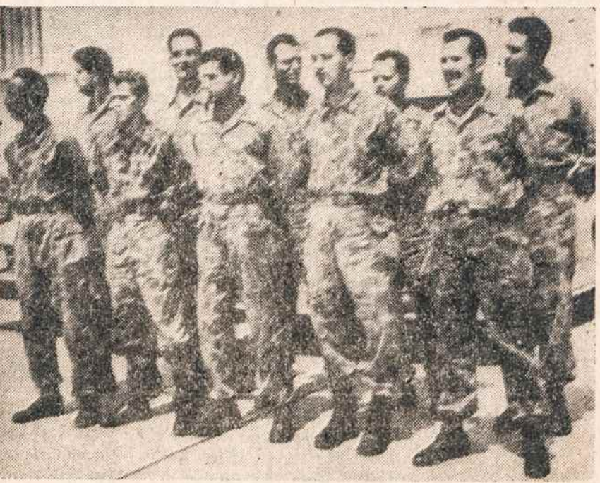
KUBOS BELAISVIŲ DELEGACIJA po derybų Amerikoje dėl traktorių jau išvyko atgal į nelaisvę.