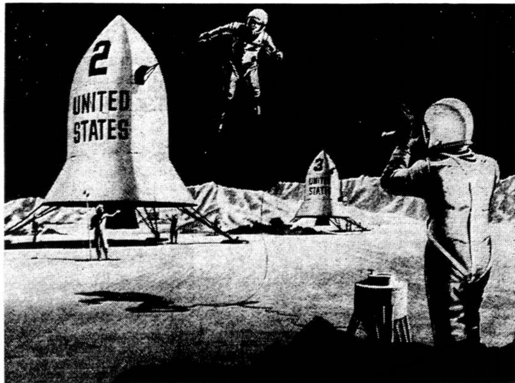
NUSILEIDIMAS MĒNULYJE. Taip įsivaizduojama galimybė apie 1970 metus. Kad žmogus atrodė lyg skrenda, nieko ypatingo Mėnulio trauka 4 kartus mažesnė nei žemės, ir visai natūralu, jei žmogaus suolis į orą bus 10 pėdų.

— Izraelis rasta 30 dinozaurų pėdų. Dinozaurai gyvenę žemėje prieš 70 milijonų metų. Jų pėdų aptikta apie 20 vietų — Massachusetts, Connecticut, Arizonoje, Kanadoje. Bet viduriniuose rytuose pirmu karštu.