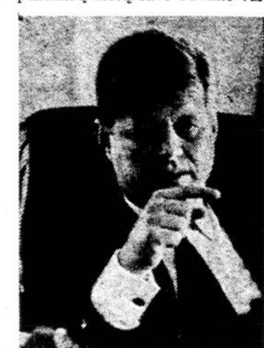
PREZIDENTAS KENNEDY Į TAUTĄ.

Prezidentas Kennedy rugpiūčio 1 kalboje į tautą davė apyskaitą apie ūkinį gyvenimą per pusantrų metų savo buvimo valdžioje.