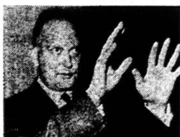
PRIEŠ SUMAŽINIMĄ DABAR: išdo vald. Dillon.

Juodžiau galvojančiai nurodė, kad prezidento ūkinis pata-