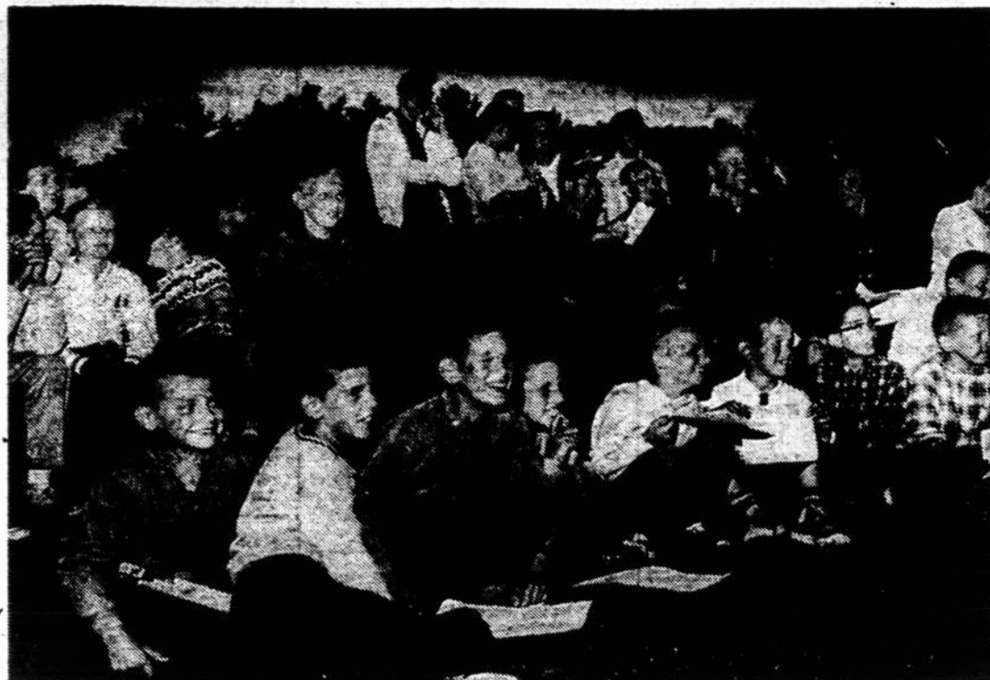
KENNEBUNKPORT, ME., berniukų stovykla vakarinės programos metu.

Drasūs plėšikai. Rugpiūčio 6 11:30 val. dienos metu įėjęs į Community Savings Bank ginkluotas vyras kasininkę paprašė "paskolos". Gavęs 1,100 dol. išėjo sėdosi į mašiną, prie kurios laukė kiti 2 vyrai, ir greit dingo. Banke tuo tarpu tebuvo