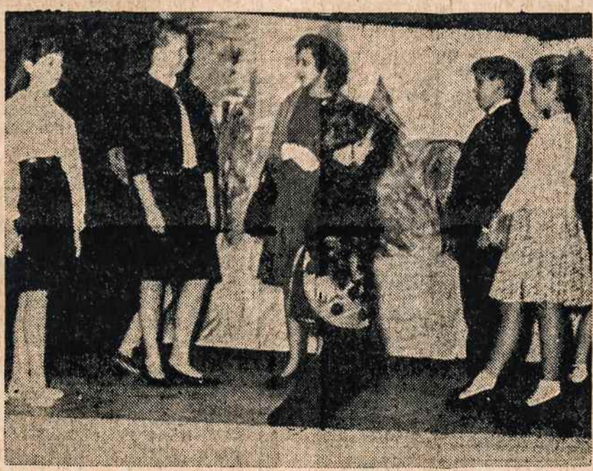
VAIDINIMAS motinos dienos minėjime gegužės 13.