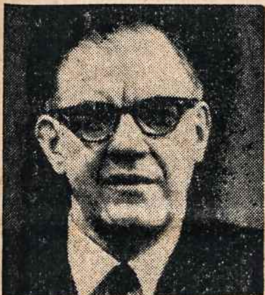
BIZNIO VARDU: Roger M. Blough, plieno korporacijos pirmnickas.

Ryšium ar be ryšio su tuo nepasitikėjimu sujaukino biržoj akcijų kritimas, kokio nebūta nuo 1929. Trečias dalykas — Amerikos aukso rezervai nukrito iki 16.4 milijonų dol. — tai žemiausias lygis per 22 metus.