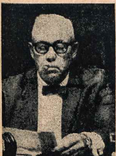
DARBO VARDU: George Meany, AFL-CIO prezidentas.

Vyriausybė galvoja priešingai: tik produktyvumo pakėlimas gali pakelti atlyginimą; gali atpiginti prekę pagaminimo kaina, o atpiginta prekė lengviau suras rinką ir tokiu būdu sudarys sąlygas įjungti pilną Amerikos gamybą. Lig šiol Amerikos fabrikai gamina tik 60 proc. savo pajėgum. Vyriausybė už 40 valandų darbo savaitę.