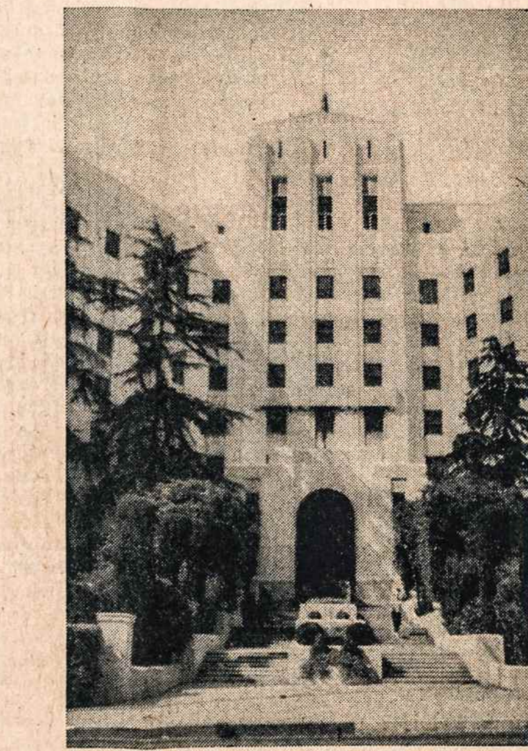
HOLLYWOOD, Calif., Libanų kedrų ligoninė.

Tiesa apie Los Angeles Altą korespondentas balsavo prieš). Ir savo pomirtinėje akcijoje, atrodo, jis Los Angeles kolonijoje siekia išskirti tokias pat diktatorines teises, kokias jo bosas, Naujienų redaktorius, turi Alto centre.