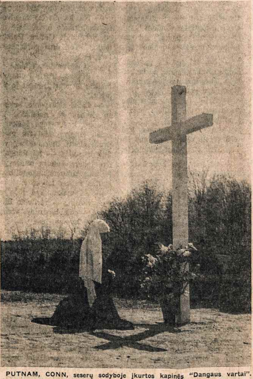
PUTNAM, CONN, seserų sodyboje įkurtos kapinės "Dangaus vartai".

FUNERAL DIRECTORS Henry WEYDIG & Son, Inc. Flushing 9-8563 FUNERAL HOME Charles Weydig, Lic. Mgr. 13-39 122nd St., College Point, N.Y.