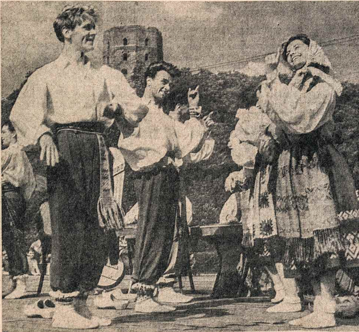
GEDIMINO aikštėje Vilniuje jaunimas šoka tautinius šokius.

2. Tos propagandos žalą matė Lietuvos vyriausybė, bet vis dėlto jos įvežimo neuždraudė, norėdama išlaikyti gerus santykius su Sovietų Sąjunga. Tai ne sovietinė "liaudies demokratija", kuri ir dabar neįsileidžia nekomunistinės spaudos.