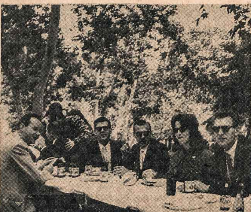
LOS ANGELES lietuvių grupė pirmame šių metų piknike gegužės 20.

Parapiečiai ir Worcesterio lietuvių visuomenė, gerdama jubiliatą, vadovaujant Aušros Vartų administratoriui kun. A. Jankauskui, surengė jam staigmeną — iškilmingą vakarienę,