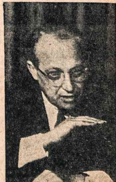
WALT W. ROSTOW

Departamentas sako, kad Rostowo planas nėra nauja politikos linija; opozicija ją vadina nauju appeasementu. Kas ji iš tikrųjų — paaiškės senate