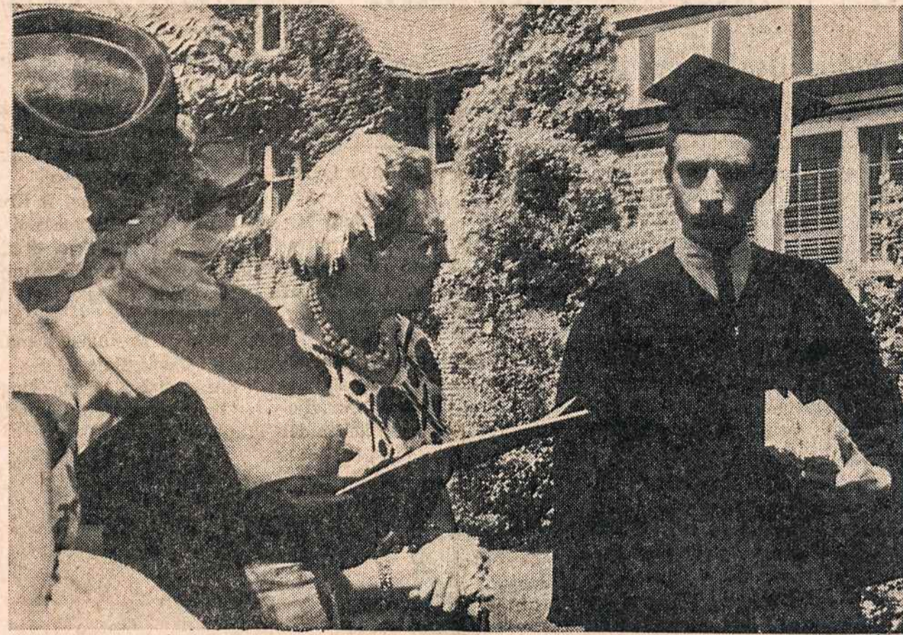
SONELIS gimnaziją baigė Kennebunkporte, Me.

tik Prancūzijos, bet ir visos Europos krikščioniškąją demokratiją". Lamennais jau buvo miręs prieš 24 metus, kai poi. Leonas užėmė šv. Sostą. Tuo metu krikšč. demokratijos idėjos daug plačiau buvo išskleidusios Vokietijoje, negu Prancūzijoje. Leono XIII socialinė enciklikom turėjo žymios įtakos vokiečiams kun. A. Kolpingas, Mainzo vysk. W. E. Ketteleris. Jei Lamennais ir minėtinas, kaip krikšč. demokratijos idėjų pradininkas, tai Leono XIII (nukelta į 4 psl.)