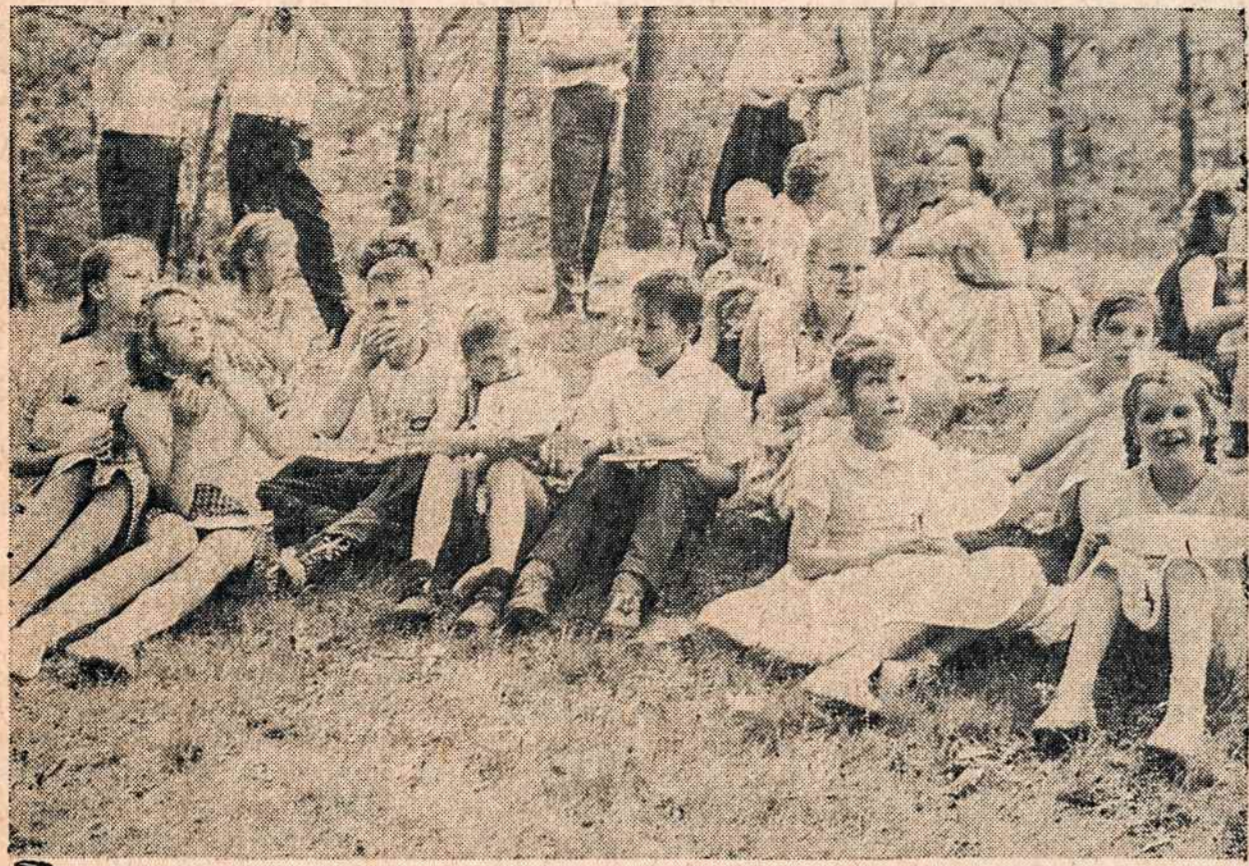
NEW YORKO ateitininkai moksleiviai iškyloje.