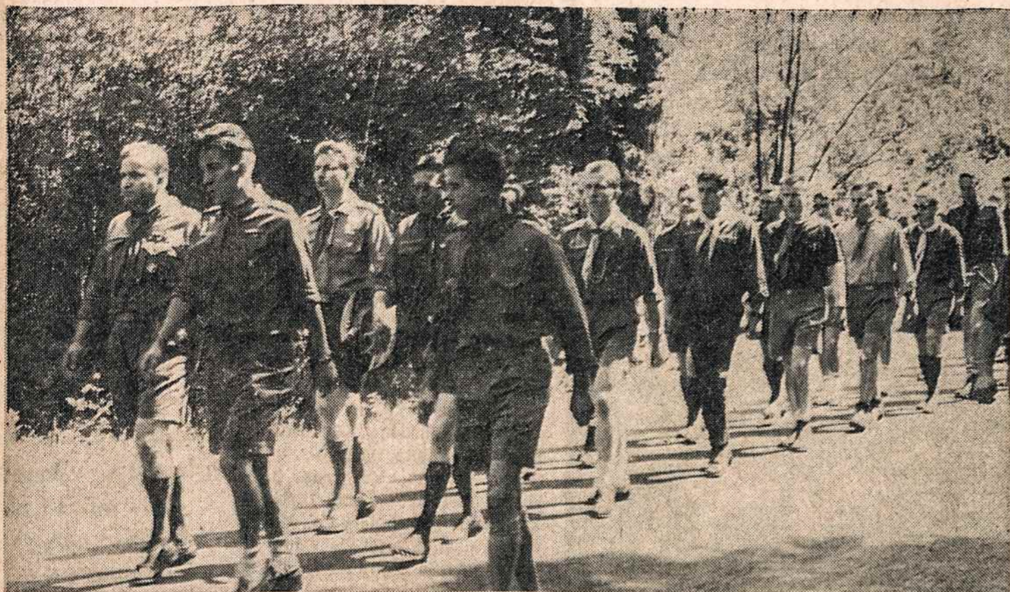
ATLANTO radjono skautai vyčiai No Colebrook, Conn., savo saskrydimo metu birželio 10