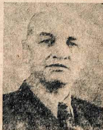
JUSTAS PALECKIS 1940. 7. 16 patvirtino pirmą deportacijos aktą išrašyta v. r. min. M. Gedvilu — išvežti į Sovietų Sąjungą buv. min. pirm. A. Merkį ir buv. užs. r. min. J. Urbsį.