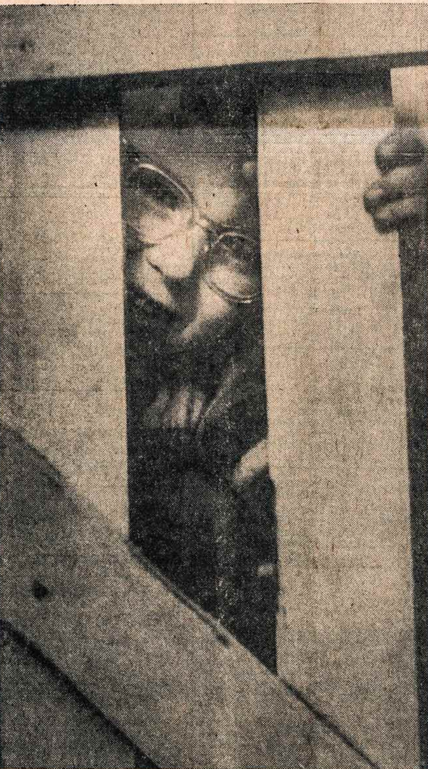
IR AS NORIU | berniukų stovyklą.

būna repetacijos dramos, operos, choro ar baletu vakaro spektaklio programai. Žiūri dešimtimis tūkstančių žmonių. I meno festivalius susirenka tūkstančių žmonių, kurių gatvėje retai gali pamatyti. Gali sutikti poilgiais plaukais jaunuolių, į abi šalis sušukuota barzdele ir dailiai pakirptais ūsiukais. Mergaitės vilki meniškų spalvų drabužiais, kiek sulysusios, bet ugnimi degančios akys greitai prisistato, kad yra įvairių meno mokyklų bei kolegijų studentės.