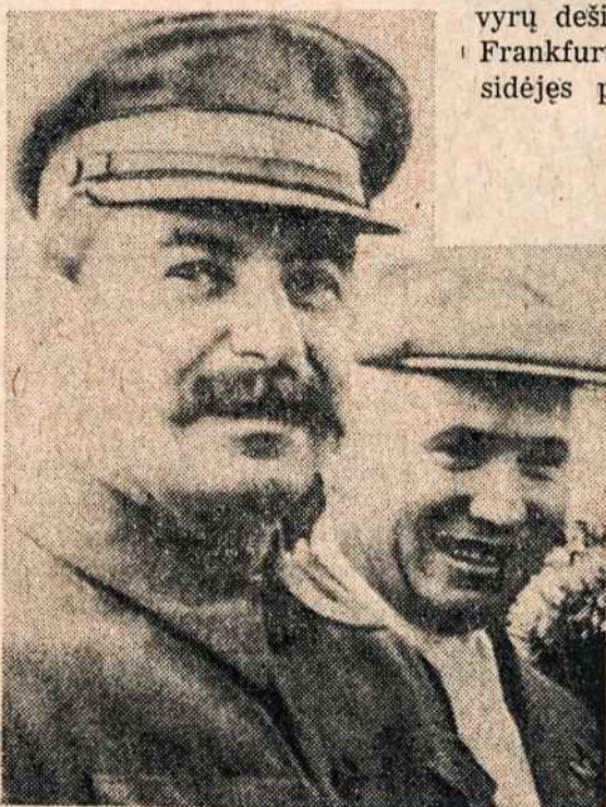
STALINAS IR SEKRETORIUS CHRUSČIOVAS, genocido kaltininkai, atsakingi už 500,000 lietuvių genocidą.

Pačios JV galėtų reikalauti Chruščiovo išdavimo tuo pagrindu, kad jis yra kaltinti-