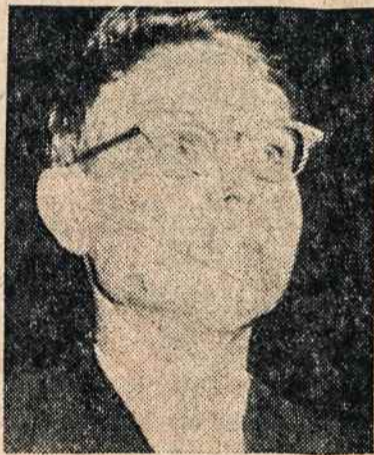
SUSLOVAS Sovietų partijos centro komiteto narys, 1944 buvo priskirtas prie Lietuvos kom. partijos Lietuvai valdyti partizanų žudymais, kaimų deginimais, masiniais trėmimais į Sibirą.