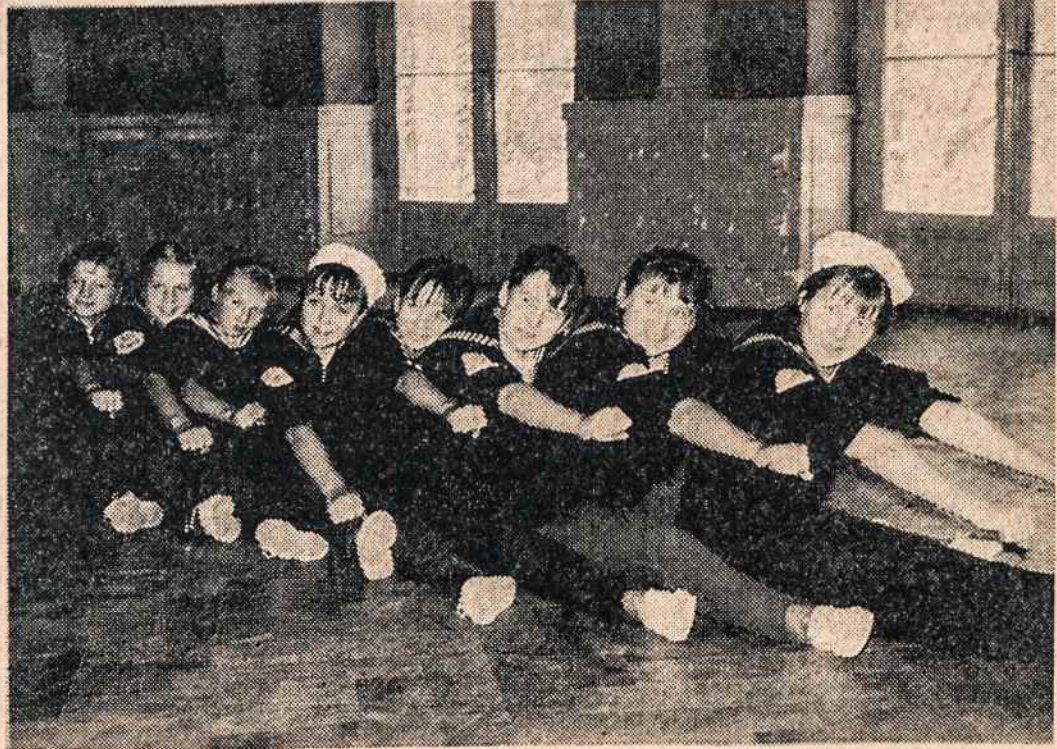
"IRKLUOJA" Vasario 16 gimnazijos šokėjos.