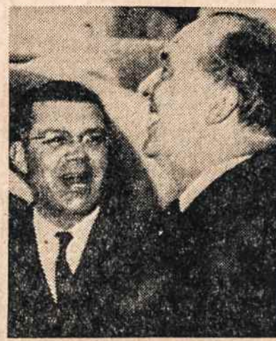
APSAUGOS MINISTERIAI: Thorneycroft ir McNamara.

Tokio sprendimo laukiama iš Macmillano pasikalbėjimo su Kennedy.