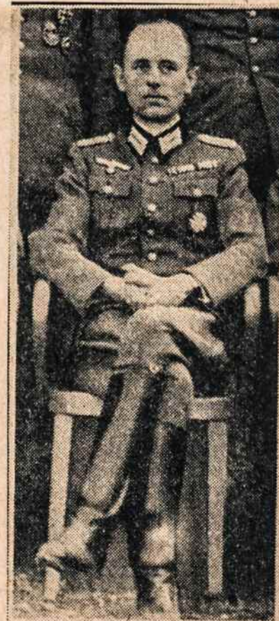
INFORMUOJA AR VYKDO POLITIKĄ: Gen. Behlen.