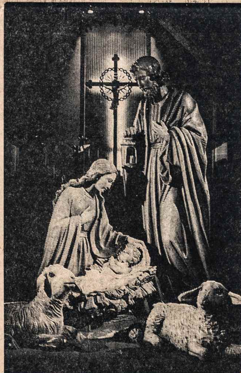
PRAKARTELE šv. Kazimiero bažnyčioje Los Angeles, Calif.

O parapijos pakeisti jis nebegalys. Gal gi mėginti gyvenimą naujai organizuoti — brautis instruktorium į universitetą ir ten pradėti kalbą su jaunuomene?