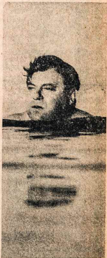
IŠMESTAS IŠ VALDŽIOS LAIVO: F. J. Strauss.

Eina gandai, kad jis pakišo žurnalo leidėjui dokumentus kaip tik pavestas savo organizacijos viršininko gen. Gehleno.