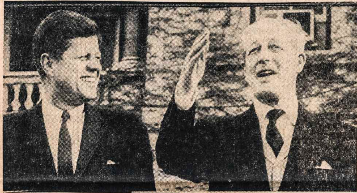
KENEDY IR MACMILLANAS. Saulėtoje saloje, saulėti veidai, gal bus saulėtas ir sutarimas.

Ar yra tikrai priežastinis ryšys tarp žurnalo, Strausso, Gehleno, Ameriko politikos, — paliekam spręsti skaitytojui. Bet dėmesio verta dar viena smulkmena: naujasis apsaugos ministeris, kuris atėjo vietoj Strausso, Kai Uwe von Kasel, esąs konvencionalinės kariuomenės ir šalininkas.