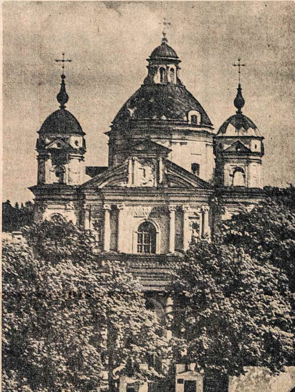
SV. PETRO IR SV. POVILŲ bažnyčia Antakalnyje. Viršium durų matomi žodžiai: "Regina Pacis" — šią bažnyčią yra perkeitęs šv. Kazimiero kūnas.