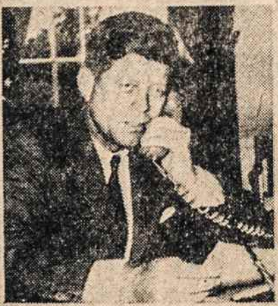
SUGYVENIMO SIMBOLIS: tiesioginis telefonas tarp Kennedy ir Chruščiovo.

— DeGaulle ir Adenaueris vėl susitiks sausio pabaigoje.