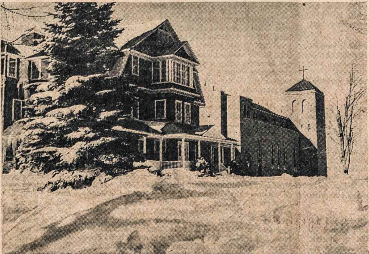
PUTNAMO vienuolynas žiemą.

Rašyti ar skambinti: ANDES, N. Y. Tel. 676-2781