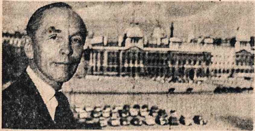
LORDAS HOME, Anglijos užs. reik. ministeris: Mes esame visi tikri, kad ateities Europos uždavinys — priklausyti vienas nuo kito.