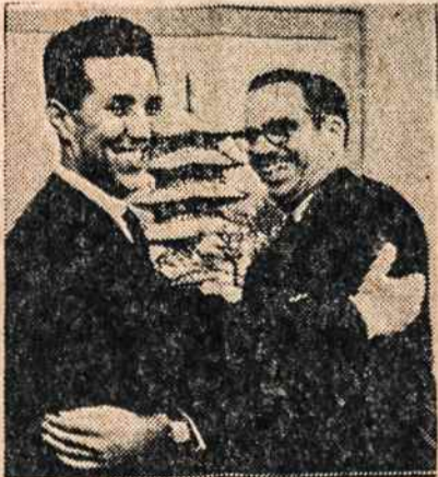
RAUDŌNUJI MEILE. Ben Bella, žadėjęs Kubos prez. Osvaldo Dorticos ištikimybę, atsalo nuo komunizmo.

Alžiro min. pirm. Bella žadėjo eiti Castro pėdom. Bet po