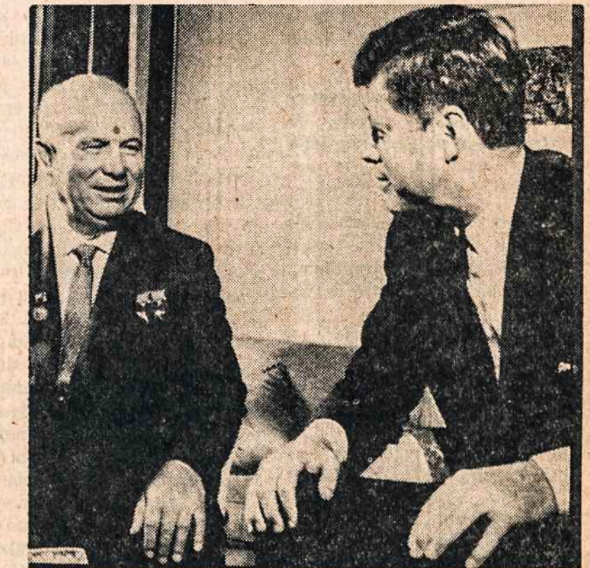
VIENOS PAMOKA. Prez. Kennedy ir Chruščiovas Vienoje 1961 birželio 3-4 susitarė, bet pasirodė, kad susitarimo Chruščiovas nesilaikė, tad geresnė taktika — veikti nesutarus.

Siūloma ir praktikuojama strategija: saugoti Chruščiovo prestižą, daryti vienpusines nuolaidas be jokio susitarimo iš anksto