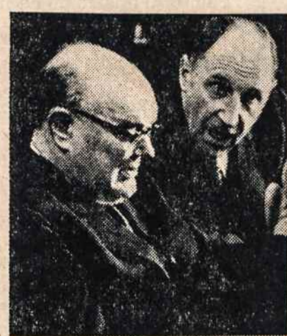
MAZIEJI NASUS — Belgijos ir Olandijos ministrai prieš de Gaulle.

Praktiškai jos jau tai padarė. Jos atmetė Prancūzijos finansų ministerio siūlomą Bendrosios Rinkos finansų ministerių konferenciją, kuri turėjo apriboti užsienio kapitalo investavimą į šių valstybių prie-