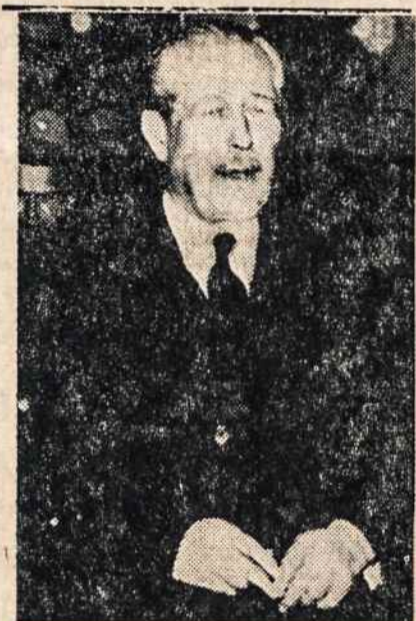
DURU NEATIDARIUS — Anglijos min. pirm. Macmillanas

kybą tarp Amerikos ir Anglijos, jis laikinai pagelbės Anglijai pergyventi tai, ko ji neteko neįleista į Bendrąją Rinką. Ir Prancūzija nėra užsikirtus neįsileisti Anglijos. Tačiau turi praeiti tam tikras laikas, iki Anglija išsivaduos iš „Amerikos priklausomybės“.