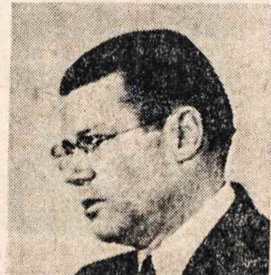
MCNAMARA, apsaugos sekretorius.

Iš tos atominų ginklų padėties jis darė išvadą, jog reikia abipusių pastangų įtampai atleisti.