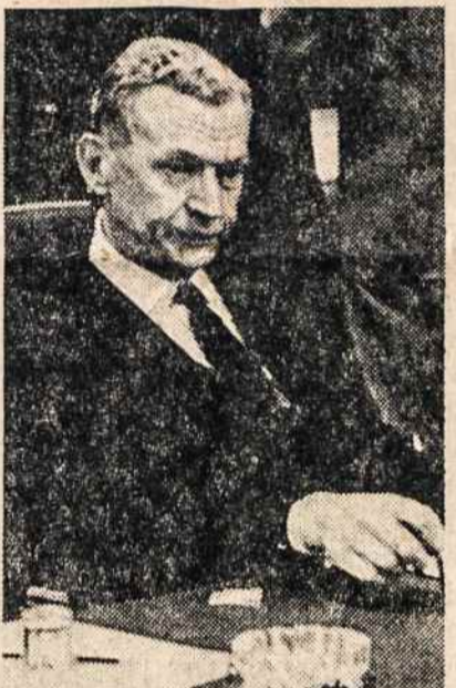
DURIS UZDARĖS — Prancūzijos ministeris Couve de Murville.