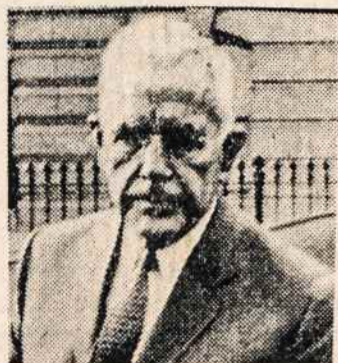
MCCONE, CIA direktorius.

dėl atominio apsiginklavimo. „Mes artinamės į laikus, kada didėja negalimybė vienai pusei sunaikinti antros pusės pakankamai didelį atominės jėgos kiekį“.