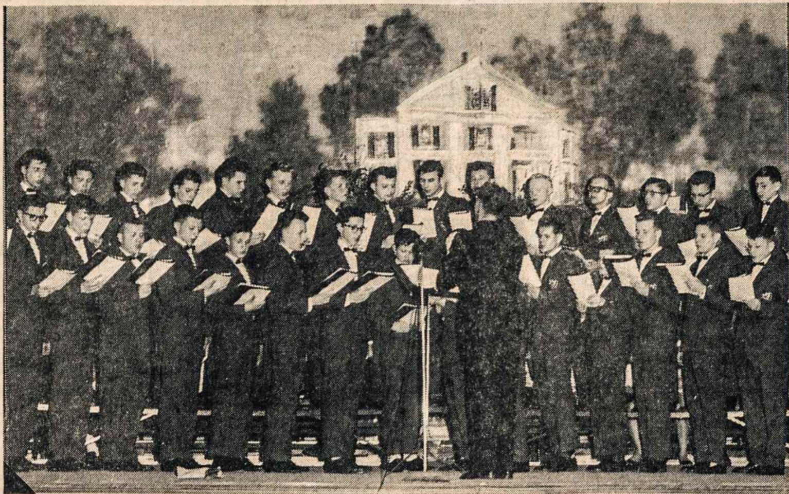
SV. ANTANO gimnazijos choras koncertuoja Kennebunk miesto salėje, kai miestas minėjo Jurgio Washingtono gimtadienį 1962 vasario 22.