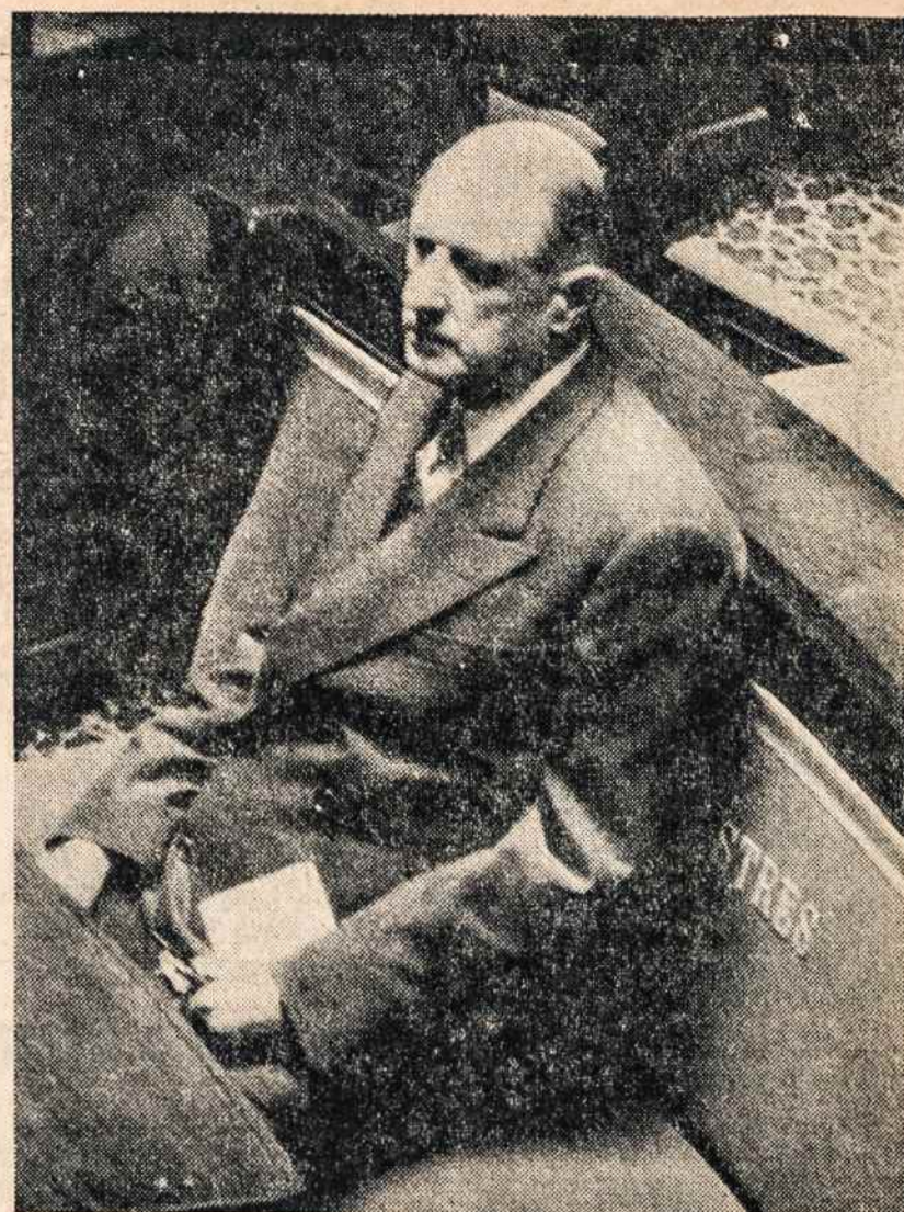
CHARLES DE GAULLE parlamente.

"Žinoma, problemos, su kuriomis tenka susidurti, reikalauja, kad būtų palikta laisvė diskusijoms, iš kurių turi ir gali paaiškėti įvairios idėjos, pasiūlymai, pagerinimai, daromi asmeniu, kurie nėra susirišę su partijomis. Nereikia tikriausiai laukti, kad praeitų laikų peitynių profesionalai atsiskaitytų, bent dabartiniu momentu, spiaudytis tulžimi ir vėmti ac-