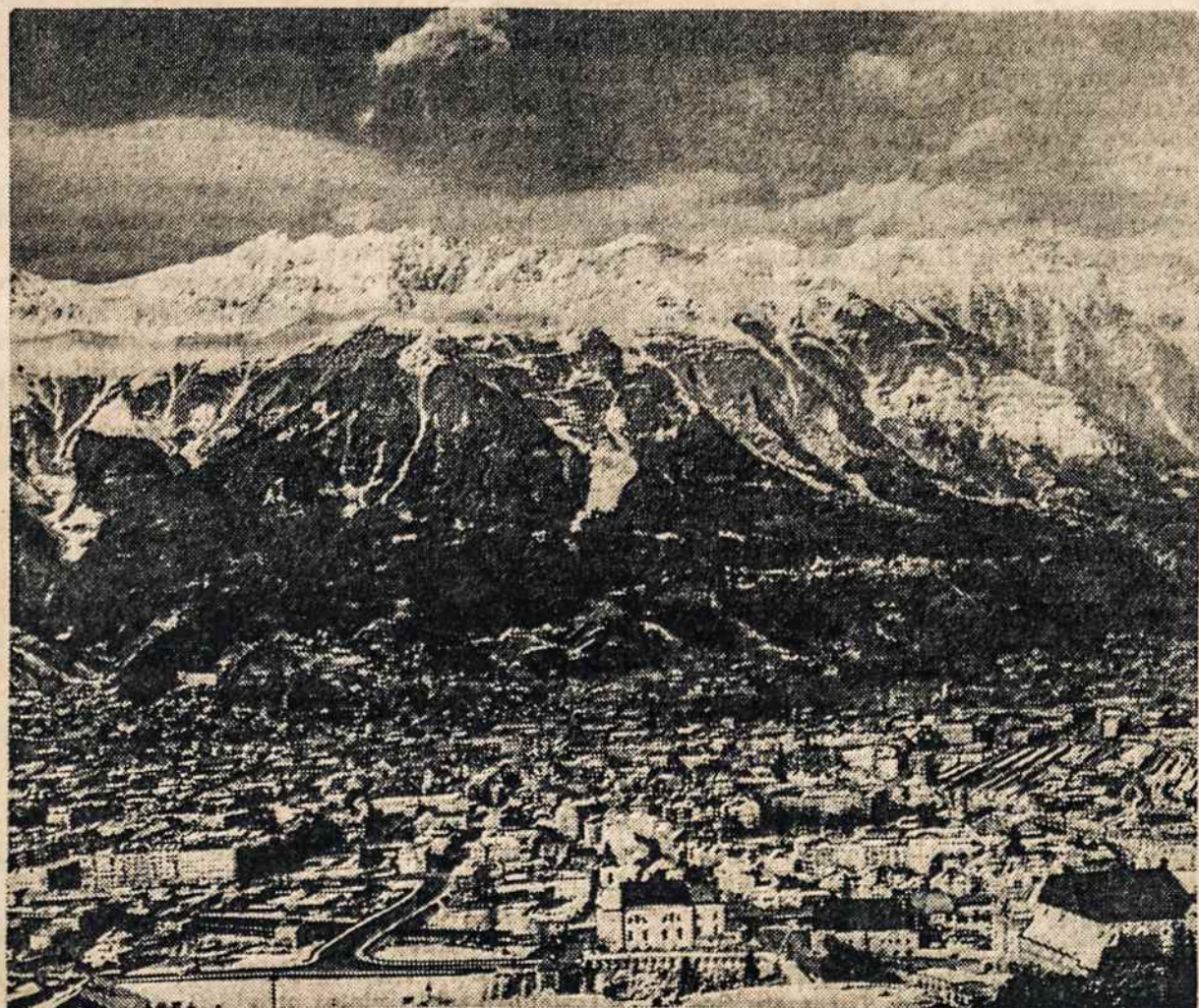
INNSBRUCK. Austrijos Tyroly prie Alpių kalnų.

Sekmadienį, Vasario (Feb.) 17 d. 1963 m., 10:30 v. ryt. Šv. Trejybės Bačnyčioje, Newark, N. J.