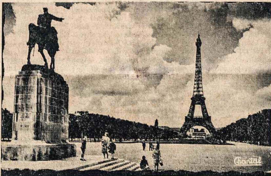
PARYZIAUS miesto dalis su Eifelio bokštu.