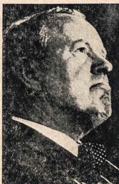
KONKURENTAS. Kanados rinkimuose prieš Diefenbakerį stoja liberalų lyderis Pearsonas.

Kanados parlamentas pareiškė vyriausybei nepasitikejimą, ir min. pirm. Diefenbakeris pasirūpino parlamentą paleisti. Rinkimai bus balandžio 8. Sakoma, kad Diefenbakeris norės laimėti antiamerikinę nuotakom. Jo didžiausias varžovas yra liberalų lyderis Pearsonas.