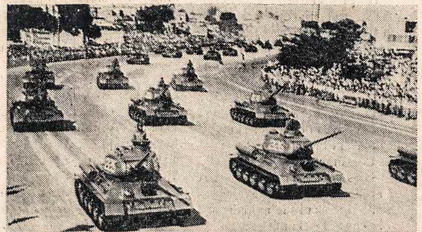
SOVIETŲ tankai Kuboje.

Bet lieka dar neišaiškintas klausimas dėl tos oro priedangos — ar toki pat pareiškimai kaip aukštųjų pareigūnų buvo duodami mažesniųjų, kurie tremiravo tuos Kubos karius ir rengė juos laimėjimui ar mirčiai? Po ilgo tytelimo ir jie prabilo (b.d.).