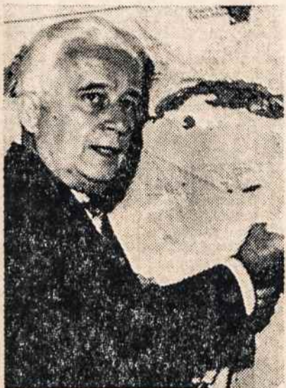
SEN. KEATINGAS, antru kartą prabilęs apie grėsmę Kuboje.

Ryšium su kilusiu nerimu dėl Kubos, skirtingom informacijom iš Kongreso ir vyriausybės — CIA direktorius John A. McCone vasario 6 paskelbė, kad tik „palyginti maži kiekiai sovietų karinių reikmenų atgabenta į Kubą“ nuo to laiko, kaip Jungtinės Valstybės nuėmė karantiną pernai spalio 24.